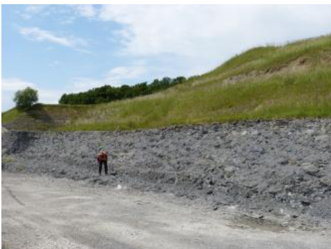
Tonsteine der Opalinuston-Formation

Je höher der Gehalt an \text{Al}_2\text{O}_3 (Tonerde) und je geringer der Flussmittelgehalt (Feldspat, Calcit, Eisenoxide) sind, desto höher liegt der Schmelzpunkt des Tons und desto höher ist seine Feuerfestigkeit . Liegt der Schmelzpunkt bei besonders \text{Al}_2\text{O}_3 -reichen Tonen bei einem Wert über 1790 °C (SK 36), wird der Ton als „hoch feuerfest“ bezeichnet. Illitische Tone enthalten im Wesentlichen glimmerähnliche Dreischicht-Tonminerale (Illite).