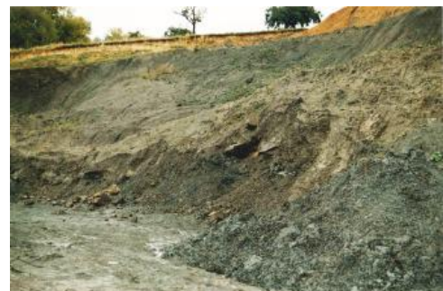
Der Anceps-Oolith trennt die Renggeritone von den Tonsteinen der Ornatenton-Formation.

In Baden-Württemberg sind stark tonig-schluffige, schichtige Sedimentgesteinskörper die Grundlage der Herstellung grobkeramischer Produkte ; feinkeramische Rohstoffe (Porzellanerden, Bentonit) gibt es in Baden-Württemberg nicht in bauwürdigen Vorkommen. Als Ziegeleirohstoffe werden Tone und (aufgewitterte) Tonsteine, Lösslehme und Lehme verwendet; idealerweise werden Mischungen von fetteren Tönen und feinsandig-siltigen Lehmen verwendet. Wirtschaftlich interessante Ziegeleivorkommen sind solche, die unterschiedliche stark tonige und siltig oder feinsandige Körper auf selber Lagerstätte oder unmittelbar benachbart aufweisen, so dass je nach Produkthanforderung verschiedene Rohstoffmischungen erstellt werden können.