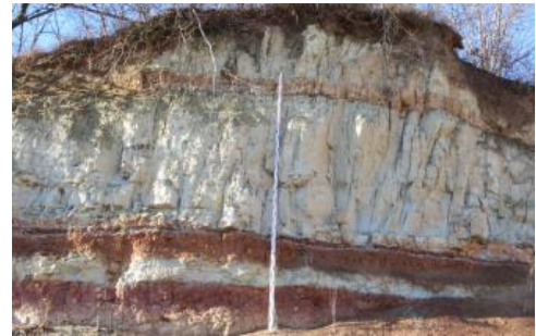
Tonsteine und überlagernde Sandsteine der Unteren Süßwassermolasse bei Stockach