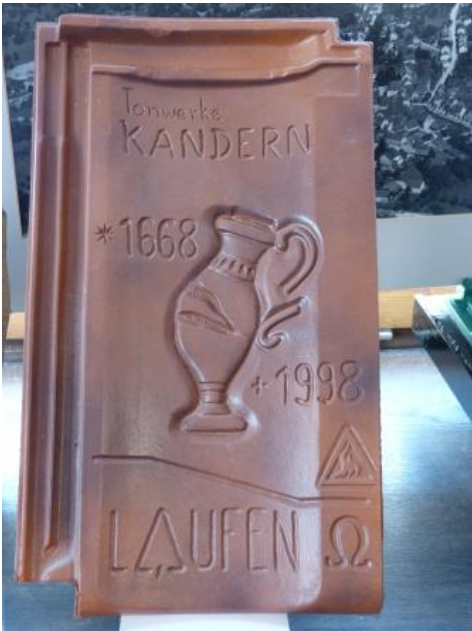
Letzter Falzziegel aus dem im Jahr 1668 gegründeten Tonwerk Kandern

Tonsteine mit homogener Beschaffenheit und großer Mächtigkeit wie z. B. der Opalinuston-Formation werden auch als Zuschlagstoff bei der Portlandzementherstellung verwendet. Beispiele dafür sind die Tongrube Withau bei Schömberg (Mitteljura, Opalinuston-Formation) oder ehemals die Tongruben Geisingen (Mitteljura, Achdorf-Formation) und Hölzle bei Tuningen (Unterrjura, Obtususton-Formation).