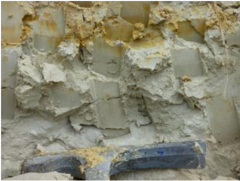
Kaolinerde mit Verbraunungshorizont

Zu den Ziegeleirohstoffen (= grobkeramische Rohstoffe) zählen Tone, Tonsteine, Löss, Mergel, Mergelsteine und Lehme.