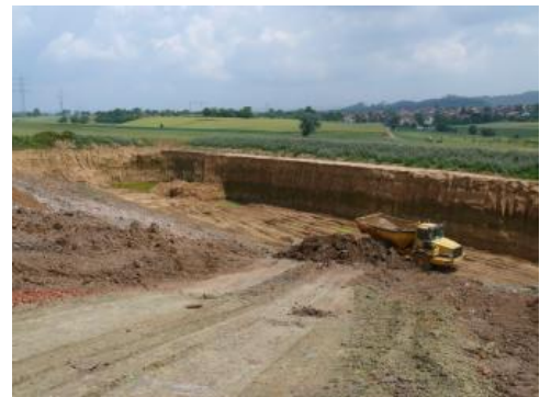
Abbau von Löss und Lösslehm

Tone, Tonsteine, Löss, Mergel, Mergelsteine und Lehme, die alle in der grobkeramischen Industrie Verwendung finden, werden in Tagebauen mittels Baggern und Raupen gelöst. Schon im Tagebau (Tongrube) erfolgt die Homogenisierung des Rohstoffs , also das Vermischen von unterschiedlich tonig-sandigen Schichten. Störend wirken sich beim Brennvorgang der Ziegel stets Dolomit- und Kalkkonkretionen bzw. -linsen aus, weshalb die genannten Sedimente nach dem Abbau im Freien aufgehaldet und oft mehrere Jahre der Verwitterung ausgesetzt werden (Kalklösung).