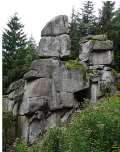
Wollsackverwitterung im Raumünzach-Granit

Im südlichen und westlichen Odenwald kommen neben dem Heidelberg-Granit (Biotit-Granit) auch der Granodiorit des Weschnitz-Plutons und der Diorit des Diorit-Gabbro-Komplexes für diese Nutzung in Betracht; ein Abbau für die o. g. Einsatzbereiche erfolgt derzeit nicht; historisch war die Verwendung als Mauer-, Bruch-, Pflaster- und Randstein örtlich von Bedeutung.