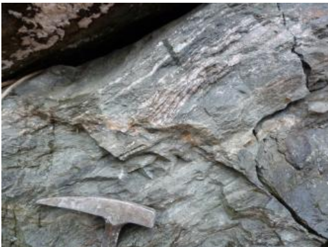
Randgranit mit deutlicher Regelung

Die Plutonite bilden aus magmatischen Schmelzen entstandene, sehr große, massige, unregelmäßig geformte, tief reichende Körper (im Schwarzwald vermutlich noch ca. 4–8 km). Die durch geologische Kartierung nachgewiesene flächenhafte Ausdehnung beträgt oft zwischen 50 und etwas über 100 km 2 , der Triberg-Granit im Mittleren Schwarzwald hat eine noch größere Ausstrichfläche von ca. 250 km 2 . Nutzbare Partien weisen in Bezug auf ihre Lithologie und die sich daraus ergebenden Materialeigenschaften einen einheitlichen Aufbau auf.