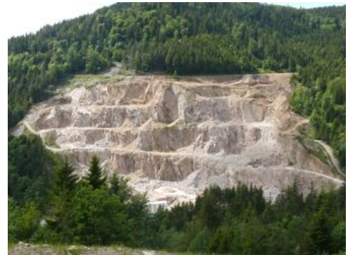
Der Seebach-Granit ist ein hell- bis mittelgrauer Zweiglimmergranit

Die magmatischen Ganggesteine (Ganggranite, Granitporphyre, Lamprophyre etc.) „durchschlagen“ sowohl die Plutonite als auch die Metamorphite des Oden- und Schwarzwälder Grundgebirges. Wegen ihrer meist geringen Mächtigkeit können sie, von wenigen Ausnahmen abgesehen, i. d. R. nur als beibrechender Rohstoff abgebaut werden.