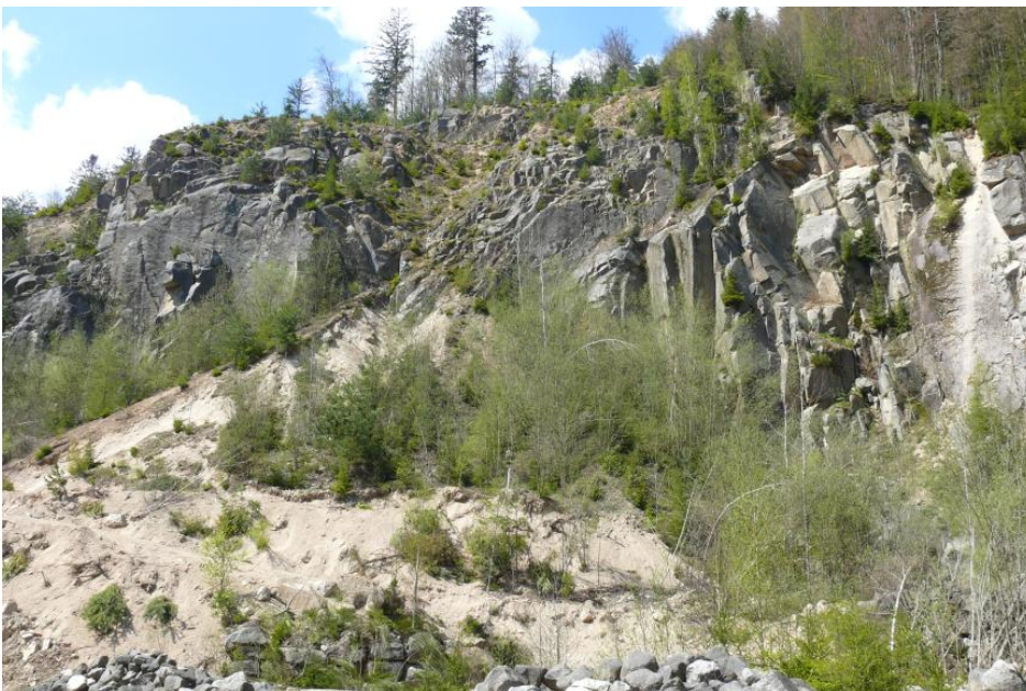
Der Forbach-Granit (GFO) und die als Raumünzach-Granit bezeichnete Varietät gehören zu den Zweiglimmergraniten des Nordschwarzwalds.

Der vorwiegend hell- bis dunkelgraue Granodiorit des Weschnitz-Plutons ist meist mittelkörnig, z. T. auch grobkörnig ausgebildet. Die Hauptbestandteile Plagioklas , Orthoklas , Quarz , Hornblende und Biotit sind gleichmäßig im Gestein verteilt. Durch die meist gleichkörnige Ausbildung des Gesteins, d. h. die regelmäßige Verzahnung der einzelnen Minerale, ist es sehr hart und zäh.