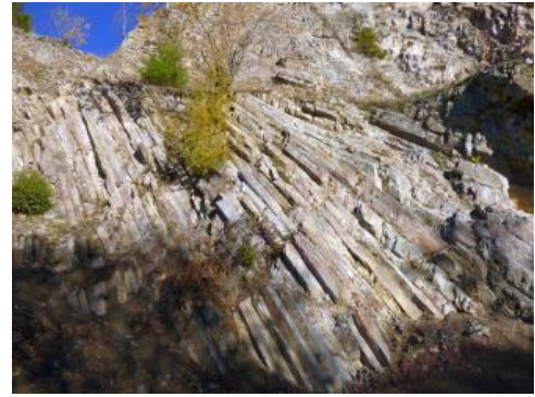
Säulig absondernder Quarzporphyr

Die größten Quarzporphyrvorkommen Baden-Württembergs liegen im südlichen, dem sog. Bergsträßer Odenwald bei Weinheim und Dossenheim–Schriesheim. Die Mehrzahl der Vorkommen sind vulkanische Decken, welche bei Dossenheim–Schriesheim sowie im Nordschwarzwald bei Baden-Baden und im Mittleren Schwarzwald (Diersburger Tal, Gereuter Tal bei Lahr-Reichenbach, Schutttertäl, Freiamt) anzutreffen sind. Örtlich wurden die Pyroklastika zusammen mit dem unterlagernden metamorphen Gebirge hydrothermal verkieselt. Eine bedeutende Abbaustätte erschließt die Spaltenfüllung bei Ottenhöfen im Nordschwarzwald. Der Münstertäler Quarzporphyr im Südschwarzwald wurde zunächst als Decke, später als Calderastruktur mit Ignimbritfüllung gedeutet (Westphal, 1994).