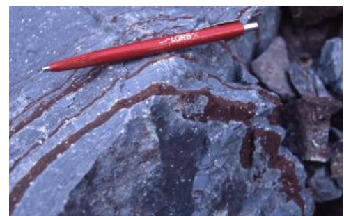
Brandeck-Quarzporphyr mit der typisch violettgrauen Farbe und den charakteristischen Einsprenglingen

1) Quarzporphyre sind alte, fast überall hydrothermal überprägte Rhyolithe. Entlang des Westrands des Odenwalds sowie des Schwarzwalds sind an verschiedenen Stellen die vulkanischen Gesteine des Permokarbons vorhanden. Die Dehnung der Kruste im Oberkarbon und Unterperm (Rotliegend) führte zur Bildung von tektonischen Gräben und Horsten. Im Rotliegenden setzte ein explosiver Vulkanismus ein. Dabei entstanden Schlot- und Spaltenfüllungen sowie mächtige deckenartige Laven, Pyroklastika (Tuffe) und Ignimbrite (Glutwolkenablagerungen), die als „Quarzporphyre“ bezeichnet werden.