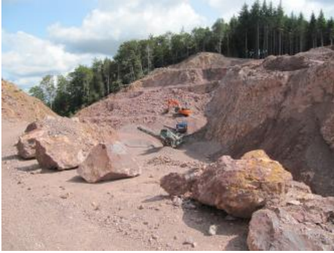
Abbauwand aus verkieseltem Kesselberg-Tuff

Der Phonolith wird im Steinbruch bei Bötzingen im Kaiserstuhl mittels Bohren und Sprengen gewonnen, bei der Aufbereitung erfolgen Brechen, Walzen, Mahlen/Tempern, Brennen, Mahlen. Der Phonolith findet folgende Verwendung: Baustoffindustrie, Zementerzeugung, Tiefbau, Glasindustrie, Umweltschutz, Tierfuttermittelverbesserung, Düngemittel und Bodenverbesserung, Wasserbehandlung, Medizin, Kosmetik.