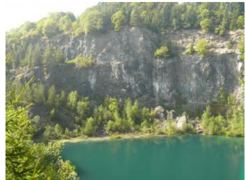
Basalt am Hegauberg Höwenegg

3) Deckentuffe des Tertiärs im Hegau: Eine Besonderheit bildet das Deckentuffvorkommen am Rosenegg im südlichen Hegau. Es handelt sich um ein O–W-streichendes Vorkommen Spaltenfüllung). Die Bezeichnung „Deckentuffe“ geht auf die deckenförmige Morphologie des Vorkommens zurück.