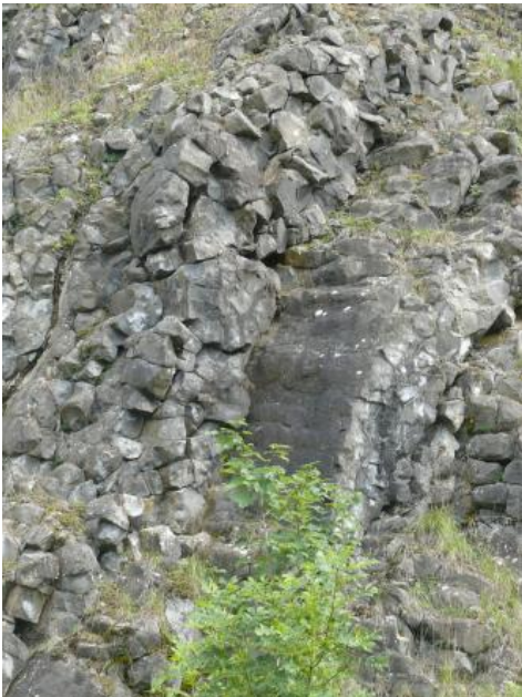
Basaltsäulen in Meilerstellung

1) Quarzporphyre (Rhyolithe) treten als massige, dichte, meist gelbbraune, hell- bis dunkelviolette, rotviolette bis blaugraue, aber auch rötliche und grünliche Gesteine auf. Im frischen Zustand zeigt das Gestein einen scharfkantigen, splittrigen, unregelmäßigen bis muscheligen Bruch. Im angewitterten Zustand besitzt es eine hellbraune bis gelbliche Farbe. Säulige Absonderungen sind häufig. Quarzporphyre bestehen i. d. R. aus einer sehr feinkörnigen, gut verzahnten Grundmasse aus Quarz, Feldspäten und Glimmer, in der größere Kristalle von Quarz und von Feldspat schwimmen (= porphyrisches Gefüge).