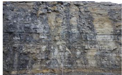
Dünn- bis mittelbankige, teilweise plattige Kalksteine

Mehrere Meter mächtige, dickbankige flachmarine Schillkalkstein-Lager treten in den beiden, heute noch für die Naturwerksteinproduktion genutzten Einheiten der Crailsheim-Schichten (Trochitenkalk-Formation ; Schillkalkstein mit vielen Trochiten) und der Quaderkalk-Formation (Meißner-Formation; dicht gepackter Schillkalkstein; Gebiet Krensheim-Grünsfeld) im obersten Bereich des fränkischen Muschelkalks auf. Mächtige (z. T. mehrere Meter bis knapp 20 m) oolithische Kalksteine sind der Liegendoolith und der Marbach-Oolith (beide Trochitenkalk-Formation, Gebiet Hochrhein-Wutach-Baar) sowie der Döggingen-Oolith (Meißner-Formation) und der Hangendoolith in der Rottweil-Formation (ebenfalls Gebiet Hochrhein-Wutach-Baar); sie wurden früher als Werkstein genutzt.