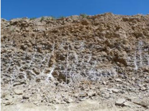
Frisch gesprengter Plattenkalk