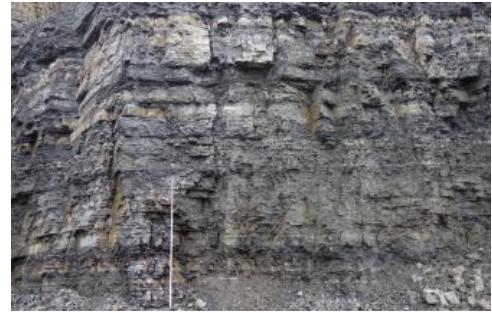
Wechselfolge aus plattigen bis dünnbankigen Kalksteinen und dünnen Tonmergelsteinlagen

Die marinen Gesteine des Oberen Muschelkalks (unterer Teil: Trochitenkalk-Formation, oberer Teil: Rottweil-Formation, Quaderkalk-Formation und Meißner-Formation) bestehen aus einer Wechselfolge von vorwiegend dünn- bis mittelbankigen, oft auch plattigen, feinkörnigen, z. T. schwach fossilführenden, grauen, mechanisch widerstandsfähigen Kalksteinen und grauen, meist nur wenige Zentimeter oder Dezimeter mächtigen Tonmergelsteinen . In den Haßmersheim-Schichten (Trochitenkalk-Formation) werden die Tonmergelsteinlagen max. 1–2 m mächtig. Eingeschaltet in diese Wechselfolge sind oft mittel- bis dünnbankige, selten dickbankige graue Schillkalksteine und oolithische Kalksteine .