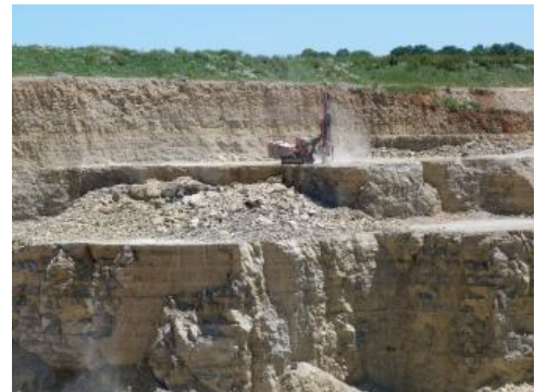
Steinbruch im Oberen Muschelkalk bei Zimmern ob Rottweil

Naturwerksteine: Der „Crailsheimer Muschelkalk“ wird derzeit nur im Steinbruch Satteldorf-Neidenfels (Kernmühle) gewonnen. Der „Krensheimer Quaderkalk“ wird in ca. 20 kleinen Steinbrüchen gewonnen. Zur schonenden Gewinnung der Rohblöcke, die sich stets am Klufnetz orientiert, werden unterschiedliche Verfahren eingesetzt. Crailsheimer Muschelkalk: Der Abbau geht durch randliches, perforierendes Bohren und nachfolgendes sanftes Ablösen durch Sprengen mit Sprengschnur und z. T. Schwarzpulver vorstatten. Die 2–3 m 3 großen Blöcke werden im Natursteinwerk in Satteldorf weiterverarbeitet. Fränkischer Quaderkalk: Die im Vergleich zum Crailsheimer Muschelkalk kleineren Rohblöcke werden mit dem Radlader schonend aus der Wand gerissen bzw. abgehoben.