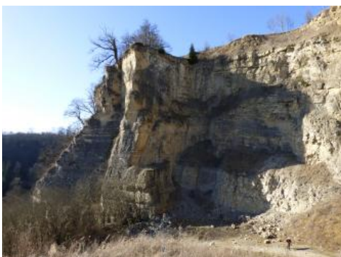
Stillgelegte Gewinnungsstelle im Oberen Muschelkalk

Die Kalksteine des Oberen Muschelkalks bilden landesweit flächenhafte, schichtige Rohstoffkörper . Sie fallen überwiegend mit wenigen Grad nach SO oder O ein. In den Randbereichen des Kraichgaus ist das Einfallen örtlich auch nach N oder S gerichtet. Auf kurze Entfernung schnell wechselnde Einfallsrichtungen der Lagerstättenkörper treten insbesondere in den tektonisch beeinflussten Gebieten des Ostrands des Oberrheingrabens, des Kraichgaus und des Dinkelberges auf. In den einzelnen Abbaustellen ist die Schichtlagerung oft annähernd horizontal; dort gelegentlich auftretende wellige Schichtverbiegungen gehen auf die Ablaugungsvorgänge in den Salinargesteinen (Gips, Anhydrit und Steinsalz) des unterlagernden Mittleren Muschelkalks zurück.