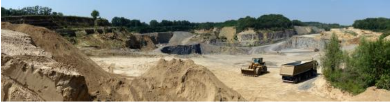
Übersichtsaufnahme des in Abbau befindlichen Bereichs im zentralen Teil des Steinbruchs Nussloch / Wiesloch-Baiertal (RG 6618-2). Blick von Osten nach Westen. Im Vordergrund ist zwischengelagerter Löss zu sehen, der teilweise von der Firma verwertet wird.

In den Zementwerken Leimen und Wössingen werden die Kalk- und Tonmergelsteine des Oberen Muschelkalks als Hauptrohstoff für die Herstellung verschiedener Zementsorten verwendet.