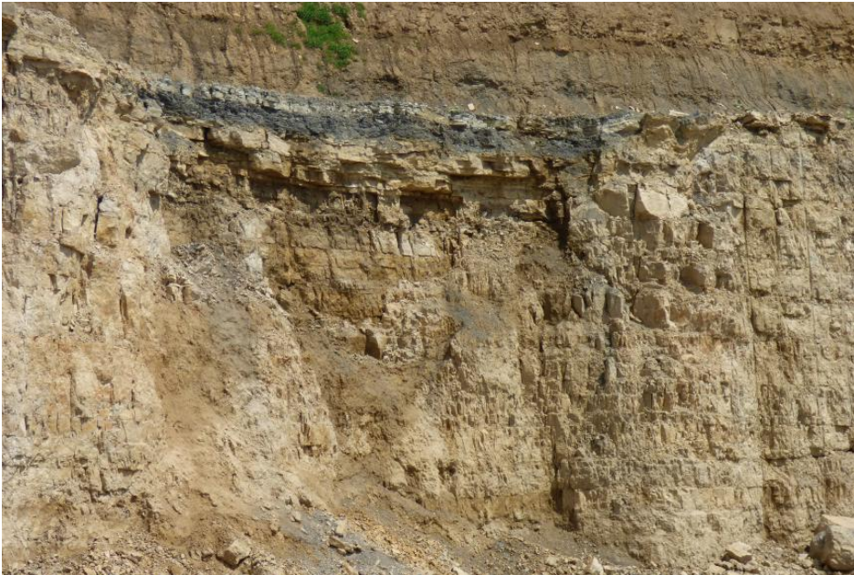
Gebankte Dolomitsteine des Trigonodusdolomits