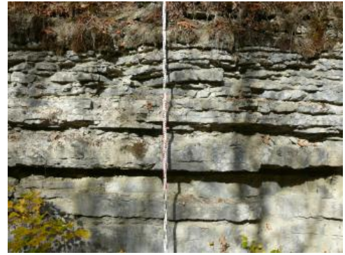
Kalksteinbänke im stillgelegten Steinbruch Deißlingen

Naturstein: Die für die Natursteingewinnung nutzbare Mächtigkeit des Oberen Muschelkalks erreicht im Kraichgau und im Raum Heilbronn zwischen ca. 65–70 und max. knapp 90 m ; dort können im unteren Teil der Trochitenkalk-Formation teilweise auch die z. T. stärker kalkig entwickelten Gesteine der Haßmersheim-Schichten und die Kalksteine der unterlagernden Zwergfaunaschichten genutzt werden. Sehr oft liegt aber die Basis des nutzbaren Oberen Muschelkalks am Top der Haßmersheim-Schichten, die wegen ihres hohen Tonmergelsteinanteils und des damit bedingten hohen Aufbereitungsaufwands bzw. Aufbereitungsverlusts nicht mehr genutzt werden. Zudem wird der Abbau dort auch durch die Funktion der Haßmersheim-Schichten als Grundwassergeringleiter (Aquiclude, Aquitarde) aus hydrogeologischer Sicht auf dieses Niveau begrenzt. Im Verbreitungsgebiet des Trigonodusdolomits sinkt die nutzbare Mächtigkeit des kalkigen Oberen Muschelkalks nach Süden am Hochrhein bis auf ca. 40 m . Durchschnittlich werden landesweit ca. 40–60 m der Abfolge des Oberen Muschelkalks genutzt.