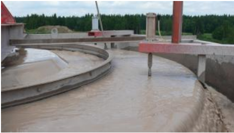
Hydroklassierung in der Sandaufbereitung.

Gewinnung: In weit über hundert kleinen Sandgruben wurden früher Bau-, Form- und Fegesande abgebaut. Bis zum Jahr 2000 waren noch über 30 Gruben in Betrieb, heute sind es in den Stubensandstein-Schichten noch sieben. Die wichtigsten liegen bei Esslingen und Gschwend; in einigen können – dort, wo die Verwitterung noch nicht ansetzen konnte – auch „beibrechend“ Werksteinblöcke für Renovierungsarbeiten oder für den Garten- und Landschaftsbau gewonnen werden. Die Gewinnung der Sande aus verwitterten Sandsteinen sowie der unverwitterten Sandsteine erfolgt mittels Bagger bzw. Radlader im Trockenabbau . Die Aufbereitung des Materials findet zumeist vor Ort mit einer stationären bzw. mobilen Brech- und