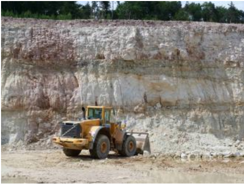
Stubensandsteingrube bei Kernen im Remstal

Sande aus durch Verwitterung weitgehend entfestigten Keuper-Sandsteinen, den sogenannten Mürbsandsteinen , treten in taschenförmigen Partien des Kiesel- und Stubensandsteins auf. Vor allem die Mürbsandsteinvorkommen im Kiesel- und Stubensandstein 2 können aufgrund ihrer hohen Quarzgehalte (ca. 85–90 %) wirtschaftlich interessant sein. Die vorwiegend dolomitisch, untergeordnet kieselig zementierten, harten, meist nur flachgründig verwitterten Sandsteine des Kiesel- und Stubensandstein 1, in die sich oft mehrere dm bis 1–3 m mächtige Tonsteinlagen einschalten, kommen nicht für eine Sandgewinnung in Betracht. Vor allem aus verwitterten Sandsteinen im Stubensandstein wurde früher in zahlreichen, meist kleinen Gruben Sand für den örtlichen Bedarf gewonnen. Die Gruben waren überwiegend in den tonig-kaolinitisch gebundenen Sandsteinen des Mittleren und Oberen Stubensandsteins angelegt worden. Die genutzten Mächtigkeiten