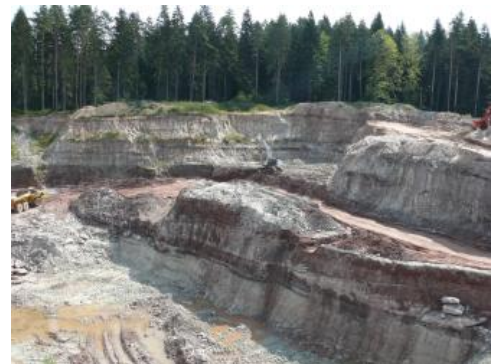
Abbauwand einer Mürbsandsteingrube bei Gschwend

Die aus den Keuper-Sandsteinen durch Verwitterung und Lösung des Gesteinsbindemittels hervorgegangenen Quarzsande sind jungtertiär- bis quartärzeitliche Bildungen. Die bankigen, häufig schräggeschichteten Mürbsandsteine sind grob- bis mittelkörnig, zum Teil mit feinsandigen und fein- bis mittelkiesigen Partien. Gebunden sind die Komponenten der festen Sandsteine durch ein toniges, karbonatisches oder schwach kieseliges Bindemittel (Zement). In die Sandsteine sind in unregelmäßiger Verbreitung und unterschiedlicher Tiefenlage rote und grüne Ton- und Schluffsteine eingeschaltet.