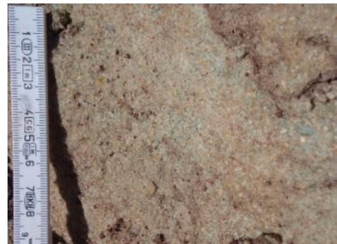
Mürber Mittel- bis Grobsandstein.

Reine Quarzsande („Glas-Sande“) werden in der Keramik-, Glas- und metallurgischen Industrie verwendet. Bei gleichmäßiger Zusammensetzung werden sie zusammen mit Kaolin und Feldspat als Zuschlag für die Herstellung von Porzellan und vielen modernen Keramikwerkstoffen eingesetzt.