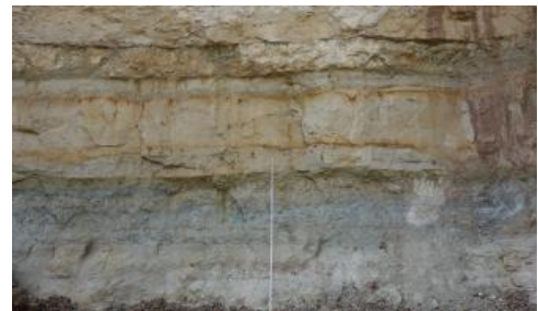
Sandsteinbänke im Westen des Steinbruchs Kernestetten

Genutzte Mächtigkeit: Die früher genutzten Mächtigkeiten lagen meist bei wenigen Metern ; heute können durch maschinelle Baggerung noch halbfester Partien und maschinelle Zerkleinerung dieses Materials auch Mächtigkeiten bis über 20 m genutzt werden.