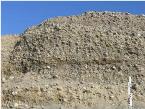
Kieswand im Trockenabbau

Die genannten Kiesvorkommen enthalten neben der Hauptkomponente Kies vor allem Sand sowie als „Steine“ (63–200 mm) oder „Blöcke“ (> 200 mm) bezeichnete grobe Komponenten, außerdem geringe Anteile von Ton, Schluff und organischem Material. Die Kies- und Sandablagerungen im Oberrheingraben lassen sich in mehrere, übereinander gestapelte Kieslager gliedern. Diese werden von stark steinigen, zum Teil blockigen Fein- bis Grobkiesen mit einem Sandanteil überwiegend zwischen 25 und 35 % aufgebaut. Die Gesteinskomponenten bestehen aus Geröllen, die durch Transport in fließenden Gewässern aus dem Abtragungsschutt der Alpen, des Schweizer Juras und der Randgebirge des Oberrheingrabens (Schwarzwald, Vogesen) in den letzten 2,6 Millionen Jahren hervorgegangen sind. Im Oberrheingraben bewirkte der weite Flusstransport der Gerölle aus den Alpen, dass vorwiegend sehr feste