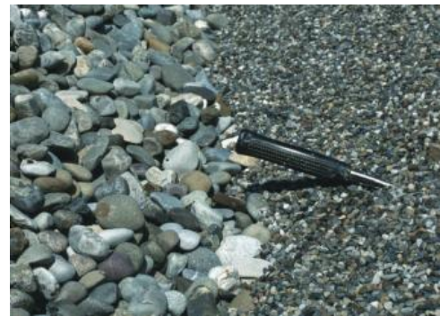
Klassierung in Feinkies und Grobkies

Gewinnung: Die Gewinnungstechnik richtet sich nach der Festigkeit, der Mächtigkeit und der Grundwasserführung der Kiesablagerungen. Im Oberrheingraben herrscht aufgrund des meist geringen Grundwasserflurabstands Nassbaggerung mit großen schwimmenden Greifer- oder Saugbaggern vor, die Tiefen von 80 m und mehr erreichen können. Über schwimmende Bandanlagen sind diese mit dem Kieswerk verbunden. Im Alpenvorland erfolgt Trockenabbau mit Baggern und Radladern, in nagelfluhreichen Vorkommen wird bisweilen auch Sprengtechnik eingesetzt. Eimerkettenbagger sind allgemein nur noch selten in Nutzung. Bei allen größeren Kiesgruben ist die Aufbereitung (Vorabsiebung, Waschen, Klassierung, Splitterzeugung usw.) unmittelbar angeschlossen; Kiese und Sande aus kleinen Abbauen in geringmächtigen Vorkommen werden meist in mobilen Anlagen oder in einer zentralen Anlage aufbereitet, die mehrere nahe gelegene Gruben bedient. Erzeugt werden in den Kies- und Sandgruben Baden-Württembergs Natursande, Brechsande, Rundkiese, Kies-Sand-Gemische, Splitte und Brechsande, Edelsplitte und Edelbrechsande, Schotter und kornabgestufte Gemische.