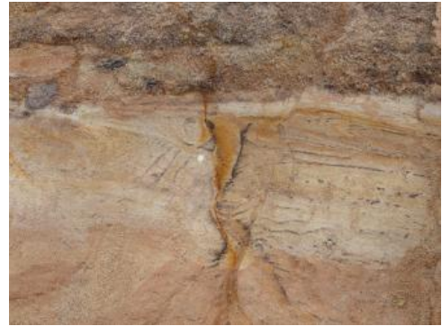
Unterschiedliche Sandlagen der Goldshöfe-Sande.

aus Milchquarz und verwitterten Feldspäten. Die pliozänen Sande des Oberrheingrabens gehen vor allem auf die Abtragung der sich im Tertiär herauswölbenden Buntsandstein-Schichten zurück. Auch in quartären Sandablagerungen des Oberrheingrabens kann der Quarzgehalt lokal so stark ansteigen, dass man von Quarzsanden sprechen kann, insbesondere dann, wenn große Mengen umgelagerter pliozäner Sande enthalten sind.