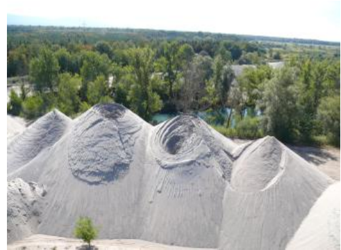
Aus den quartären Kieslagern des Oberrheingrabens durch Aufbereitung abgetrennte Fein- bis Grobsande.