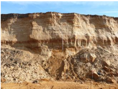
Mittel- bis grobkörnige Goldshöfe-Sande – Sandgrube nordwestlich von Aalen

Zu dieser Rohstoffgruppe gehören lockere bis halbfeste Sandvorkommen in quartär- und tertiärzeitlichen Ablagerungen; zu den halbfesten Sandvorkommen zählen auch die Mürbsandsteine im Sandsteinkeuper. Die wichtigsten Sande bzw. Quarzsandvorkommen dieses Typs sind die miozänen Rinnenablagerungen bei Ulm, die als Grimmelfinger Graupensande bekannt sind. Genutzt werden auch Sande der jungtertiären Oberen Meeresmolasse, vor allem des Grobsandzugs im Raum Stockach, Meßkirch und Pfullendorf. Auch Grusvorkommen über tiefgründig verwitterten Graniten, Porphyren und Gneisen gehören zu dieser Gruppe der Steine und Erden-Rohstoffe. Zu den quartärzeitlichen Ablagerungen fossiler Flussstäler zählen die Goldshöfe-Sande (früher auch: „Goldshöfer Sande“), die in nach Süden entwässernden, mäandrierenden Flusssystemen von Ur-Brenz, Ur-Kocher und Ur-Jagst während des Pleistozäns abgelagert