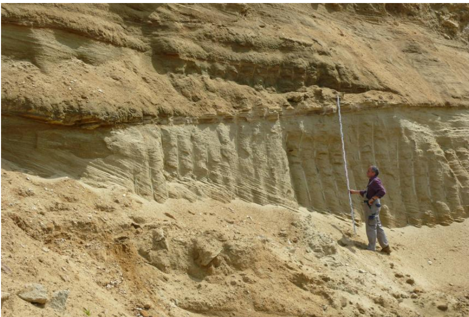
Quarzsande des jungtertiären Grobsandzugs (Obere Meeresmolasse) bei Meßkirch-Rengetsweiler.

Sandige z. T. kiesige Rohstoffkörper bestehen vorherrschend aus Quarz und Tonmineralen , untergeordnet treten Karbonate, Feldspäte, Gesteinsbruchstücke und Schwerminerale auf. Die Gruse bestehen wie ihre plutonischen bzw. metamorphen Ausgangsgesteine aus Quarz-Feldspat-Glimmer-Aggregaten . Die Sedimentation erfolgte zumeist unter fluviatilen Bedingungen in unterschiedlichen Ablagerungsräumen.