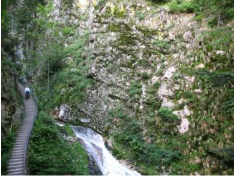
Granitfelsen am Wasserfall bei Allerheiligen

Plutonite (Tiefengesteine) sind magmatische Gesteine, die durch die Erstarrung von Gesteinsschmelzen in tieferen Teilen der festen Erdkruste entstanden sind. In der Regel fällt der Bildungsraum der Schmelzen nicht mit dem Erstarrungsraum zusammen, meist drängen Gesteinsschmelzen entlang von Schwächezonen in der Kruste auf und bilden Tiefengesteinskörper (Plutone), die häufig von einem Netz von Ganggesteinen umgeben sind. Im Zuge der variskischen Gebirgsbildung sind vorwiegend saure – untergeordnet auch intermediäre und basische – Schmelzen intrudiert. Sie bilden die Gruppe der variskischen Plutone. Granitplutone treten dabei am häufigsten auf. Der Granitoid-Komplex umfasst Granodiorite sowie teils metasomatisch oder anatektisch überprägte granitoide und plutonitartige Gesteinskomplexe. Basische bis intermediäre Plutonite bilden den Diorit-Gabbro-Komplex.