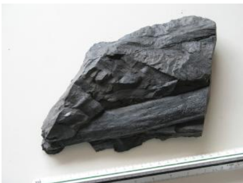
Pflanzenreste im Oberkarbon von Berghaupten

Zu dieser Untergruppe gehört in Baden-Württemberg nur eine Einheit, die Berghaupten-Formation . Sie besteht aus einer Abfolge von grauen Arkosen, Grauwacken und Konglomeraten mit eingeschalteten kohligen Schlufftonsteinen und 2–4 m mächtigen Steinkohleflözen, die bis Anfang des 20. Jahrhunderts abgebaut wurden. Die Schichtenfolge lagert unmittelbar auf dem Kristallin auf und wurde noch im Karbon von Gneis tektonisch überschoben, weshalb sie keinen stratigraphischen Kontakt zu anderen sedimentären Einheiten hat.