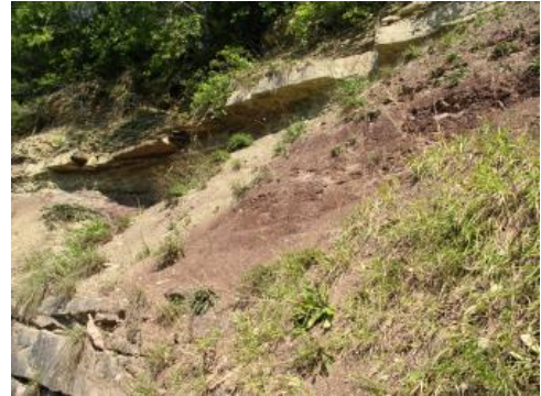
Oberer Buntsandstein, Glatten bei Freudenstadt

Der Ausdruck Buntsandstein wurde zuerst um 1780 aus didaktischen Gründen eingeführt, um in den damals weltweit ersten akademischen Vorlesungen zu Geologie und Erdgeschichte (an der Bergakademie Freiberg in Sachsen) diese Sandsteinabfolge vom „Roten Sandstein“ (dem heutigen Rotliegenden) zu unterscheiden. Da im Schwarzwald auch der Buntsandstein überwiegend in roten Farben ausgebildet ist, gab es anfangs Unsicherheiten in dessen Zuordnung, bis zwischen 1820 und 1830 die Einstufung und Abgrenzung zum Schwarzwälder Rotliegenden geklärt war.