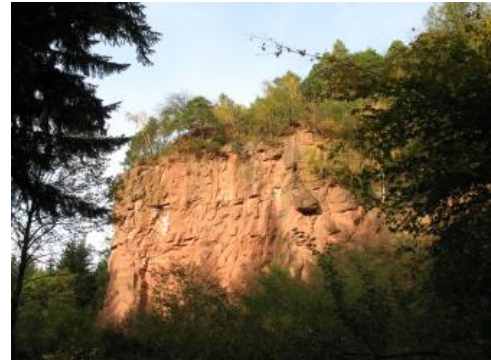
Buntsandstein bei Teningen-Heimbach

Der Buntsandstein zeigt in Baden-Württemberg von Nord nach Süd einen erheblichen Wechsel in seiner Ausbildung und wird daher regional unterschiedlich gegliedert.