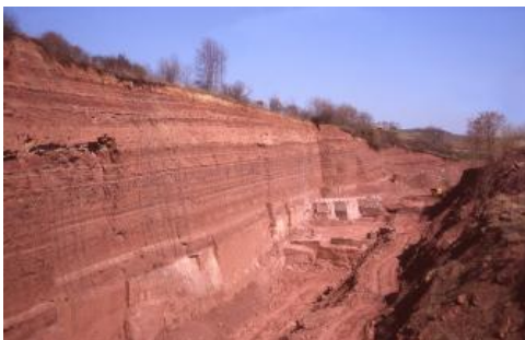
Steinbruch im Oberen Buntsandstein östlich von Wertheim-Dietenhan

Der Buntsandstein erreicht im Norden von Baden-Württemberg eine Mächtigkeit von 400 bis 500 m. Nach Süden und Südosten nimmt die Mächtigkeit allmählich auf weniger als 50 m im Südschwarzwald ab.