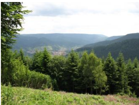
Murgtal bei Forbach

Der Buntsandstein streicht in der Umrandung von Schwarzwald und Odenwald an der Oberfläche aus und bildet die erste deutliche Schichtstufe über den mehr gerundeten Bergen des Grundgebirgs-Ausstriches. Besonders die Süd- und Ostabdachungen des Odenwalds und die Nord- und Ostabdachung des Schwarzwaldes sind von Buntsandstein-Stufenflächen (teilweise mit dünner Muschelkalk-Auflage) und tief darin eingeschnittenen Tälern geprägt. Er prägt das Landschaftsbild im badisch-fränkischen Abschnitt des Maintals und am unteren Neckar (ab etwa Neckargerach) ebenso wie die Täler von Enz und Nagold südlich von Pforzheim. An der Südabdachung des Schwarzwaldes bildet Buntsandstein teilweise die Höhen der Weitenauer Vorberge und einige kleinere Vorkommen im Hotzenwald. Auch in den Randschollen des Oberrheingrabens streicht mehrfach Buntsandstein aus, insbesondere in den Emmendinger Vorbergen.