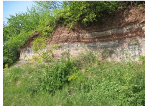
Beaumont-Horizont, Korber Kopf

Die Trias hat ihren Namen („Dreiheit“) aus der Verbindung von drei Formationsgruppen erhalten, in deren Mitte die Steinsalz-Lagerstätten des Mittleren Muschelkalks stehen: Im unteren Teil herrschen im Buntsandstein rotbraune und weiße Sandsteine sowie Geröllsandsteine vor, in die nur untergeordnet ebenfalls meist rotbraune Tonsteine eingeschaltet sind. Den mittleren Abschnitt bildet der Muschelkalk, der unten und oben vorwiegend aus Kalk- und Dolomitsteinen besteht und in dessen mittlerem Abschnitt mächtige Gips- oder Anhydritsteine und Steinsalz entwickelt sind. Den oberen Abschnitt der Trias bildet der Keuper mit einem buntfarbigem Wechsel aus Ton- und Sandstein, Gips- und Anhydritstein und nur untergeordneten Dolomit- und Kalksteinbänken oder -knollen.