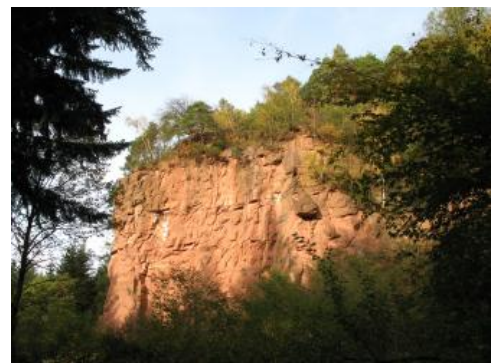
Buntsandstein bei Teningen-Heimbach

Das Alter der Ablagerungen der Germanischen Trias entspricht weitgehend dem Zeitabschnitt der Trias nach heutiger internationaler Gliederung. Diese international gültige Abgrenzung erfolgte jedoch an marinen Schichtfolgen, weshalb die genaue Lage der Grenze geringfügig von dem Fazieswechsel, an dem die lithostratigraphischen Einheiten unterschieden werden abweichen kann. Dies könnte bei der Untergrenze des Buntsandsteins der Fall sein, doch lässt sich die Gesteinsabfolge in diesem Abschnitt derzeit noch nicht genau genug datieren. Insgesamt kann aber der Untere und Mittlere Buntsandstein (bzw. die Vogesensandstein-Formation) als Ablagerung der Frühen Trias (Indusium und Olenekium) angesehen werden. Der Obere Buntsandstein, der gesamte Muschelkalk und der tiefere Teil des Keupers (bis zur Mittleren Grabfeld-Formation) entsprechen der Mittleren Trias der internationalen Einteilung (Anisium und Ladinium) und der übrige Keuper als Ablagerung der Späten Trias (Karnium, Norium und Rhätium). Die Grenze zwischen Trias und Jura fällt im Landesgebiet in eine Schichtlücke an der Grenze zwischen Keuper und Unterjura.