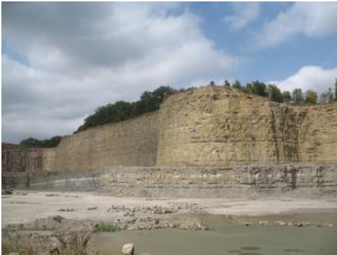
Oberer Muschelkalk, Crailsheim

Die Mächtigkeit beträgt bis über 1000 m in Nordwürttemberg, nimmt aber nach Nordwesten gegen den Odenwald auf unter 600 m, nach Süden zur oberen Donau und zum Hochrhein hin auf etwa 400 m ab.