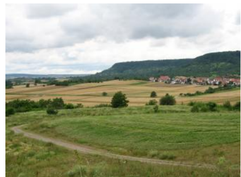
Die Keuperschichtstufe am Schönbuch bei Entringen

Ablagerungen der Trias streichen in Baden-Württemberg auf fast einem Drittel der Landesfläche zwischen Schwarzwald und Odenwald einerseits und den Jura-Ablagerungen des Albvorlands und der Schwäbischen Alb andererseits aus. Auch in einigen Randschollen des Oberrheingrabens und im Bruchfeld der Schopfheimer Bucht und des Dinkelberggebiets zwischen Schwarzwald und Hochrhein sind kleinere Ausstrichgebiete triassischer Gesteine vorhanden oder Triasablagerungen von nur geringmächtigen quartären Deckschichten verhüllt.