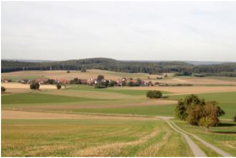
Blick vom nördlichen Anstieg des Bussens auf das Tertiärhügelland bei Unlingen-Dietelhofen

Die tertiären Einheiten sind im Land (LGRB, 2016c) räumlich sehr weit verbreitet, jedoch meistens von Sedimenten des Quartärs bedeckt. In größerer Mächtigkeit kommen sie in drei Hauptregionen vor.