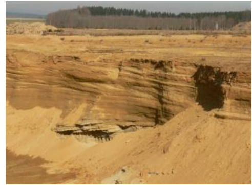
Abbauwand des Grobsandzugs mit Schrägschichtung

An Sedimentgesteinen überwiegen im Molassebecken festländische klastische Gesteine (Sandsteine, am Beckenrand auch Konglomerate) mit Glimmer, pedogen überprägte Schluffsteine und bunte Mergel. Limnische Mergel und Karbonate sowie Calcretes kommen untergeordnet vor. Dagegen sind marin gebildete Glaukonitsandsteine und sandige Mergel oder Tonmergel des jüngeren Molassemeeres weit verbreitet und sehr mächtig. Die Küstenfazies in Form von groben Schillkalksteinen oder grobkiesigen Rinnenfüllungen ist nur lokal erhalten. Gegliedert wird die Molasse in sechs Untergruppen: die Untere Meeremolasse, die Untere Brackwassermolasse (beide im Landesgebiet nur im tieferen Untergrund verbreitet), die Untere Süßwassermolasse , die Obere Meeremolasse , die Obere Brackwassermolasse und die Obere Süßwassermolasse .