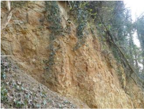
Buntmergel der Pechelbronn-Fm. von Lahr-Dinglingen

Je nach Lokalität sind die Mächtigkeiten der Tertiärsedimente sehr unterschiedlich: im Molassebecken sind es wenige Meter im Norden bis über 5000 Meter im Süden, im Oberrheingraben bis mehrere tausend Meter mit oft starken Unterschieden auf benachbarten tektonischen Schollen. Die ansonsten im Land verteilten lokalen Vorkommen tertiärer Einheiten bleiben in der Regel auf wenige Meter, in seltenen Fällen auf einige 10er Meter beschränkt (Maarsee-Ablagerungen, Höhenschotter). In den Meteoritenkratern überschreiten Impaktgesteine inklusive der Kraterseeablagerungen 100 m Mächtigkeit, wohingegen die Volumina der ausgeschleuderten Schollen sehr heterogen sind.