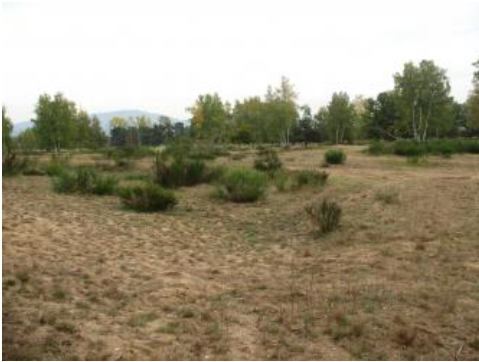
Flugsande bei Sandweiler

Während der Kaltzeiten des Quartärs gab es weite Flächen freiliegenden Gesteins, das besonders der Frostverwitterung ungeschützt ausgesetzt war. Außerdem wurde durch Eisbedeckung viel Gesteinsmaterial erodiert und bis zu kleinsten Korngrößen „zermahlen“. Kräftige Winde, die über die Eisflächen wehten, konnten das feine Gesteinszerreibsel ausblasen und als Löss und Flugsand in den nur wenig bewachsenen Periglazialgebieten wieder ablagern. So bildeten sich hauptsächlich in den Kaltzeiten gleichkörnige, meist homogene Ablagerungen. Besonders großräumig sind die Lössflächen im Oberrheingraben und im Schichtstufenland. Der Kraichgau ist fast flächendeckend bedeckt, und auch die Vorbergzone des Schwarzwalds sowie der Kaiserstuhl sind für ihre teilweise sehr mächtigen Löss-Sedimente bekannt.