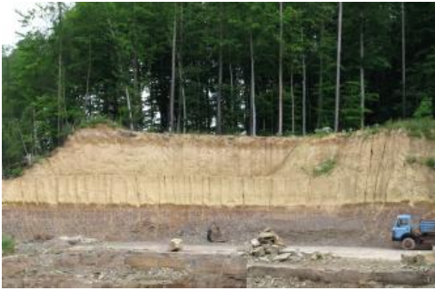
Löss auf Schilfsandstein bei Eppingen-Mühlbach

Windsedimente bestehen aus gut sortierten, glatten Einzelkörnern, die vom Wind verblasen wurden. Je nach vorherrschender Transportkraft werden unterschiedliche Korngrößen verlagert. Die einzelnen Körner stoßen aneinander und werden dabei randlich abgeschliffen. Vorwiegend handelt es sich um feinsten Gesteinsstaub. Die petrographische Zusammensetzung hängt vom Liefergebiet ab. Hauptbestandteil sind feinkörniger Quarz und Calcit (zusammen 50–90 %) mit Korngrößen von 0,01 bis 0,05 mm, hinzu kommen Feldspat, Dolomit und kalkige Gesteinsbruchstücke sowie geringe Gehalte an Glimmer, Tonmineralen und Schwermineralen, wie etwa Granat, Glaukophan und Picotit. Letztgenannte belegen, dass der Löss Baden-Württembergs größtenteils aus zerriebenen Gesteinen alpiner Herkunft