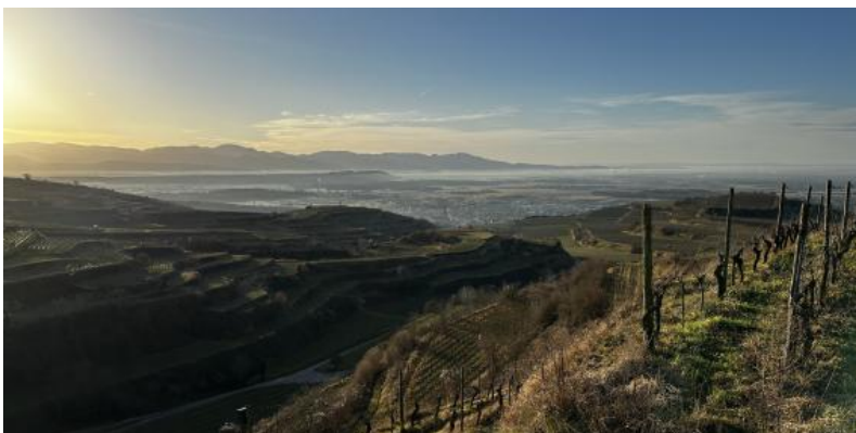
Blick vom Kaiserstuhl (Kreuzenbuck oberh. Ihringen) nach Süden über Rebterrassen zum Schwarzwald; vor den Höhen des Schwarzwaldes erhebt sich in der linken Bildhälfte der langgestreckte, flache Rücken des Tunibergs aus dem Nebel

Kaiserstuhl und Freiburger Bucht bilden landesweit eine der kleinsten Bodengroßlandschaften. Die Böden haben sich aus Gesteinen der Trias, des Juras und Tertiärs, aus Vulkangesteinen des Kaiserstuhls sowie quartären Lockergesteinen wie Löss, Fließerden oder Ablagerungen der Flüsse entwickelt. Der tektonisch bedingte, engräumige Wechsel der Geologie sorgt für unterschiedlichste Bodenausgangsgesteine und ein vielfältiges Bodenmuster. Die im Oberrheinischen Tiefland sonst vorherrschende landschaftliche Gliederung in Rheinaue, Niederterrasse und Vorbergzone wird durch den Kaiserstuhl und die Freiburger Bucht mit inselartig auftretenden Randschollen unterbrochen.