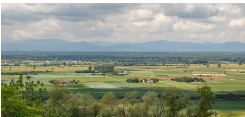
Blick vom Kahlenberg südlich von Ettenheim in das Mittlere Oberrheinische Tiefland, im Hintergrund die Vogesen

Aufgrund der geologischen Entstehung als Grabenbruch bildet die Landschaft am Oberrhein bezüglich Geologie, Oberflächenrelief, Klima und Landnutzung eine Einheit. Die Gliederung in Rheinniederung, Niederterrasse mit den Auen der Rheinzufüsse und den Vorbergen der östlichen Randgebirge lässt sich über weite Strecken des rechtsrheinischen, baden-württembergischen Teils des Oberrheingrabens verfolgen. Zusätzliche Elemente sind der vulkanische Kaiserstuhl und einzelne, inselartig in der Freiburger Bucht auftretende Randschollen aus mesozoischen und tertiären Gesteinen. Das weitgehend ebene Relief der Oberrheinebene ist im Zuge der quartären Verfüllung des Grabenbruches mit fluvialen Sedimenten des Rheins und seiner Zuflüsse entstanden. Die Lage zwischen den scharf abgesetzten Randhöhen macht die Oberrheinebene zu einem klimatischen Gunstraum mit den landesweit höchsten Temperaturen und geringen Niederschlägen.