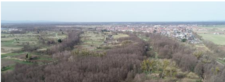
Verlandeter Altlauf des Rheins bei Linkenheim-Hochstetten mit Übergang zur würmzeitlichen Niederterrasse mit Bebauung in der Bildmitte rechts

Obwohl sich der Oberrheingraben über rund 300 km in N–S-Richtung erstreckt, ist er aufgrund seiner geologischen Entstehung bezüglich Geologie, Oberflächenrelief, Klima und Landnutzung ziemlich einheitlich aufgebaut. Das weitgehend ebene Relief ist im Zuge der quartärzeitlichen Füllung mit fluviatilen Sedimenten des Rheins und seiner Zuflüsse entstanden. Die tiefe Lage zwischen den scharf abgesetzten Randhöhen macht die Oberrheinebene zu einem klimatischen Gunstraum mit den landesweit höchsten Temperaturen und geringsten Niederschlägen.