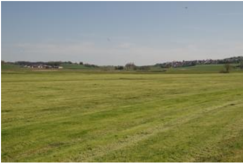
Nördlicher Teil des Federseerieds mit Blick auf Seekirch-Ödenahlen (links) und Ahlen

Auch das zentrale Federseebecken sticht mit seinen speziellen naturräumlichen Gegebenheiten und seiner Nutzungsgeschichte als Bildungsareal für die hier verbreiteten Böden heraus. Teils durch einen natürlichen Verlandungsprozess, teils durch die in historischer Zeit durchgeführten Absenkungen des Wasserspiegels und des Zurückdrängens seiner Seefläche gelangte der ehemalige Seeboden des eutrophen Flachsees großflächig an die Geländeoberfläche. Während in schon früh trockengefallenen Randbereichen und v. a. im Süden des Federseebeckens schon länger das Aufwachsen von Niedermoortorf möglich war und hier mittel und mäßig tiefe Niedermoore über Gytja lagern ( t111 ), wurde in der Kernzone des Federseebeckens erst in historischer Zeit die Seefläche durch die sog. „Seefällungen“ zurückgedrängt. Aufgrund der nur kurzen, für das