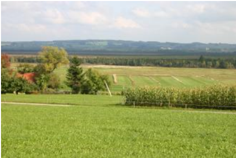
Blick über das Wurzacher Ried

Zu den übergreifenden, in den verschiedenen Teilgebieten der Altmoränenlandschaft auftretenden Kartiereinheiten zählen auch die Niedermoore. Kartiereinheit t112 (mittel tiefes bis tiefes Niedermoor aus Niedermoortorf, z. T. über Schwemm- und Seesedimenten) ist dabei meist auf kleinere Hohlformen beschränkt, während die tiefen Niedermoore ( t115 ) vorwiegend größere Senken- und ausgedehnte Beckenbereiche einnehmen. Unter letzteren ist v. a. das Moorgebiet des Wurzacher Rieds hervorzuheben, das neben dem Pfrunger Ried bei Ostrach und dem Federseeried bei Bad Buchau eines der großen Moorareale des Südwestdeutschen Alpenvorlands darstellt. In allen drei Fällen handelt es sich um ehem. Zungenbecken, also von den Eismassen aus dem Untergrund herausgearbeitete Becken. Diese