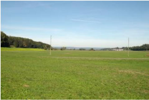
Das Schwarzwaldtal nördlich von Bad Saulgau

Vor allem in den breiteren Tälern und Talabschnitten hat die randliche Einschwemmung von jüngeren Sedimenten nicht ausgereicht, um größere Talbodenbereiche aufzufüllen und die weitverbreiteten mittel und mäßig tiefen Niedermoore ( t113 ) zu überdecken. Durch anthropogene Grundwasserabsenkung sind diese Moore oberflächennah meist vererdet und ihre Mächtigkeit dürfte vor den Drainagemaßnahmen und den in der Folge stattfindenden Mineralisierungs- und Sackungsvorgängen z. T. deutlich größer gewesen sein. Die Torfhorizonte überlagern verbreitet geringmächtige, sandige und lehmige Hochwasserabsätze auf würmzeitlichen Schmelzwasserkiesen. Ebenfalls durch früher sehr hohe Grundwasserstände wurde Kartiereinheit (KE) t105 mit Humus- und