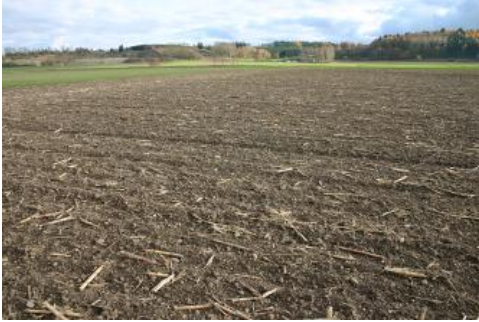
Im unteren Ablachtal bei Mengen (Lkr. Sigmaringen)

In den anderen Laufabschnitten des Ablachtals treten Niedermoore über würmzeitlichem Kies vereinzelt und meist kleinflächig auf. Stellenweise kommen im Randbereich des vermoorten Talbodens Humusgleye und Anmoorgleye vor ( t105 ), die unter geringfügig tiefer stehendem Grundwasser gebildet wurden. Bei den Anmoorgleyen ist nicht auszuschließen, dass ihr extrem humoser Oberboden durch Humusabbau infolge von Entwässerungsmaßnahmen aus mittel tiefen Niedermooren hervorgegangen ist. Vereinzelt, auf nur wenige Dezimeter höher gelegenen Terrassenresten sowie bei tieferem Grundwasserstand, kommen in den oberen Laufabschnitten Gleye und Humusgleye auf Schmelzwasserschottern vor ( t135 ). Wesentlich weiter verbreitet und durchaus charakteristisch für das Ablachtal sind die