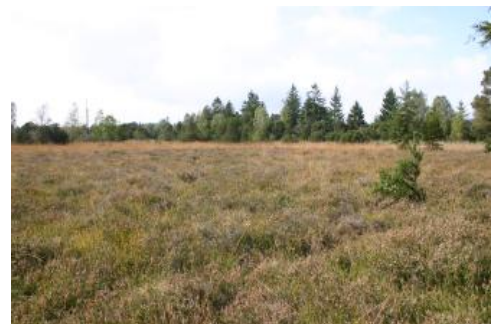
Riedheide im Wurzacher Ried (Ziegelbacher Ried)

Trotz des hohen Grundwasserstands nahe der Oberfläche sind die Niedermoorflächen im Bereich des Wurzacher Rieds typischerweise auf die Randzonen beschränkt. In den zentralen Bereichen setzte auf dem Niedermoorkörper, als dieser die Wasseroberfläche erreicht hatte, das Wachstum von Hochmoortorfen ein. Eine bedeutende Rolle für ihre Bildung spielten dabei die wasserspeichernden Sphagnum -Moose, die im Gebiet des Wurzacher Rieds mit seinem mäßig kalten, regenreichen Klima ideale Voraussetzungen für ihre Ausbreitung vorfanden. Im Ergebnis bildeten sich so in den zentralen Bereichen des Wurzacher Rieds ausgedehnte, z. T. deutlich gewölbte Hochmoorschilde ( t119 , tiefes Hochmoor aus Hochmoortorf).