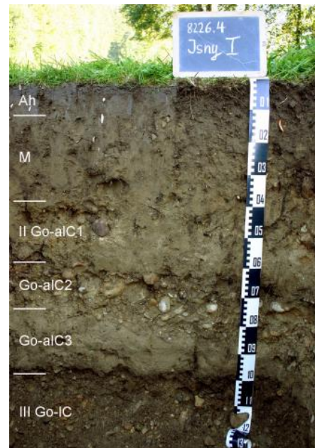
Brauner Auenboden aus Auensand über lehmig-sandigen Hochwasserablagerungen der Eschach

Die beiden Haupttäler der Adelegg unterscheiden sich deutlich. Das Tal der Kürnach, die das östliche, bayerische Gebiet der Adelegg entwässert und erst im Unterlauf das baden-württembergische Gebiet im Westen erreicht, weist gemäßigte, relativ ausgeglichene Gefällsverhältnisse auf. Dagegen zeichnet sich das Tal der Eschach durch ein hohes Fließgefälle aus. Die Bodenverhältnisse im Talboden der Eschach korrespondieren mit ihrem Wildbachcharakter und werden von Auenpararendzinen aus kiesführenden sandig-schluffigen Hochwasserabsätzen über Flusskiesen dominiert ( s215 ), die teilweise durch Braune Auenböden aus relativ geringmächtigem Auensand mit einem nur geringen Bodensedimentgehalt aus bräunlichem, leicht humosem Material ergänzt werden.