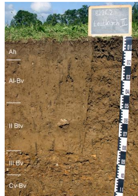
Tief entwickelte lessivierte Braunerde aus spätglazialer Fließerde über würmzeitlichem Hochflutlehm und Schotter der Eschach

Auf den mit Hochflutsedimenten überschütteten Bereichen ist dagegen KE s38 verbreitet. Lessivierte Braunerden, Parabraunerde-Braunerden sowie örtlich Braunerde-Parabraunerden sind auf stellenweise schwach kieshaltigen feinkörnigen Substraten entwickelt, die ab 8 bis über 10 dm u. Fl. den unterlagernden, im oberflächennahen Bereich entkalkten sandig-lehmigen Kiesen aufsitzen. Am Übergang zur Talwasserscheide zwischen Eschach und Unterer Argen werden auf dem eben auslaufenden abzugsträgen Schwemmfächer die Bodenwasserverhältnisse einerseits zunehmend durch Stauwasser bestimmt und gelangen andererseits unter Grundwassereinfluss ( s50 , Gley-Pseudogley aus Hochflutlehm).