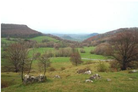
Die kesselförmige Einsenkung des Randecker Maars bei Bissingen-Ochsenwang

Das Besondere im Bereich der Vulkanschote der Mittleren Alb ist das Vorkommen von wechselfeuchten Böden, die auf der umgebenden, verkarsteten Albhochfläche fehlen. Die geringe Wasserdurchlässigkeit des Vulkantuffzersatzes und der daraus gebildeten Fließerden führt in den flachen Senken zu zeitweiliger Staunässe und Luftmangel in den überlagernden Deckschichten ( q43 ). Auch auf den tonigen Seesedimenten des Randecker Maars finden sich Kolluvien mit schwach ausgeprägten Staunässemerkmalen ( q62 ). Im Schopflocher Moor führte die Vernässung bis zur Torfbildung ( q82 ) und im Randbereich des Moors zu extremen Stauwasserböden (Stagnogleye q45 ) und Gleyen ( q76 ). Die Bodeneigenschaften außerhalb der vernässten Senken wechseln stark und hängen vom Steingehalt bzw. dem Ausmaß der Beimengung von Kalksteinschutt und von der