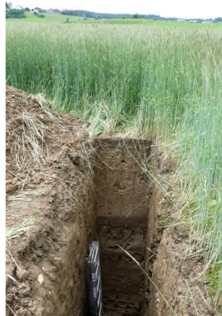
Über 3 m mächtiges Kolluvium (q53) am tiefsten, zentralen Punkt einer großen Karstsenke südöstlich von Königsheim (Lkr. Tuttlingen)