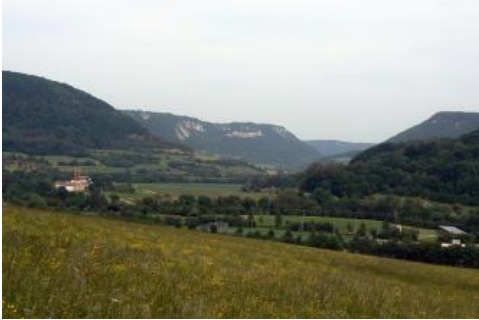
Blick nach Osten in das Filstal zwischen Deggingen und Bad Überkingen

An den weniger stark geneigten unteren Hangabschnitten am Albtrauf, wo sehr viel tonig-mergeliges Substrat am Aufbau der Böden beteiligt ist ( q21 , Pararendzina und Rendzina), ist die Wasserversorgung für die Waldbäume günstiger. Die nFK liegt in der Stufe gering bis mittel. Allerdings sind die tonigen Unterböden stellenweise nur mäßig durchwurzelbar. Dies gilt besonders auch für die Pararendzinen und Pelosole im Bereich junger Rutschungshänge ( q27 ). Ein ausgeprägtes Kleinrelief mit entsprechend engräumigem Bodenwechsel und dem Vorkommen von Pseudogleyen und Hanggleyen sowie die anhaltend bestehende Rutschungsneigung machen in diesen Bereichen nur eine waldbauliche Nutzung möglich.