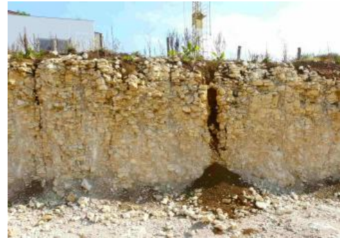
Lehmverfüllte Karstspalten in einer Baugrube bei Grabenstetten

Die Standorteigenschaften der Böden auf der verkarsteten Alb hängen in erster Linie von ihrem Wasserspeichervermögen und damit v. a. von ihrer Gründigkeit ab. Diese kann allerdings kleinräumig sehr stark wechseln. So können Baumwurzeln über einer Karstspalte metertief eindringen, während das Gestein daneben bis nahe an die Oberfläche reicht und nur eine flache Durchwurzelung erlaubt. Besonders auf Bankkalken kann sich über dem Gestein pleistozäner Frostschutt gebildet haben, der schluffig-toniges Verwitterungsmaterial aus Mergelzwischenlagen enthält und damit deutlich mehr Wasser speichern kann als ein flachgründiger Standort auf kaum verwittertem Massenkalk. Eine deutliche Verbesserung der Eigenschaften ist dort gegeben, wo eine Überdeckung mit lösslehmhaltigen Deckschichten vorliegt.