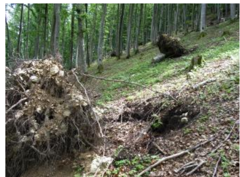
Steilhang im Schmiechatal bei Albstadt-Ebingen mit Rendzinen aus Kalkstein-Hangschutt (q11)

An den steilen Trauf- und Talhängen entscheidet die Mächtigkeit der Schuttdecken und v. a. deren Gehalt an mineralischem Feinmaterial sowie an organischer Substanz über das Wasserspeichervermögen und damit über die Leistungsfähigkeit der meist forstlich genutzten Standorte. Bei den Rendzinen aus Kalksteinschutt an den Hängen ( q7 , q8 , q11 ) ist die nFK meist als gering einzustufen. Aus der abgestorbenen organischen Substanz bildet sich bei ständiger Kalknachlieferung ein schwarzer Ah-Horizont mit einem lockeren Bodengefüge aus stabilen Krümeln mit einem reichen Bodenleben und einem hohen Nährstoffumsatz. Die Mullrendzinen aus Kalksteinschutt können aufgrund ihres günstigen Gefüges mehr pflanzenverfügbares Wasser speichern als vergleichbare flachgründige Böden aus anderen Ausgangsgesteinen. Das hohe Stickstoffangebot wird durch eine artenreiche Bodenflora angezeigt. Wo die Schuttdecken zur Ruhe gekommen sind, ist der Ah-Horizont oberhalb 1–3 dm u. Fl. oft karbonatfrei. In den feinscherbigen Schuttdecken („Bergkies“) ist der Wurzelraum stellenweise durch verfestigte Kalkausfällungen unter dem Ah-Horizont eingeschränkt.