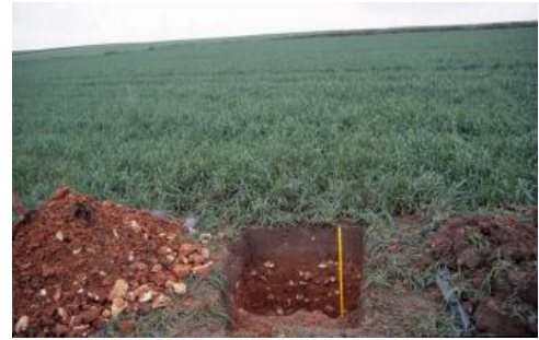
Terra rossa an einem schwach geneigten Hang im Verbreitungsgebiet von Tertiärsedimenten bei Winterlingen-Harthausen (q42)

Vorherrschende Böden im Bereich der tertiären Albüberdeckung in der BGL Mittlere und Westliche Alb sind Pararendzinen und Rendzinen aus Jüngerer Juranagelfluh ( q25 ). Ihre Eigenschaften hängen entscheidend vom Geröllanteil des Ausgangsmaterials ab. Wo dieser nicht sehr hoch ist, handelt es sich um tiefgründige, gut durchwurzelbare, bereits an der Bodenoberfläche kalkhaltige Böden mit mittlerer nFK und hoher KAK (Pararendzinen). Die kies- und geröllreichen Rendzinen sind entsprechend schlechter einzustufen. In den Muldentälchen sind neben tiefgründigen, schwach kiesführenden Kolluvien ( q49 ), deren Eigenschaften denen im Oberjuragebiet ähneln, örtlich auch Gley-Kolluvien ( q63 ) und Gleye ( q77 ) mit deutlichem Grundwassereinfluss verbreitet. Die Terrae fuscae und Terrae rossae, die aus einem Gemisch von Oberjura- und Tertiärverwitterungsmaterial bestehen ( q42 ), sind in ihren Eigenschaften mit den Terrae fuscae des Oberjuragebietes vergleichbar. Ihre Eigenschaften sind stark von der schwankenden Entwicklungstiefe und dem Steingehalt abhängig. Wo am Ausgangsmaterial viel Mergel beteiligt ist, verlief die Bodenentwicklung eher zu Pelosolen, die eine vergleichsweise geringere Wasserdurchlässigkeit besitzen.