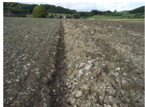
Steinige „Ackerrendzinen“ mit grauem, mergeligem Feinmaterial und Mergelkalksteinen im Verbreitungsgebiet der Zementmergel-Formation bei Münsingen (q22)

Auf den kalkreichen Mergelsteinen der Zementmergel-Formation sind i. d. R. keine plastischen Tonböden verbreitet, sondern nur flach entwickelte Pararendzinen und Rendzinen (q22). Eine deutliche Gefügebildung und Übergänge zum Pelosol sind nur vereinzelt festzustellen. Die Böden mit steinigem, schluffig-tonigem Substrat sind schon an der Oberfläche kalkhaltig und meist flach bis mäßig tiefgründig. Sie weisen eine nur sehr geringe bis geringe nFK und eine geringe bis mittlere KAK auf. Etwas günstigere Eigenschaften haben die Pararendzinen in dem stärker verwitterten, weniger kalkreichen Material der Lacunosamergel-Formation. Dort treten in hängigen Lagen oft auch tiefgründigere Pararendzinen auf (q23), die sich in tonreichen Fließerden entwickelt haben. Sie besitzen eine geringe bis mittlere nFK und eine mittlere bis hohe KAK. Nur an wenigen Stellen, besonders im Ausstrichbereich der Lacunosamergel-Formation, wurden flach bis mäßig tief entwickelte Pelosole auskartiert (q28). Sie besitzen einen dichten, schwer durchwurzelbaren Unterboden und stellenweise schwach ausgeprägte Staunässemerkmale. Auf der Westalb treten lokal tief humose Pelosole mit schwarz gefärbten P-Horizonten auf.