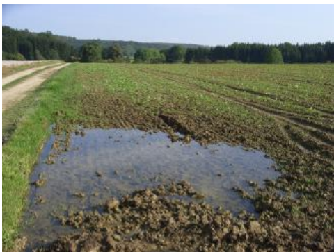
Staanasse Böden auf Glazialablagerungen bei Sigmaringen

Auch die Böden im Bereich der Glazialüberdeckung nördlich und östlich von Sigmaringen gehören hinsichtlich ihrer Bodeneigenschaften mehrheitlich zu den besseren Böden der Albhochfläche, was v. a. daran liegt, dass die Glazialsedimente meist noch von lösslehmreichen Deckschichten überlagert werden. Es handelt sich um tiefgründige, oft nur schwach kiesige Lehm Böden mit günstigem Wasser- und Lufthaushalt und mittlerer bis sehr hoher KAK (Parabraunerde q37 , q38 ). Wo die Gletscherablagerungen viel aufgearbeiteten Mergelverwitterungston enthalten, treten Böden mit tonreichen, schwer durchwurzelbaren Unterbodenhorizonten hinzu ( q39 ). Kleinflächig sind zu Staunässe neigende Böden ausgebildet ( q37 , q39 , q44 ). Auch in den Muldentälchen dominieren tiefgründige Böden mit ausgeglichenem Wasser- und Lufthaushalt (Kolluvium, q60 ). Bei Langenenslingen gibt es mehrere Hohlformen, in denen die Bodeneigenschaften deutlich