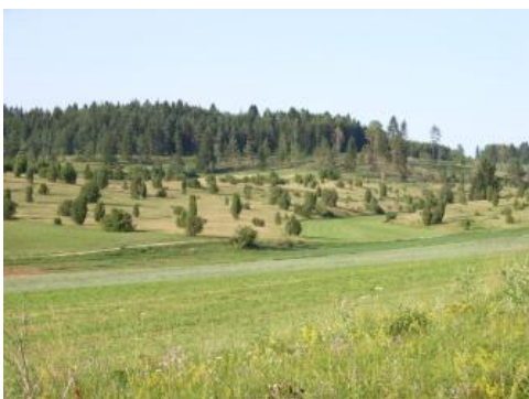
Wacholderheiden auf der Albhochfläche im Digelfeld bei Hayingen

Ehemals als Schafweide genutzte flach entwickelte Mergelböden (q22) sind bei Wiederaufforstungen schwierige Waldstandorte (Müller, 1962). Moder-Humusformen und wenig entwickelte Ah-Horizonte weisen auf ein gestörtes Bodenleben in diesen Bereichen hin. Ähnliches gilt für die sandigen Dolomit-Rendzinen (begleitend in q5 und q14). Auch über deren lockerem, basenreichen Substrat findet sich gelegentlich ein Auflage-Moder mit säureliebenden Moosen. Die mangelnde Stickstoff- und Wasserversorgung schränkt das Pflanzenwachstum auf diesen Standorten sehr stark ein. (Müller, 1962; Müller, S. in Jentsch & Franz, 1999).