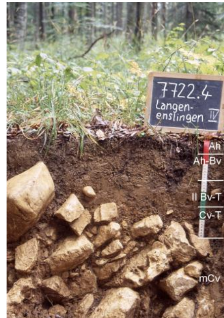
Mittel tief entwickelte Braunerde-Terra fusca, aus lösslehmreicher Fließerde über verwittertem Kalkstein des Oberjuras (Oberer Massenkalk) auf der Flächenalb nördlich von Langenenslingen (q40)

Mächtiger wird die Bodendecke dort, wo über dem Rückstandston noch lösslehmreiche Fließerden oder geringmächtiger Lösslehm lagern. Häufig ist dies auf Verebnungen, in Karsthohlformen und an ostexponierten Hängen der Fall. Als verbreitetste Bodentypen treten dort Terra fusca-Parabraunerden und Parabraunerden auf ( q34 , q35 , q36 ). Es handelt sich überwiegend um tiefgründige, zumindest im oberen Profilabschnitt steinfreie bis steinarmlen Lehm Böden mit günstigem Wasser-, Luft- und Nährstoffhaushalt. Die nFK ist überwiegend als mittel bis hoch und die KAK als hoch einzustufen. Die schluffreichen Oberböden (Ap-/Al-Horizonte) sind stark erosionsgefährdet, neigen zu Verschlammung und Verkrustung und sind verdichtungsempfindlich. Unter landwirtschaftlicher Nutzung sind die Al-Horizonte meist stark verkürzt bzw. im Ap-Horizont aufgearbeitet oder vollständig abgetragen.