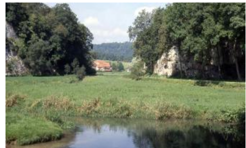
Grundwasserbeeinflusste Auenböden (q68) in der Talsohle der Großen Lauter

In den gewässerführenden Tälern der Alb ist der Karstwasserspiegel angeschnitten. Verbreitet treten mäßig grundwasserbeeinflusste Auenböden aus tiefgründigem, örtlich mäßig tiefgründigem kalkreichem Auenlehm auf, die überwiegend als Grünland genutzt werden ( q68 ). In Talabschnitten mit tief liegendem Grundwasser wird z. T. auch Ackerbau betrieben ( q64 , q66 ). Bis in die 60er Jahre des 20. Jh. gab es in vielen Albtälern noch Grabensysteme zur Wiesenbewässerung. Durch Wasserzufuhr in Trockenzeiten und Nährstoffzufuhr sollte so der Grünlandertrag gesteigert werden. In den Talabschnitten mit Feuchtwiesen, Nasswiesen und Hochstaudenfluren dominieren bei andauernd hoch stehendem Grundwasser kalkhaltige Auengleye. Begleitend können auch kalkhaltige Anmoorgleye auftreten ( q71 ). Wo an den Auensedimenten viel verschwemmtes Kalktuffmaterial beteiligt ist, treten neben lehmigen auch sandige Bodenarten auf. Örtlich wird das Auensediment auch direkt von lockerem oder festem Kalktuff (Sinterkalk) unterlagert. Dies ist besonders bei den in den Kartiereinheiten q65 und q67 abgegrenzten Auenböden der Fall. Die Böden sind in diesen Bereichen sehr kalkreich und haben eine hohe Wasserdurchlässigkeit.