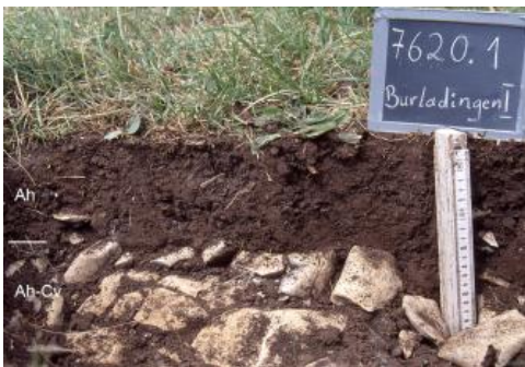
Sehr flach entwickelte Rendzina aus Kalkstein der Wohlgeschichtete-Kalke-Formation (q6)

Auf der von Karbonatgesteinen des Oberjuras gebildeten Albhochfläche werden in der Bodengroßlandschaft (BGL) Mittlere und Westliche Alb über 63 % der Fläche von Kartiereinheiten eingenommen, in denen Rendzinen die Leitbodentypen darstellen. Der Begriff Rendzina („Kratzer“) stammt aus dem polnischen und beschreibt lautmalend das Geräusch, das der Pflug beim Kratzen über den Gesteinsuntergrund erzeugt. Dasselbe drücken die auf der Alb nicht seltenen Flurnamen „Scherre“ oder „Rauscher“ aus. Die dunklen, humosen Ah-Horizonte der Rendzinen erwärmen sich im Frühjahr schnell und haben einen hohen Stoffumsatz. Die Böden sind oft bis an die Oberfläche kalkhaltig bzw. durch landwirtschaftliche Bearbeitung sekundär aufgekalkt. Bei den typischen Rendzinen ( q5 , q6 ) handelt es sich um flach- bis mittelgründige, steinige Böden, bei denen bereits oberhalb 3 dm u. Fl. das Festgestein oder ein sehr stark steiniger Unterboden auftritt. Es