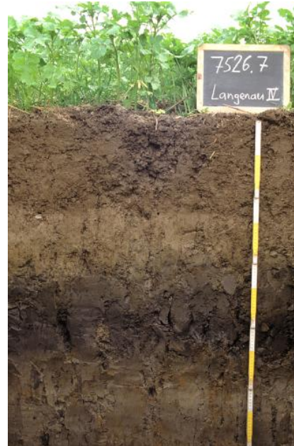
Brauner Aueboden-Auenpseudogley im westlichen Abschnitt des Langenauer Rieds (p156)

Die rezente Donauaue bildet einen ca. 1–2 km breiten Streifen entlang der Donau mit oftmals engräumigem, kuppig-welligem Kleinrelief, der fast ausschließlich in Bayern liegt. Nur westlich des Donaurieds ist zwischen dem Steilabfall der Alb bei Ulm-Böfingen und dem Flusslauf der Donau ein schmaler, junger Auenabschnitt innerhalb der Landesfläche ausgebildet ( p147 , kalkreicher Brauner Auenboden).