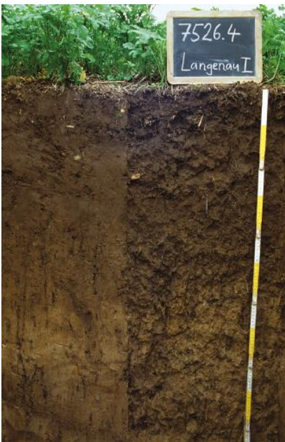
Tschernosem-Parabraunerde aus Löss auf der Hochterrasse bei Langenau (p51)

Auf die Langenauer Hochterrasse folgt in nordöstlicher Richtung in nur wenigen Kilometern Entfernung die sog. Sontheimer Hochterrasse. In einem schmalen Hangfußbereich am Rand zur Schwäbischen Alb bei Sontheim finden sich hier Tschernosem-Parabraunerden aus Löss ( p142 ). Die weitläufige, max. 3 km breite Terrassenverebnung wird hingegen großflächig von Parabraunerde-Tschernosemen eingenommen ( p139 ) und stellt mit dem Auftreten dieses Subtyps des Tschernosems eine bodengeographische Besonderheit innerhalb Südwestdeutschlands dar.