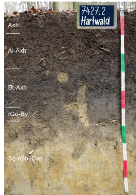
Parabraunerde-Tschernosem aus Schwemm- und Hochflutlöss (p139)

Die dominierenden, humosen Tschernosem-Merkmale der heutigen Böden auf der Sontheimer Hochterrasse sind auf ihre Feuchtboden-Vergangenheit zurückzuführen, für welche die frühere Verbreitung von Anmoorgleyen und flacheren Niedermooren anzunehmen ist. Im Zuge der Einschneidung der Donau in den Terrassenkörper sank der Grundwasserspiegel im Bereich der Sontheimer Hochterrasse sukzessive ab, wodurch eine terrestrische Bodenentwicklung einsetzte, die primär durch das versickernde Niederschlagswasser gesteuert wurde.