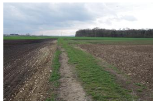
Stufe der Sontheimer Hochterrasse am Rand zur Feuchtniederung des Donaurieds

Ungefähr 2 km vom östlichen Stadtrand von Langenau entfernt befindet sich das Gewann „Untere Krautländer“, ein kleiner inselartiger Niederterrassenrest in dessen Bereich das Solummaterial von Parabraunerde-Tschernosemen durch garten- und ackerbauliche Bearbeitung mit dem liegenden Schwemmlöss vermengt wurde. Die ehemaligen Parabraunerde-Tschernoseme wurden so zu bodenbiologisch sehr aktiven kalkhaltigen Hortisol-Tschernosemen ( p140 ) umgeformt. Gleiches gilt für einen anderen, 2 km östlich davon gelegenen kleinen Terrassenrest. Durch Bodenerosion ausgelöste Verkürzung der Parabraunerde-Tschernosem Profile, gepaart mit Durchmischungsvorgängen durch Beackerung und damit bewirkter mechanischer Aufkalkung des Bodenkörpers, führte zur Ausbildung von Pararendzinen und kalkhaltigen Tschernosemen ( p138 ). Besonders auffällig ist hier die vorwiegend aus kalkhaltigen Tschernosemen bestehende Fläche, die sich weit ausgedehnt am Fuß des Ramminger Bergs erstreckt.