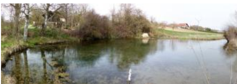
Karstquelle der Nau mit ihrem Quelltopf bei Langenau

Die ungeschützten Bodenoberflächen der Äcker im Randbereich der Schwäbischen Alb waren der Lieferbereich für Solummaterial, das im Zuge der Bodenerosion abgespült und z.T. bis in den Randbereich des Donaurieds verschwemmt wurde. Kolluvien aus jungen, meist max. 10 dm mächtigen Abschwemmmassen ( p174, p175 ) überlagern dabei ursprüngliche Feuchtböden (Gleye und Humusgleye), die heute als reliktsch einzustufen sind.