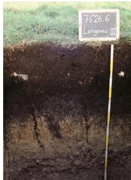
Reliktisches mittel tiefes, kalkhaltiges Niedermoor im westlichen Teil des Langenauer Rieds (p159)

Die Niedermoorflächen gliedern sich in die Kartiereinheiten p160 und p181. Für weite Bereiche, die von häufig vererdeten Niedermooren eingenommen werden ( p160 , kalkreiches vererdetes Niedermoor), sind bis mehrere Dezimeter mächtige Abschnitte aus eingeschaltetem weißlichem Wiesenalk charakteristisch. In größerer Entfernung zum Talrand setzt der Wiesenalk im Torfkörper weitgehend aus ( p181 , tiefes Niedermoor) und die Vererdung des Niedermoores beschränkt sich meist auf die obersten 3–5 dm. Im Donauried dominieren westlich der Nau ehemalige Grundwasserböden aus Hochwassersedimenten über sandig-kiesigen Donauablagerungen. Sie zeichnen sich häufig durch sehr stark (h5) bis extrem humose Oberböden (h6) aus ( p157, p158, p159 ). Es ist zu vermuten, dass diese Böden infolge anthropogener Grundwasserabsenkung durch Mineralisierung und Humusabbau verbreitet aus ursprünglich ausgebildeten Anmoor- und Niedermoorhorizonten hervorgegangen sind.