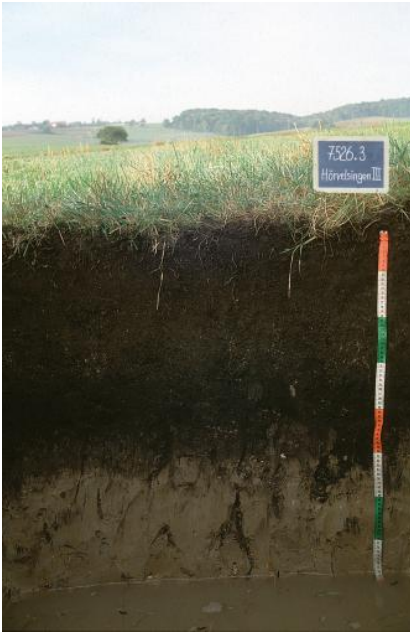
Vererdetes mittel tiefes Niedermoor im Tiefenbereich der Zementmergelschüssel bei Langenau-Hörvelsingen (p8)

Durch Drainage- und Entwässerungsmaßnahmen und den damit einhergehenden Setzungs- und Mineralisierungsvorgängen wurde der Moorkörper jedoch stark verändert und unterschreitet heute als vererdetes kalkreiches Niedermoor ( p8 ) den für Moorbildungen obligatorischen Mindestgehalt der organischen Substanz von 30 Gew.-% teilweise deutlich.