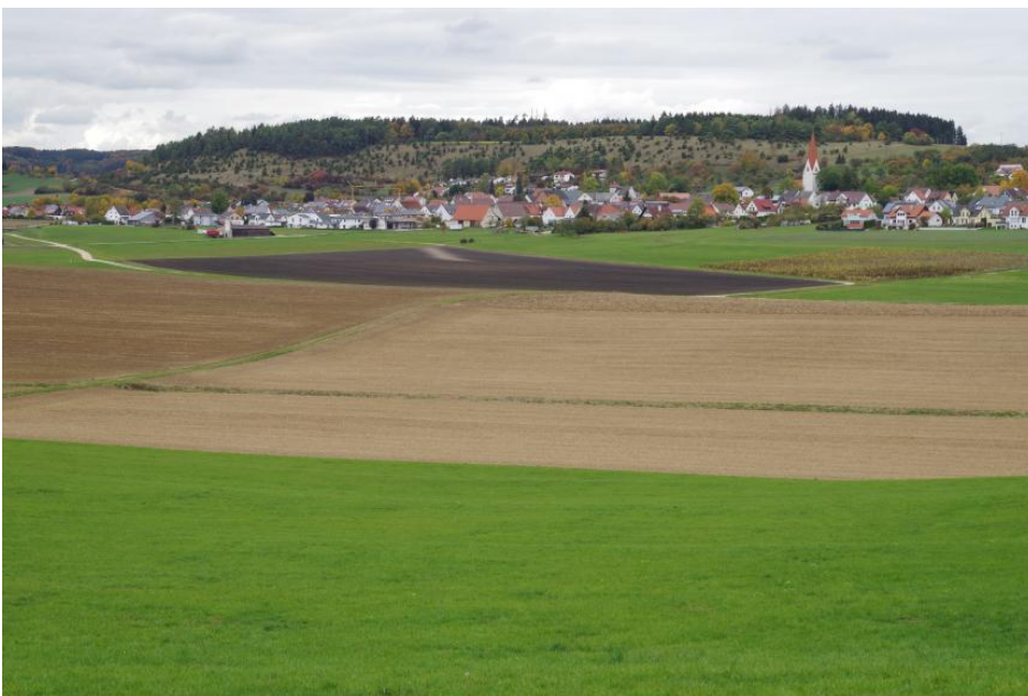
Zementmergel-Schüssel von Langenau-Hörvelsingen mit ehemaligem Niedermoor im zentralen Tiefenbereich (p8); im Hintergrund die Erhebung des „Ofenlochs“ aus Schichten der Mergelstetten-Formation des Oberjuras

Eine Besonderheit im Bereich der Ulmer Alb ist die erosive Ausraumform der Zementmergelschüssel bei Langenau-Hörvelsingen mit ihrem grundwassererfüllten Tiefenbereich. Aufgrund des ursprünglich bis an die Geländeoberfläche reichenden Grundwasserspiegels kam es im zentralen Teil zur Bildung eines Niedermoores.