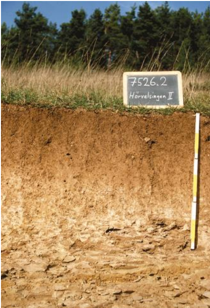
Pararendzina aus Kalkmergelstein der Mergelstetten-Formation (p161) bei Langenau-Hörvelsingen

Pararendzinen aus anstehendem Mergelstein ( p161 ) treten örtlich nur begrenzt auf und sind ausschließlich am Südhang des Ofenlochs bei Langenau-Hörvelsingen sowie am Abhang des unmittelbar westlich folgenden Ägenbergs lokalisiert. Nur stellenweise haben sich im Verbreitungsgebiet der pelitischen Gesteine der Mergelstetten-Formation die tonigen Unterböden von typischen Pelosolen und Braunerde-Pelosolen ( p39 ) kleinflächig erhalten. Sie stellen Rudimente der ursprünglich weit verbreiteten Pelosole dar, die im Zuge langanhaltender Ackernutzung sukzessive abgetragen und schließlich durch Pararendzinen als Erosionsformen ersetzt wurden.