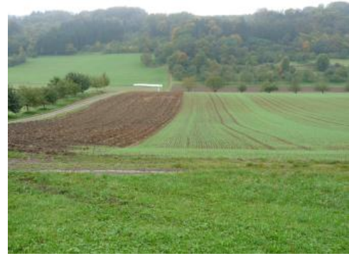
Jagsttal mit pleistozäner Flussterrasse südlich von Muldingen

Im Osten der Hohenloher-Haller-Ebene treten im stark mäandrierenden Abschnitt des Jagsttals aufgrund der vorherrschenden Morphodynamik und der nur geringmächtigen Lösslehmvorkommen spezifische Bodenverbreitungsmuster auf. Hierzu tragen als weitere Besonderheit auch die „Kirchberger Sande“ bei. Diese stratigraphisch der Hochterrasse zugeordneten, bis zu 3 m mächtigen Sedimente nehmen rund um Kirchberg größere Flächen auch außerhalb des Jagsttals ein (Simon, 2012a). Es besteht die Möglichkeit, dass es sich um Talverfüllungssedimente handelt (Simon, 2008a; Simon, 2008b). Gefundene Säugetierreste weisen auf ein Eem-zeitliches Alter, möglicherweise auch älter, hin. Ihre Erhaltung ist auf die tektonische Tieflage im Zentralbereich der Fränkischen Furche zurückzuführen.