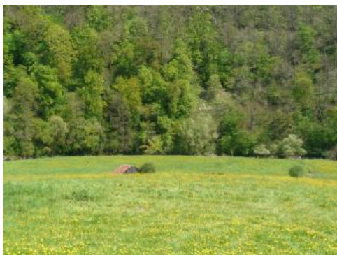
Pleistozäne Flussterrasse der Bühler bei Sulzdorf-Hohenstadt

Allgemein kann die Verteilung von pleistozänen Flussterrassensedimenten entlang von Kocher und Jagst in drei Abschnitte gegliedert werden: Während in einem zentralen Bereich zwischen Langenburg und Krautheim an der Jagst sowie zwischen Schwäbisch Hall und Sindringen-Ernstbach am Kocher nur wenige Terrassensedimente vorkommen, treten diese hauptsächlich jeweils in den westlichen und östlichen Talabschnitten auf. Dies lässt sich mit der allgemeinen geologisch-geomorphologischen Situation erklären (vgl. Kap. Geologisch-geomorphologischer Überblick). In den sehr schlingenreichen Talabschnitten im Oberen Muschelkalk haben sich im Bereich von Gleithängen und alten Talschlingen pleistozäne Terrassensedimente gut erhalten, wogegen in den vergleichsweise gestreckten und breiteren Talverläufen (Unterer und Mittlerer Muschelkalk) diese weitgehend abgetragen bzw. umgelagert worden