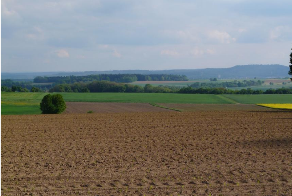
Blick von der flachwelligen Hohenloher Ebene südlich von Wolpertshausen nach Süden zu den Limpurger Bergen

In den talrandnahen und etwas geneigteren Bereichen, wo der Lösslehm und die lösslehmreichen Fließerden nicht oder weniger stark von Staunässe überprägt wurden, hat er seine ursprüngliche Farbe behalten und wird vom Landwirt als „ Braunes Feld “ bezeichnet (Parabraunerde, Pseudogley-Parabraunerde). Hierzu zählen allerdings auch die oben beschriebenen Zweischicht-Böden (Deck- über Basislage) im Lettenkeuper (Pelosol-Braunerden, Pelosol-Parabraunerden), ebenso wie nicht vernässte Böden der Talmulden (Kolluviole) und lehmige Böden im Muschelkalkgebiet (Parabraunerde, Terra fusca). Die Böden des „Braunen Felds“, die in der Landschaft den größten Flächenanteil einnehmen, gehören zu den besten Ackerstandorten des Gebiets. Es sei denn, es handelt sich um steinige, trockene Muschelkalkböden oder basenarme, steinige und sandige Böden aus Lettenkeupersandstein.