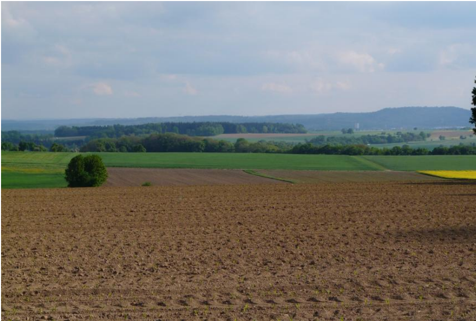
Blick von der flachwelligen Hohenloher Ebene südlich von Wolpertshausen nach Süden zu den Limpurger Bergen

In den talrandnahen und etwas geneigteren Bereichen, wo der Lösslehm und die lösslehmreichen Fließerdren nicht oder weniger stark von Staunässe überprägt wurden, hat er seine ursprüngliche Farbe behalten und wird vom Landwirt als „ Braunes Feld “ bezeichnet (Parabraunerde, Pseudogley-Parabraunerde). Hierzu zählen allerdings auch die oben beschriebenen Zweischicht-Böden (Deck- über Basislage) im Lettenkeuper (Pelosol-Braunerden, Pelosol-Parabraunerden), ebenso wie nicht vernässte Böden der Talmulden (Kolluvisole) und lehmige Böden im Muschelkalkgebiet (Parabraunerde, Terra fusca). Die Böden des „Braunen Felds“, die in der Landschaft den größten Flächenanteil einnehmen, gehören zu den besten Ackerstandorten des Gebiets. Es sei denn, es handelt sich um steinige, trockene Muschelkalkböden oder basenarme, steinige und sandige Böden aus Lettenkeupersandstein.