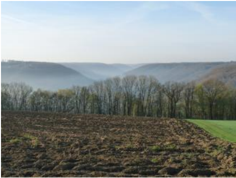
Hohenloher Ebene mit Kochertal bei Künzelsau-Kocherstetten im Hintergrund

Häufigstes Ausgangsmaterial für die Bodenbildung ist der Verwitterungston von Ton- und Mergelsteinen bzw. tonreiche Fließerden (Basislagen) mit wechselnden Sandanteilen. Auf ihnen entwickelten sich schwer zu bearbeitende Tonböden ( J18 ). Diese Böden werden von den Hohenloher Bauern aufgrund der oft dunklen Tongesteine und des unter Grünland häufig auftretenden schwärzlichen humosen Oberbodens seit jeher als „ Schwarzes Feld “ bezeichnet. Die schwer durchwurzelbaren und dicht gelagerten Böden sind nur bei einem bestimmten Durchfeuchtungsgrad gut zu bearbeiten, weshalb sie auch als „Minutenböden“ bezeichnet werden. Entsprechend problematisch sind sie für die land- und forstwirtschaftliche Nutzung. Häufig ist noch eine 1–3 dm mächtige schluffig-lehmige Deckschicht vorhanden (Decklage, entspr. Hauptlage in Ad-hoc-AG Boden, 2005, S. 180 f.), in der ein Bv-Horizont entwickelt ist (Braunerde