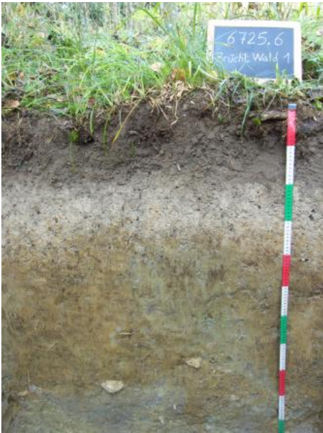
Braunerde-Pelosol-Pseudogley aus geringmächtigen lösslehmreichen Fließberden über Ton-Fließberde aus Lettenkeupermaterial