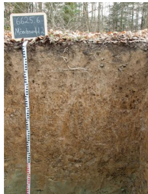
Parabraunerde-Pseudogley aus lösslehmreichen Fließerden über toniger Basislage aus Lettenkeupermaterial