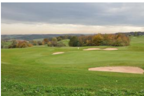
Veränderte und künstliche Böden im Bereich eines Golfplatzgeländes bei Ravenstein-Merchingen

Mit den Kartiereinheiten i105 und i106 wurden wenige kleinflächige Vorkommen von Auftragsböden abgegrenzt. Es handelt sich um meist land- oder forstwirtschaftlich genutzte Auffüllungsflächen. Teilweise wurde Boden- und Gesteinsmaterial aus der Muschelkalk- und Lettenkeuperlandschaft oder aus benachbarten Bodengroßlandschaften aufgetragen ( i105 ). An wenigen Stellen bei Grünsfeld-Krensheim handelt es sich eher um aufgebrachttes Löss- und Lösslehmmaterial ( i106 ).