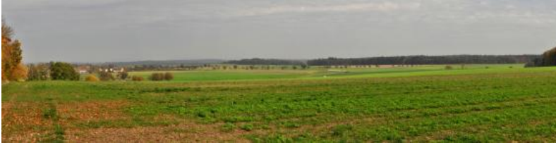
Lettenkeuper-Landschaft bei Creglingen-Freudenbach

In flachen Muldentälern im Lettenkeupergebiet finden sich oft mäßig tiefe und tiefe Kolluvien aus schluffig-lehmigen holozänen Abschwemmmassen, die deutliche Anzeichen zeitweiliger Staunässe aufweisen (Pseudogley-Kolluvium und Kolluvium-Pseudogley, i73 ). In flachen Muldenanfängen sind die Abschwemmmassen oft geringmächtig. Dort sind mittel und mäßig tiefe Kolluvien und Pseudogley-Kolluvien zu finden, die von Pelosolen, Pseudogley-Pelosolen oder Parabraunerden unterlagert werden ( i70 ).