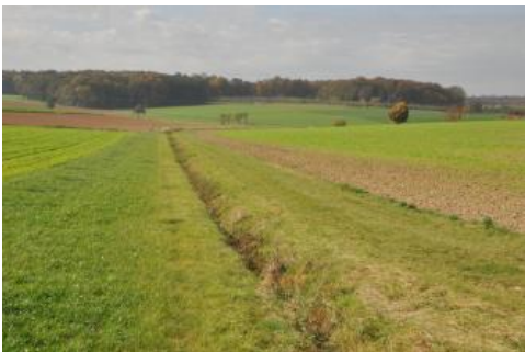
Feuchte Mulde mit Drainagegraben im Lettenkeupergebiet bei Creglingen-Freudenbach

In bewaldeten oder durch Grünland genutzten Muldentälern sind örtlich Böden verbreitet, die noch stärker durch Staunässe geprägt sind und zusätzlich auch oft Grundwassereinfluss aufweisen. Es handelt sich um Gley-Pseudogleye, Kolluvium-Pseudogleye, Parabraunerde-Pseudogleye und Gleye aus geringmächtigen holozänen Abschwemmmassen oder älteren Schwemmsedimenten, die über Fließerden oder Lösslehm lagern ( i56, i59, i99 ). In KE i97 wurden flache, mulden- und sohlenförmige Tälchen sowie Hangfußlagen abgegrenzt, in denen Kolluvium-Gleye aus meist tonreichen Abschwemmmassen vorherrschen.