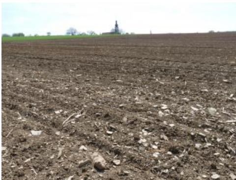
Ackerfläche im Lettenkeuper bei Wittighausen-Vilchband

Vielfach sind auf den landwirtschaftlich genutzten Flächen im Lettenkeupergebiet tonige, z. T. steinige Böden zu finden, die bereits an der Oberfläche karbonathaltig sind. Ehemals entkalkte Bodenhorizonte wurden durch die Bodenerosion abgetragen oder durch die Pflugarbeit mit karbonathaltigem Unterbodenmaterial vermischt. Vorherrschende Böden sind Pararendzinen mit Übergängen zum Pelosol ( i15 ). In geringer Tiefe, oberhalb 5 dm u. Fl. kann örtlich bereits das anstehende Ton-, Mergel-, Sand- oder Dolomitgestein auftreten. Als Begleitböden kommen vereinzelt Braunerde-Ranker aus Sandstein, Pelosol-Ranker aus Ton- und Schluffstein sowie Rendzinen aus Dolomitstein vor. In wenigen Fällen ließen sich Braunerde-Ranker und Braunerden aus Sandstein oder Sandstein führenden Fließerden als flächenhafte Vorkommen abgrenzen ( i1 , i25 ).