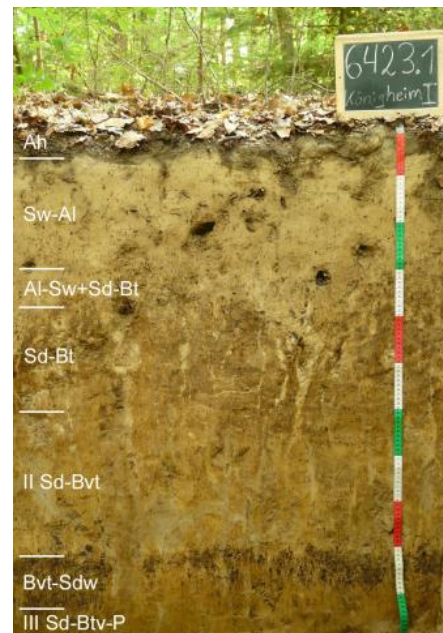
Pseudogley-Parabraunerde aus Lösslehm im „Ahornwald“ südlich von Königheim-Brehmen (i45)

Häufig ist zwischen Deck- und Basislage auch eine Mittellage vorhanden, so dass es zur Ausbildung dreischichtiger Bodenprofile kam. Meist ist in der lösslehmreichen Mittellage der Bt-Horizont einer Parabraunerde oder Pelosol-Parabraunerde entwickelt ( i41 , i43 , i47 ). Örtlich, wo der tiefere Unterboden aus dem umgelagerten Rückstandston der Dolomitsteinverwitterung besteht, handelt es sich um Terra fusca-Parabraunerden. Besonders in ebenen und schwach geneigten Lagen oder flachen Mulden sind die Mittellagen mächtiger und gehen in skelettfreien Lösslehm über, in dem keine Umlagerungsmerkmale zu erkennen sind. In solchen Reliefpositionen sind in den Böden immer auch deutliche Staunässemerkmale vorhanden. Vorherrschender Bodentyp ist die Pseudogley-Parabraunerde ( i45 ). Als Stauhhorizont wirkt neben dem Tonanreicherungshorizont (Bt) der Parabraunerde besonders auch die unter dem Lösslehm folgende tonreiche Basislage aus Lettenkeuper-Material. Als Folge der Bodenerosion sind die Tonverarmungshorizonte (Al-Horizonte) der Parabraunerden in den häufig vorkommenden Kartiereinheiten i41 und i45 oft stark verkürzt oder fehlen auf exponierten Ackerflächen auch vollständig.