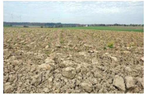
Geblichte Oberböden von Pseudogleyen auf Lettenkeuper südlich von Creglingen-Freudenbach