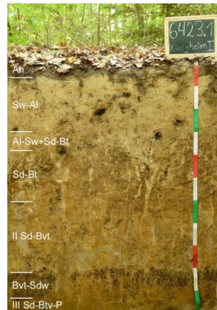
Pseudogley-Parabraunerde aus Lösslehm im „Ahornwald“ südlich von Königheim-Brehmen (i45)

Häufig ist zwischen Deck- und Basislage auch eine Mittellage vorhanden, so dass es zur Ausbildung dreischichtiger Bodenprofile kam. Meist ist in der lösslehmreichen Mittellage der Bt-Horizont einer Parabraunerde oder Pelosol-Parabraunerde entwickelt ( i41 , i43 , i47 ). Örtlich, wo der tiefere Unterboden aus dem umgelagerten Rückstandston der Dolomitsteinverwitterung besteht, handelt es sich um Terra fusca-Parabraunerden. Besonders in ebenen und schwach geneigten Lagen oder flachen Mulden sind die Mittellagen mächtiger und gehen in skelettfreien Lösslehm über, in dem keine Umlagerungsmerkmale zu erkennen sind. In solchen Reliefpositionen sind in den Böden immer auch deutliche Staunässemerkmale vorhanden. Vorherrschender Bodentyp ist die Pseudogley-Parabraunerde ( i45 ). Als Stauhohizont wirkt neben dem Tonanreicherungshorizont (Bt) der Parabraunerde besonders auch die unter dem Lösslehm folgende tonreiche Basislage aus Lettenkeuper-Material. Als Folge der Bodenerosion sind die Tonverarmungshorizonte (Al-Horizonte) der Parabraunerden in den häufig vorkommenden Kartiereinheiten i41 und i45 oft stark verkürzt oder fehlen auf exponierten Ackerflächen auch vollständig.