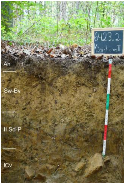
Pseudovergleyte Pelosol-Braunerde im Lettenkeupergebiet (i27)

Häufig ist zwischen Deck- und Basislage auch eine Mittellage vorhanden, so dass es zur Ausbildung dreischichtiger Bodenprofile kam. Meist ist in der lösslehmreichen Mittellage der Bt-Horizont einer Parabraunerde oder Pelosol-Parabraunerde entwickelt ( i41 , i43 , i47 ). Örtlich, wo der tiefere Unterboden aus dem umgelagerten Rückstandston der Dolomitsteinverwitterung besteht, handelt es sich um Terra fusca-Parabraunerden. Besonders in ebenen und schwach geneigten Lagen oder flachen Mulden sind die Mittellagen mächtiger und gehen in skelettfreien Lösslehm über, in dem keine Umlagerungsmerkmale zu erkennen sind. In solchen Reliefpositionen sind in den Böden immer auch deutliche Staunässemerkmale vorhanden. Vorherrschender Bodentyp ist die Pseudogley-Parabraunerde ( i45 ). Als Stauhohizont wirkt neben dem Tonanreicherungshorizont (Bt) der Parabraunerde besonders auch die unter dem Lösslehm folgende tonreiche Basislage aus Lettenkeuper-Material. Als Folge der Bodenerosion sind die Tonverarmungshorizonte (Al-Horizonte) der Parabraunerden in den häufig vorkommenden Kartiereinheiten i41 und i45 oft stark verkürzt oder fehlen auf exponierten Ackerflächen auch vollständig.