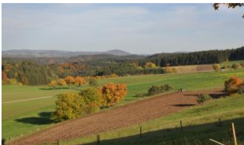
Wutachterrassen bei Bonndorf-Boll

Die größte Verbreitung haben pleistozäne Flussschotter auf den talrandnahen Flächen oberhalb der Wutach- und Gauchachschlucht. Vor dem Einschneiden der Wutach hatten die Feldbergschotter und ihre Nebenflüsse in der letzten Kaltzeit dort großflächig Kies aus dem Schwarzwald abgelagert, der bis zu 30 m mächtig sein kann. Durch Verwitterung, Verbraunung und Verlehmung haben sich auf dem sandig-kiesigen Material im Holozän Braunerden entwickelt, die unter Wald meist stark versauert und podsolig sind ( h99 ). Der stellenweise etwas geringere Kiesanteil und erhöhte Grobschluffgehalt in den oberen 3–5 dm sprechen für eine äolische Beimengung im Oberboden (Decklage). Wo die Decklage (entspr. Hauptlage in Ad-hoc-AG Boden,