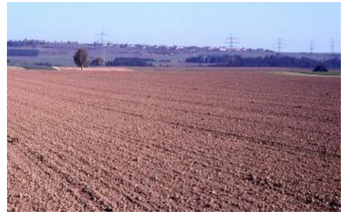
Terrassenflächen oberhalb der Gauchachschlucht bei Löffingen-Unadingen

Südlich von Löffingen-Reiselfingen und bei Löffingen-Göschweiler finden sich kleinflächig auch Braunerden aus Flussschottern, die bereits in Kaltzeiten des älteren Pleistozäns abgelagert wurden ( h94 , h97 ). Bei Göschweiler sind sie oft geringmächtig, solifluidal umgelagert und von karbonathaltigem, tonigem Verwitterungsmaterial des Muschelkalks unterlagert.