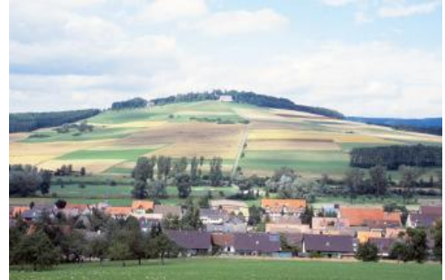
Blick nach Norden über Geisingen-Gutmadingen und das Donautal auf den Wartenberg