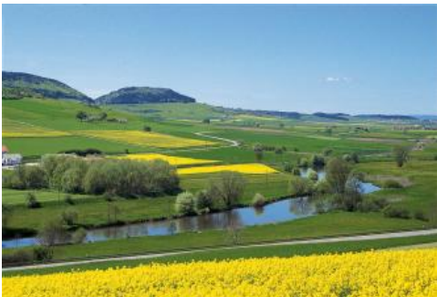
Aussicht vom Wartenberg nach Südwesten über die Donauaue zum Fürstenberg

An einigen ostexponierten Flachhängen und in Scheitelbereichen der Nordostbaar finden sich über den tonigen Mitteljura-Fließerden auch etwas mächtigere lösslehmhaltige Deckschichten (Deck- und Mittellage). Als Böden sind dort dreischichtige Pelosol-Parabraunerden und Pseudogley-Parabraunerden verbreitet ( h78 ). Selten treten mehrschichtige Böden aus lösslehmhaltigen Fließerden auf, die stärker von Staunässe geprägt sind (Pseudogley h80 ).