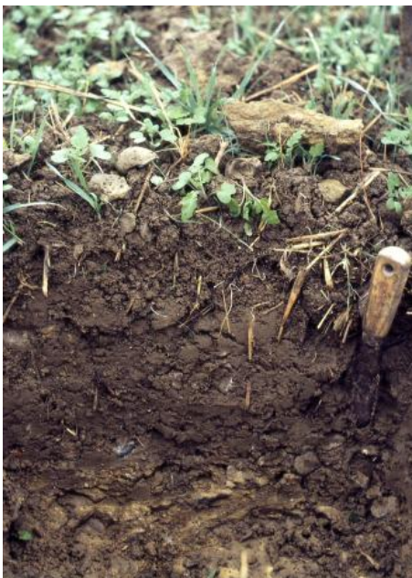
Rendzina auf Kalksteinen der Arietenkalk-Formation (Unterjura, h55)

In hängigen Lagen und auf rundlichen Scheitelbereichen, in denen die Mittellage fehlt, sind Pelosole verbreitet ( h61 ). In den Randbereichen der Plateaus und auf kleineren Verebnungen, wo Kalksteine in Oberflächennähe anstehen, dominieren Rendzinen ( h55 ). Vereinzelt, z. B. nördlich von Donaueschingen-Aasen, haben sich auf den Unterjura-Kalksteinen auch Terrae fuscae entwickelt ( h79 ). Es handelt sich aber sicherlich meist nicht um reine Rückstandstone, wie sie in den typischen Kalksteinlandschaften des Muschelkalks oder Oberjuras vorkommen. Vielmehr sind sie oft in unterschiedlichem Maße mit Mergelstein-Verwitterungsmaterial vermischt. Die Terrae fuscae sind daher mit Pelosolen und Pararendzinen vergesellschaftet. In der östlichen und südlichen Umrahmung des Donaueschinger Rieds bildet der tiefere Unterjura nur noch schmale Verebnungen und Hügellücken, auf denen der Lösslehm einfluss stark zurückgeht und Pelosole, Pararendzinen und Rendzinen vorherrschen.