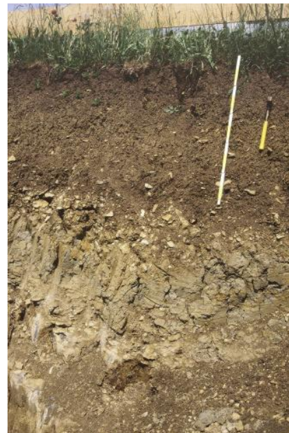
Tiefes Kolluvium in einer flachen Mulde im Unterjura-Gebiet bei Hüfingen-Sumpföfen (h82)

In den zahlreichen Muldentälchen , Senken und Hangfußlagen des Mittel- und Unterjura gebiets bilden mehr oder weniger mächtige, durch die Bodenerosion entstandene holozäne Abschwemmmassen das Ausgangsmaterial der Bodenbildung. Es handelt sich meist um lehmig-tonige Substrate, die hinsichtlich ihres Grund- und Stauwassereinflusses zu unterscheiden sind. Kaum hydromorphe Merkmale zeigen die mäßig tiefen bis tiefen Kolluvien ( h82 ) deren Einzugsgebiet hauptsächlich an den Mitteljurahängen oder auf den Arienkalk-Platten liegen. Dort kommen zudem oft sehr flache Mulden vor, in denen die Kolluvien meist weniger als 0,5 m mächtig sind ( h84 ). Die meisten anderen Kolluvien weisen meist deutliche Anzeichen zeitweiliger Staunässe auf, da sie oft nicht sehr mächtig sind und über dichtgelagerten Tonfließerden liegen. Auch die Abschwemmmassen selbst sind meist recht tonreich und schwer wasserdurchlässig. Verbreitete Böden sind daher Pseudogley-Kolluvien, die oft von Pseudogley-Pelosolen unterlagert werden ( h85 ). Das Hauptverbreitungsgebiet der noch stärker hydromorphen Kolluvium-Pseudogleye und Pseudogleye ( h81 ) liegt im Bereich der Opalinuston-Formation. Die holozänen Abschwemmmassen sind dort in den Waldgebieten allerdings oft sehr geringmächtig. Teilweise wird der wasserdurchlässige Oberboden dort auch von lösslehmhaltigen Fließerden gebildet (Deck- und/oder Mittellage). Vielerorts weist der stauende tonige Unterboden eine grauschwarze bis schwarze Farbe auf (Sumpftön).