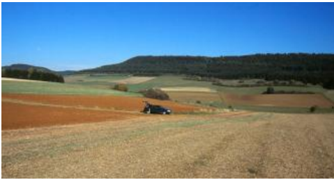
Rötliche Böden auf eisenreichen oolithischen Mergelkalken der Ostreenkalk-Formation im Mitteljura südlich von Bad Dürrenheim-Öfingen (h69, h55)

Wo sandige Kalksteine der Wedelsandstein-Formation (Blaukalke, früher: Braunjura gamma) kleine Verebnungen oder Steilkanten bilden, dominieren Rendzinen ( h55 ) und Braunerden ( h69 ). Auf den von eisenreichen oolithischen Mergelkalksteinen der Gosheim-Formation (früher: Braunjura delta) gebildeten Plateaus und Verebnungen (z. B. bei Bad Dürrenheim-Öfingen sowie unterhalb des Lupfens und des Hohenkarpfens) ist die deutliche Rotfärbung der dort vorherrschenden lehmigen Ackerböden auffallend. Die Böden werden als ferritische Braunerden ( h69 ) bezeichnet. Sie weisen meist relativ locker gelagerte Bv-Horizonte mit hohem Porenvolumen auf. Örtlich zeigen die Bodenprofile im oberen Bereich eine deutliche äolische Beimengung (Deck- und Mittellage) sowie Anzeichen einer schwachen