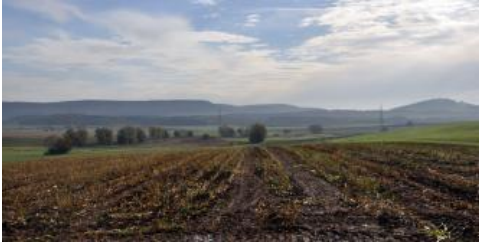
Von der Unterjura-Stufenfläche bei Pfohren geht der Blick nach Osten zur Baaralb und rechts hinten zum Wartenberg

An den bewaldeten steilen Hängen im Mitteljura-Bergland zwischen Tuningen und Talheim war bei der Bodenkartierung auffallend, dass die Decklage dort großflächig überdurchschnittliche Mächtigkeiten von mehr als 3 dm besitzt (Pelosol-Braunerden h72 , h71 ). Vermutlich waren die siedlungsfernen, steilen Hanglagen in der Vergangenheit immer bewaldet und somit vor Erosion geschützt. Besonders deutlich wird der Zusammenhang zwischen Nutzungsgeschichte und Mächtigkeit der Decklage im Bereich des Unterhölzer Walds nordwestlich von Geisingen, wo ebenfalls zweischichtige Pelosol-Braunerden vorherrschen ( h72 ). Dieses seit 1939 als Naturschutzgebiet ausgewiesene, zusammenhängende Waldgebiet ist seit jeher Herrschaftswald und war wohl nie vollständig gerodet (Vetter, 1964;