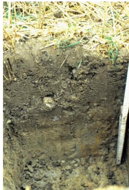
Pararendzina aus tonig-mergeligem Verwitterungsmaterial des Unterjuras (h59)