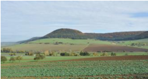
Der Hörnekopf am Rand der Baaralb bei Geisingen

Gley-Kolluvien und Gleye ( h86 , h88 ) sind v. a. in den Muldentälern im Übergang zu den feuchten Senken und Auen und unterhalb der zahlreichen Quellhorizonte verbreitet. In einigen ebenen Tiefenbereichen sowie auf Verebnungen und flachen Schwemmfächern im Übergang zu Auen und Mooren treten örtlich sehr tonreiche Substrate auf, in denen zusätzlich zum Grundwassereinfluss noch Staunässe eine Rolle spielt (Pseudogley-Gley h87 ). Am stärksten vernässt sind die in Kartiereinheit (KE) h89 abgegrenzten Bereiche mit Anmoorgleyen, Humusgleyen und Moorgleyen, die sich am Rand der vermoorten Senken im Baar-Albvorland befinden. Der aktuelle Grundwasserstand befindet sich bei diesen Böden z. T. nahe der Geländeoberfläche. Häufig ist er aber auch künstlich abgesenkt.