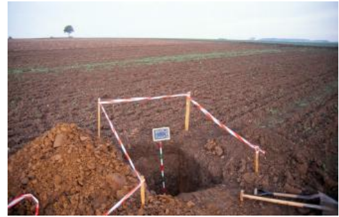
Ackerbau auf der lösslehmbedeckten Unterjura-Stufenfläche südsüdwestlich von Donaueschingen-Aasen (h74)

Nicht selten finden sich humose, dunkle Flecken in den Bt-Horizonten. In Muldentälchen, in der Unterlagerung von holozänen Abschwemmmassen, sowie im Übergang zu Mooren und feuchten Senken können sie komplett schwarzbraun gefärbt sein. Vermutlich handelt es sich um eine alte Bodenbildung („Feucht-Schwarzerde“), die durch gehemmten Humusabbau unter ehemals feuchteren Verhältnissen entstanden ist.