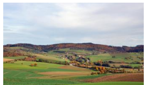
Blick nach Osten zum Randen bei Blumberg-Epfenhofen

Auch weiter südlich bilden Unter- und Mitteljura breite Rücken, Hänge und schmale Verebnungen. Sie befinden sich auf dem sog. Hallauer Rücken zwischen unterer Wutach und Klettgauer Tal sowie, dem Kleinen Randen vorgelagert, am Hochrhein zwischen Küssaberg und Lauchringen. Vorherrschende Böden auf Scheitelbereichen und Hängen sind dort zweischichtige Braunerde-Pelosole und Pelosol-Braunerden aus einer geringmächtigen lösslehmhaltigen Fließerde (Decklage) über tonreicher Fließerde (Basislage) oder Rutschmassen ( h65 , örtlich h63 ). Pelosole und Pararendzinen als Erosionsprofile kommen nur untergeordnet, v. a. im Bereich junger Hangrutschungen vor. Das Unterjuragebiet östlich von Wutöschingen-Degernau wird allerdings von Pararendzinen dominiert ( h59 ). Im Bereich der Rebhänge bei Klettgau-Erzingen besitzen sie, durch das Rigolen bedingt, einen schwach humosen Unterboden (Pararendzina-Rigosol h90 ). Stellenweise wurde dort in den Weinbergen aber auch Fremdmaterial aufgebracht.