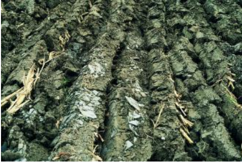
Pararendzina aus Ölschiefer (Posidonienschiefer-Formation, Unterjura) auf einer Ackerfläche bei Trossingen

Im Bereich der von der Posidonienschiefer-Formation (Ölschiefer, früher: Schwarzjura epsilon) gebildeten, meist ackerbaulich genutzten Flächen der Baar sind Tonböden (Pelosole h62 ) verbreitet, die eine charakteristische dunkle Färbung besitzen. Im Vergleich zu den Pelosolen aus anderen Tongesteinen der Baar besitzen die meist ackerbaulich genutzten Ölschieferböden aufgrund des hohen Gehalts an organischer Substanz aus dem Ausgangsgestein ein vergleichsweise lockeres Bodengefüge mit günstigerem Wasser- und Lufthaushalt. Sie neigen daher im Gegensatz zu Pelosolen aus anderen Unterjuragesteinen selten zu Staunässe. Am auffallendsten tritt der Ölschiefer dort in Erscheinung, wo durch das Pflügen flachgründiger Böden die rohen Schieferplatten an die Oberfläche geschafft wurden. Die entsprechenden Böden sind als Pararendzina zu bezeichnen ( h60 ). In Bereichen, wo härtere Mergelkalksteine