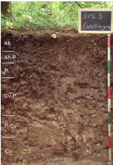
Pelosol aus Mittelkeuper-Rutschmassen (h37)

Auf vereinzelt auftretenden kleinen Verebnungen im Schilfsandstein (Stuttgart-Formation), z. B. im „Wolfbühl“ südlich von Hüfingen, sind Braunerden aus feinsandreicher, steiniger Decklage über Sandsteinersatz entwickelt ( h39 ). Auch der Stubensandstein (Löwenstein-Formation) tritt nur selten bodenbildend in Erscheinung. Die Braunerden aus sandiger Decklage über oft grobkörnigem Sandsteinersatz im Stubensandstein der Baar sind meist podsolig ausgebildet ( h41 ) und wechseln mit staunassen Zweischicht-Böden (Pseudogleye), die unter einem sandigen Oberboden einen schwer wasserdurchlässigen tonigen Unterboden besitzen. Häufig ist die Oberfläche durch ehemaligen Sandabbau gestört. In der Südbaar und oberhalb der Wutach südwestlich von Blumberg tritt im Niveau des z. T. karbonatischen Stubensandsteins oft ein kleinräumiger Bodenwechsel mit Braunerden, Pelosolen und Pararendzinen aus sandig-tonigen Fließerden über Sand-, Tonmergel- oder Dolomitstein auf ( h40 ).