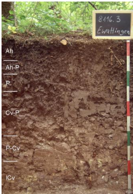
Pelosol aus Mittelkeuper-Rutschmassen (h37)

Auf vereinzelt auftretenden kleinen Verebnungen im Schilfsandstein (Stuttgart-Formation), z. B. im „Wolfbühl“ südlich von Hüfingen, sind Braunerden aus feinsandreicher, steiniger Decklage über Sandsteinersatz entwickelt ( h39 ). Auch der Stubensandstein (Löwenstein-Formation) tritt nur selten bodenbildend in Erscheinung. Die Braunerden aus sandiger Decklage über oft grobkörnigem Sandsteinersatz im Stubensandstein der Baar sind meist podsolig ausgebildet ( h41 ) und wechseln mit staunassen Zweischicht-Böden (Pseudogleye), die unter einem sandigen Oberboden einen schwer wasserdurchlässigen tonigen Unterboden besitzen. Häufig ist die Oberfläche durch ehemaligen Sandabbau gestört. In der Südbaar und oberhalb der Wutach südwestlich von Blumberg tritt im Niveau des z. T. karbonatischen Stubensandsteins oft ein kleinräumiger Bodenwechsel mit Braunerden, Pelosolen und Pararendzinen aus sandig-tonigen Fließerden über Sand-, Tonmergel- oder Dolomitstein auf ( h40 ).