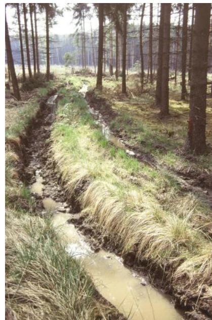
Windwurfschäden und Bodenverdichtung durch Befahrung auf staunassen Böden in einer flachen Mulde im Mittelkeuper westlich von Donaueschingen-Aasen