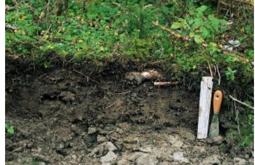
Flachgründige Braunerde aus verkieseltem Schluffstein im Mittelkeuper