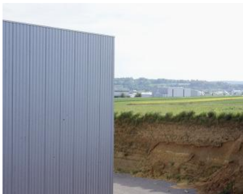
Bodenverbrauch im Bereich fruchtbarer, tiefgründiger Lössböden – Gewerbegebiet bei Renningen

Die Bodengroßlandschaft Obere Gäue umfasst eine Fläche von rund 1632 km 2 . Davon werden etwa 10,5 % von Siedlungen und Flächen der technischen und sozialen Infrastruktur (Verkehrswege, Sportgelände usw.) eingenommen. Diese in Kartiereinheit 3 zusammengefassten Bereiche werden in der Bodenkarte nicht näher beschrieben. Die Böden sind dort überwiegend entfernt, versiegelt, mit Fremdmaterial überdeckt oder stark verändert. Weitere 1,1 % der Oberen Gäue werden von Aufschüttungen (Deponien, Dämme usw.) sowie Steinbrüchen, Gruben und sonstigen Abgrabungen eingenommen (Kartiereinheiten 1, 2).