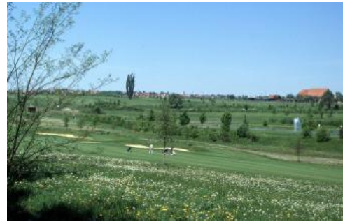
Golfplatzgelände zwischen Mötzingen und Bondorf mit großflächig veränderten Böden