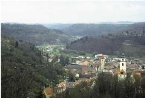
Blick nach Osten, über die Altstadt von Horb am Neckar, auf die Talschlingen des oberen Neckars

Der Südteil der Oberen Gäue wird durch den oberen Neckar und seine Nebenflüsse Eschach, Glatt, Schlichem, Eyach und Starzel entwässert. Hauptentwässerungsader der Gäuflächen südlich des Schönbuchs ist das Ammertal. Das gesamte übrige Gebiet im Norden der Oberen Gäue liegt im Einzugsgebiet von Nagold, Würm und Enz.