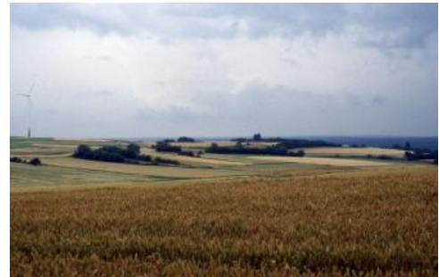
Gäulandschaft im Oberen Muschelkalk nordöstlich von Dunningen

Der Umriss der Oberen Gäue zeichnet sich deutlich in der Landnutzungskarte von Baden-Württemberg ab. Die überwiegend landwirtschaftlich genutzte Gäulandschaft grenzt an die Waldgebiete des Schwarzwalds und des Keuperberglands. Generell zeigt sich meist ein vielgestaltiges Landschaftsbild mit einem Wechsel von Ackerland, Grünland und inselhaft vorkommenden Wäldern. Die für große Teile der Gäulandschaft typischen kleinparzellierten Flurstücke gehen auf die Erbsitte der Realteilung zurück. Durch Flurbereinigungsmaßnahmen wurde diese Eigenheit nur z. T. beseitigt.