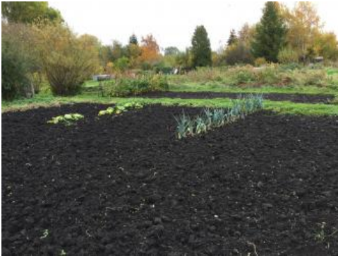
Gartenbauliche Nutzung im entwässerten, anthropogen überprägten Niedermoor im Randbereich der Würmaue bei Weil der Stadt (Merklinger Ried, g99)

Nur an wenigen Stellen kam es in den Oberen Gäuen im Holozän zu Torfbildung. Dies ist beispielsweise im Glatttal bei Glatten oder im Maisgraben nördlich von Bad Liebenzell-Möttlingen der Fall, wo an ganzjährig vernässten Quellaustritten im Unteren Muschelkalk die organische Substanz nicht abgebaut werden konnte. Ein etwas größeres Vorkommen von Niedermoortorf findet sich im Randbereich der Würmaue nördlich von Weil der Stadt. Teilweise ist der Torfkörper dort von geringmächtigem Auenlehm oder holozänen Abschwemmmassen überdeckt.