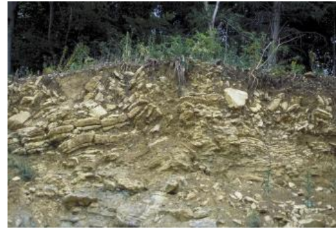
Steinbruch im Oberen Muschelkalk westlich von Zimmern ob Rottweil

Auf den verbreitet vorkommenden Ton- und Mergelgesteinen schreitet die Verwitterung relativ rasch voran, sodass sich bereits im Pleistozän Decken aus tonigem Lockermaterial bilden konnten. Bei der sehr langsam ablaufenden Lösungsverwitterung auf den Karbonatgesteinen des Oberen Muschelkalks bleibt jedoch nur sehr wenig Feinmaterial zurück. Der meist gelblich braune Rückstandston hat sich vermutlich während mehrerer Warmzeiten im Pleistozän gebildet. In den Kaltzeiten überwog dagegen die Abtragung und Umlagerung. Die Folge ist, dass man den Rückstandston in nennenswerter Mächtigkeit heute nur noch in erosionsgeschützten Reliefpositionen und als ein von jüngeren Sedimenten überdecktes Umlagerungsprodukt in Mulden und Trockentälern findet.