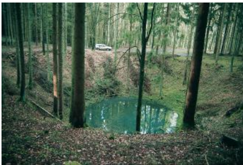
Nach starken Regenfällen kurzzeitig mit Wasser gefüllter Erdfall im Gewann „Dürrholzebene“, im Lettenkeuper südwestlich von Sulz am Neckar

Im östlich anschließenden, von Mergel-, Ton-, Dolomit- und Sandsteinen aufgebauten Lettenkeupergebiet setzen sich die Muldentälchen fort. Auch dort sind sie zunächst frei von Fließgewässern. Wegen des wasserundurchlässigen Untergrunds treten aber oft staunasse Böden auf. Erst im Unterlauf der Tälchen finden sich Quellen und kleine Bäche, die im Bereich der Hochflächenränder beim Übertritt in den verkarsteten Muschelkalk häufig wieder verschwinden. Generell sind im Übergangsbereich vom Muschelkalk zum Lettenkeuper gehäuft Dolinen bzw. Erdfälle zu finden, weil in diesem Bereich das Zwischenabflusswasser aus dem Lettenkeuper das durchlässige Kalkgestein erreicht. Das erhöhte Wasserangebot hat eine verstärkte Karbonatlösung in den unterlagernden Spalten und Klüften zur Folge und führt schließlich zur Dolinenbildung.