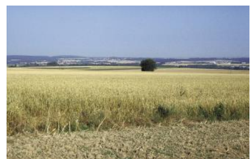
Getreideanbau auf Lössböden im Korngäu östlich von Eutingen im Gäu

Die Oberen Gäue erstrecken sich in Süd-Nord-Richtung vom jungen Neckar nördlich von Schweningen bis an die Enz bei Mühlacker. An ihrem Südwestrand schließen sie sich zwischen Schramberg-Sulgen und Loßburg an die Schwarzwald-Ostabdachung an. Bei Freudenstadt ragt das Gäu aufgrund der tektonischen Absenkung der Muschelkalkschichten im Freudenstädter Graben weit nach Westen in den Schwarzwald hinein. Weiter nördlich bildet das Nagoldtal mit den Städten Nagold und Calw die Grenze zum Schwarzwald. An ihrem Ostrand, wo die Oberen Gäue vom Kleinen Heuberg, Rammert, Schönbuch und Glemswald begrenzt werden, befinden sich die Städte Rottweil, Rottenburg, Herrenberg, Böblingen, Sindelfingen und Leonberg. Die Bodengroßlandschaft (BGL) Obere Gäue nimmt große Teile der Landkreise Rottweil, Freudenstadt, Tübingen, Böblingen, Calw und des Enzkreises ein. Ein geringerer Flächenanteil entfällt auf den Schwarzwald-Baar-Kreis, den Zollernalbkreis und den Landkreis Ludwigsburg.