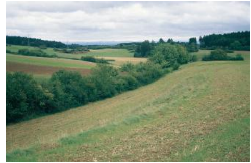
Typische, wellig-hügelige, durch Trockentäler gegliederte, verkarstete Heckengäuelandschaft im Oberen Muschelkalk, östlich von Schopfloch