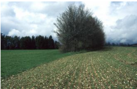
Heckengäu-Landschaft im Oberen Muschelkalk bei Dornstetten mit flachgründigen, steinigen Böden (Rendzina, g3)

Der Südteil der Oberen Gäue wird durch den oberen Neckar und seine Nebenflüsse Eschach, Glatt, Schlichem, Eyach und Starzel entwässert. Hauptentwässerungsader der Gäuflächen südlich des Schönbuchs ist das Ammertal. Das gesamte übrige Gebiet im Norden der Oberen Gäue liegt im Einzugsgebiet von Nagold, Würm und Enz.