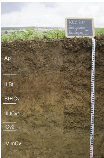
Mittel tief entwickelte erodierte Parabraunerde aus lösslehmhaltiger Fließerde über Mergelstein (f29)

Im Bereich stark zertalter Gäuflächen trifft man auf Böden aus 6–>10 dm mächtigen, lösslehmhaltigen Fließerden (Deck- über Mittellage). In den Fließerdepaketen haben sich Parabraunerden (f29) mittel tief bis tief entwickelt. Örtlich reicht die Bodenentwicklung im tieferen Unterboden bis in die Fließerde aus Lettenkeupermaterial (Basislage). Auf den weitgehend ebenen Gäuflächen ist die Basislage z. T. nur geringmächtig und als karbonathaltiger IC-Horizont ausgeprägt oder sie fehlt vollständig. Nicht selten sind die Böden unter landwirtschaftlicher Nutzung jedoch stark erodiert, sodass nur noch Pararendzinen bzw. Parabraunerde-Pararendzinen vorliegen (f10). Regelmäßig treten diese Ah/C-Böden z. B. entlang des Glemstals auf. Die größere Entfernung zum Neckar als Hauptvorfluter, ein schlecht durchlässiger tonreicher Untergrund sowie höhere Niederschläge in der Backnanger Bucht führten örtlich zur Ausbildung von Pseudogley-Parabraunerden (f34). Bei abnehmender Mächtigkeit der lösslehmhaltigen Fließerden (4–8 dm) bestimmen dreischichtige Bodenprofile aus Deck-, Mittel- und Basislage die Bodendecke. Hier wechseln sich Pelosol-Parabraunerden mit überwiegend mäßig tief entwickelten Parabraunerden ab (f35).