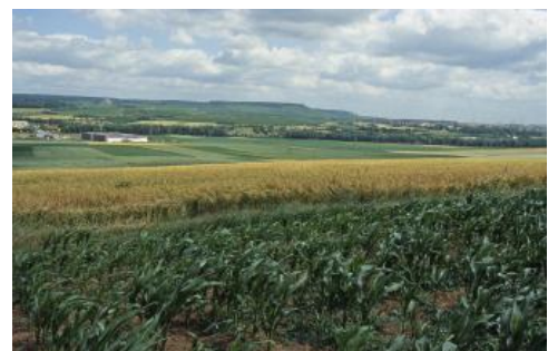
Im Zabergäu zwischen Cleeborn und Brackenheim

Östlich und südlich des Neckarbeckens beginnen die Anstiege zu den Keuperlandschaften der Schwäbisch-Fränkischen Waldberge und des Mittleren und Westlichen Keuperberglands. Die vorgelagerten Gipskeuperhügel wurden in der Bodenkarte den Keuperlandschaften zugeordnet, sofern sie nicht von Löss und Lösslehm bedeckt sind. Im Nordwesten erheben sich Strom- und Heuchelberg über die Gäulandschaften. Zwischen beiden liegt die Bucht des Zabergäus. Insgesamt verläuft die Grenze zu den Keupergebieten aufgrund der zwar markanten, aber stark zerlappten Schichtstufe mit ihren Randbuchten und Zeugenbergen sowie der kleinräumig wechselnden Ablagerung von Löss und Lösslehm eher unscharf. Die Abgrenzung zu den Oberen Gäuen im Südwestlichen Neckarbecken weicht ebenfalls von der Naturräumlichen Gliederung ab. Sie erfolgte östlich des Strudelbachs zwischen Leonberg und Enzweihingen und richtet sich nach der Verbreitung von Böden aus tiefgründigem Löss oder Lösslehm. Westlich des Strudelbachs bildet die Talau der Enz die Grenzlinie. Im Nordwesten liegt der Kraichgau als zweite benachbarte Gäulandschaft. Hier wurde die Grenze der Bodengroßlandschaft vom Abfall des Heuchelbergs bis zum Leintal geführt. Vom Talaustritt der Lein aus bildet die Neckaraue bzw. anschließende Terrassenflächen die Grenze zwischen dem Kraichgau im Westen und den Kocher-Jagst-Ebenen im Osten.