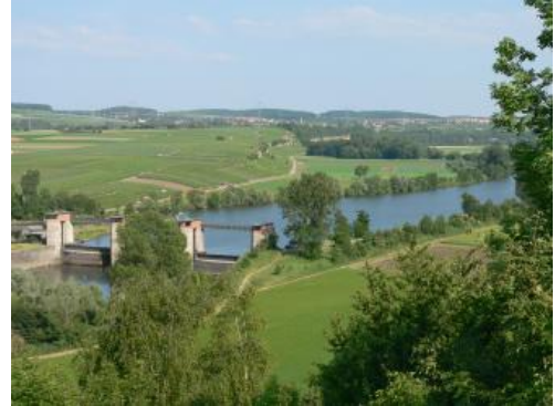
Das Neckartal unterhalb von Talheim