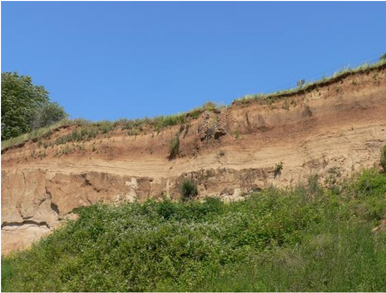
Aufgelassene Kiesgrube bei Heilbronn-Frankenbach mit mächtigen Löss-Deckschichten

Im (rißzeitlichen) Löss ist an der Basis eine flache Mulde mit Schwemmsediment eingetieft. Darüber erkennt man den fossilen Bt-Horizont der letzten Warmzeit (Eem). Der wärmzeitliche Löss beginnt mit der dunkelgrauen Mosbacher Humuszone. Der Lohner Boden zeigt sich hier als dünneres, braunes Band. Ganz oben dann die rezente Parabraunerde.