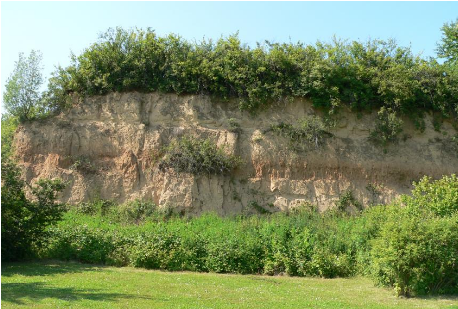
Lössaufschluss in Heilbronn-Böckingen westlich des Wasserturms