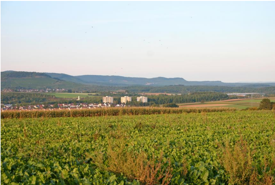
Blick vom Schmiechberge zwischen Roßwag und Illingen zum Stromberg im Nordosten