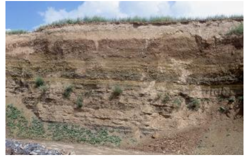
Steinbruch im Schozachtal westlich von Ilsfeld – Lettenkeuper, Höhenschotter und Löss

Tundrenzeitliche Naßböden mit Rost- und Bleichflecken sowie Fe-/Mn-Konkretionen finden sich im Löss des Jungwürm und in der Abfolge der Bruchköbeler Böden, die im südhessischen Lössgebiet zuerst beschrieben wurden. Sie untergliedern den über 6 m mächtigen Rißlöss unter dem ersten Paläoboden, welcher zur Eem-Warmzeit (126 000–115 000 v. H.) gehört. Von den Verbraunungshorizonten sind besonders der olivstichige Lohner Boden mit seinem typischen wellig-blättrigen Gefüge und der wenig unterhalb liegende, stärker bräunlich gefärbte Böckinger Boden zu nennen. Sie sind unter einer trockenen Strauch-Tundra entstanden und zeitlich ins Mittelwürm einzuordnen. Dazu kommen die Humuszonen als Schwarzerdebildungen, die auf ein kaltzeitliches (Wald-)Steppenklima zurückzuführen sind. Sie liegen im Profil jeweils wenig oberhalb des ersten und dritten Bt-Horizonts. Die unterste, 14 dm mächtige Humuszone wird nach Bibus (1989a) als Heilbronner Humuszone bezeichnet.