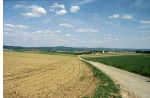
Die Backnanger Bucht zwischen Kirchberg an der Murr und Großaspach

Von den Stufenrandbuchten wird v. a. die Backnanger Bucht durch eine tektonische Sattellage bestimmt, in welcher der Obere Muschelkalk weit nach Osten ausgreift. Den Nordrand der Backnanger Bucht markieren die Störungen der Neckar-Jagst-Furche. Bei der Remstaltraufbucht in der Südostecke des Neckarbeckens ist die Schichtaufwölbung deutlich geringer ausgeprägt. Die Remstalbrüche bewirken nördlich der Rems bei Kleinheppach ein Zurückweichen des Gipskeupers bis an den Anstieg der Keuper-Schichtstufe. Einige Kilometer nordwestlich davon ist zwischen Waiblingen-Hegnach und Fellbach-Oeffingen im Grabenbereich noch Schilfsandstein vorhanden, der die Kuppe der Hart bildet. Das Zabergäu liegt zwischen der Stromberg-Mulde im Süden und dem westlich an die Heilbronner Mulde anschließenden Heuchelberg. Aufgrund der starken Lössablagerung in der Leelage des Strombergs zählt v. a. der südlich der Zaber gelegene Teil bis weit nach Westen mit zum Neckarbecken. Der Pleidelsheimer Mulde folgt der Höhenzug des Kälbling, der als Ausläufer des Gipskeuper-Hügellands das Einzugsgebiet der Bottwar abgrenzt. Seine lössfreien Lagen wurden in der Bodenkarte zusammen mit den Zeugenbergen des Wunnensteins den Schwäbisch-Fränkischen Waldbergen zugeordnet.