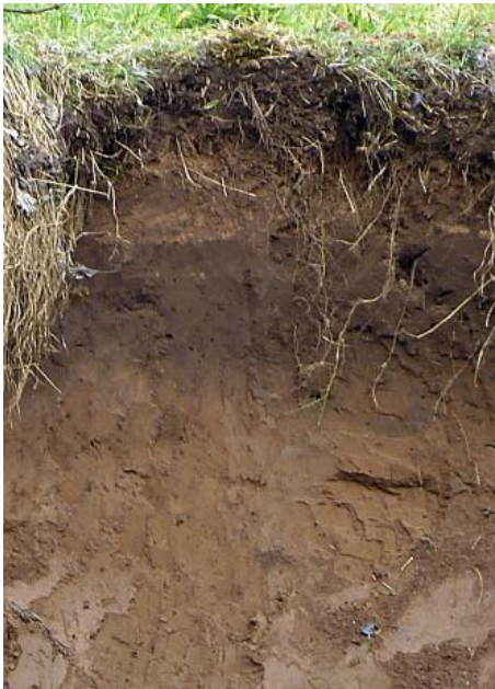
Kalkreicher Brauner Auenboden aus Auensand über Auenlehm der Enz (f55)

Von liegenden Solifluktionsdecken unterscheidet sich die Decklage durch eine geringere Lagerungsdichte und häufig durch unterschiedliche Steingehalte sowie eine stellenweise ausgebildete Steinsohle an ihrer Basis. Unter der Decklage folgt häufig die ihrerseits z. T. mehrgliedrig aufgebaute Basislage . Sie besteht ausschließlich aus aufgearbeitetem liegendem oder verlagertem, hangaufwärts anstehendem Gesteinsmaterial und ist also frei von einer äolischen Beimengung. In Bereichen mit härteren Gesteinen im Untergrund kann die Basislage fehlen. Die Decklage liegt hier häufig direkt dem anstehenden, oberflächlich oft etwas zersetzten Festgestein auf. In Reliefpositionen mit hohem Lösseintrag schaltet sich zwischen Deck- und Basislage die deutlich lösslehmbeeinflusste Mittellage ein.