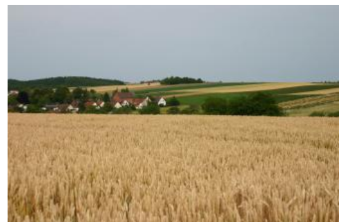
Gäufäche bei Marbach-Rielingshausen

Landnutzung in der Bodengroßlandschaft Neckarbecken (generalisierte ATKIS-Daten des LGL Baden-Württemberg)