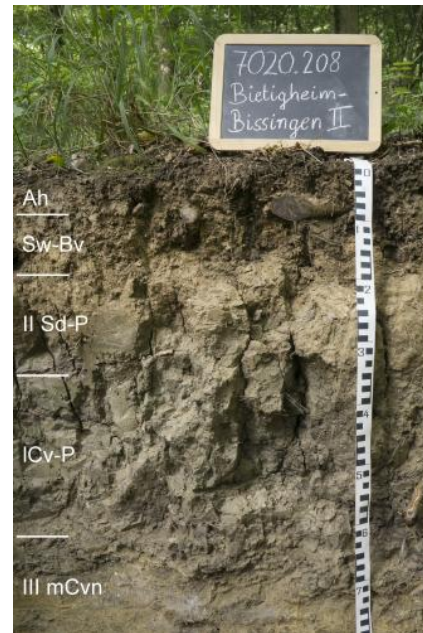
Mäßig tief entwickelter Pseudogley-Braunerde-Pelosol aus geringmächtiger lösslehmhaltiger Fließerde über tonreicher Fließerde aus Lettenkeupermaterial auf Mergelstein (f16)

Nach dem Ende der letzten Kaltzeit herrschte zunächst Formungsruhe, bis der wirtschaftende Mensch etwa seit der Älteren Jungsteinzeit (Bandkeramik, ca. 7000 Jahre v. H.) begonnen hat, durch Rodungen und Ackerbau in die Naturlandschaft einzugreifen (Schlichtherle, 1994). Dies führte zu teilweiser Erosion der periglazialen Deckschichten und der darin entwickelten Böden. Besonders weitreichende Folgen hatten die mittelalterlichen Rodungsphasen. Der Anteil der Ackerflächen und der Bodenabtrag waren damals wesentlich höher als heute. Dabei kam es nach Bork et al. (1998, S. 197, S. 221 ff.) in der ersten Hälfte des 14. Jh. im Zusammenspiel mit extremer Witterung zu äußerst starken Erosionsereignissen, bei denen etwa die Hälfte des mittelalterlich-neuzeitlichen Bodenabtrags stattfand. Die Abtragungsprodukte der Bodenerosion sammelten sich als junge, örtlich sehr mächtige holozäne Abschwemmassen vor allem in den zahlreichen Muldentälchen sowie in Hangfußlagen und sonstigen Hohlformen oder als Auenlehme und -sande in den Flusstälern.