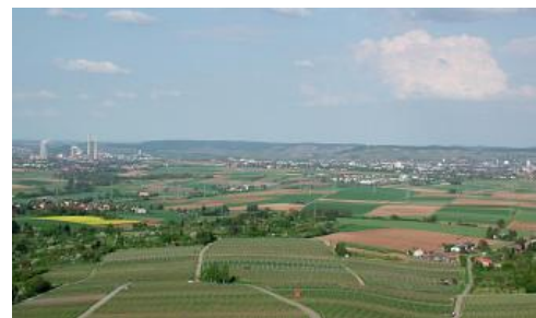
Das Neckarbecken bei Heilbronn

Das Neckarbecken ist Teil der Schwäbisch-Fränkischen Gäulandschaften und stellt einen der großen Tiefenbereiche der süddeutschen Schichtstufenlandschaft dar (Dongus, 1961; Huttenlocher & Dongus, 1967; Schmithüsen, 1952; Semmel, 2002). Es erstreckt sich zwischen Stuttgart und Heilbronn sowie von Mühlacker bis Backnang jeweils über eine Entfernung von gut 40 km. Großflächig von Löss und Lösslehm bedeckte, waldarme Gäuplatten sowie tief in den Oberen Muschelkalk eingeschnittene Flusstäler sind die wichtigsten Landschaftselemente des Neckarbeckens. Durch die fruchtbaren Lössböden sowie die Klima- und Verkehrsgunst entwickelte sich das Neckarbecken zum Siedlungsschwerpunkt und damit zum Kernland Baden-Württembergs.