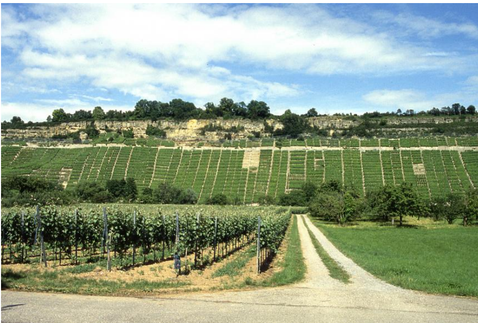
Rebterrassen am Neckartalhang unterhalb der Hessigheimer Felsengärten