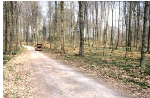
Im Pfahlhofwald südöstlich von Neckarwestheim

Von Natur aus wäre das Neckarbecken mit Ausnahme weniger Fels- und Trockenstandorte vorherrschend bewaldet. Waldmeister-Buchenwälder stellen auf weiten Flächen die potentielle natürliche Vegetation dar (Arbeitsgemeinschaft Forsteinrichtung, 2005, S. 289 ff.). In den kollinen Buchen-Eichen-Wäldern kommen sowohl Stiel- als auch Traubeneichen vor. Sie bilden auf wechselfeuchten oder tonigen Standorten z. T. Hainbuchen-Eichen-Gesellschaften. Vom Mittelalter bis ins 20. Jh. erfolgte eine mittelwaldartige Bewirtschaftung. Dabei entwickelte sich ein zweischichtiger Waldaufbau mit einer Unterschicht aus Stockausschlägen zur Brennholznutzung und einer Oberschicht aus großkronigen Eichen, die für Bauholz, zur Schweinemast und zur Förderung der Naturverjüngung stehen gelassen wurden. Durch die große Buchenmast von 1888 konnten viele dieser Wälder mit Buchen bestockt und in die jetzigen Hochwälder überführt werden. Die Wälder des Neckarbeckens verteilen sich heute bevorzugt auf die steilen Hänge der Muschelkalktäler und auf den Ausstrich des Unterkeupers. An den Muschelkalk-Hängen finden sich örtlich noch Reste alter Kleinterrassen, so dass in diesen Bereichen Sekundärwälder vorliegen. Der Pfahlhofwald südöstlich von Neckarwestheim als ehemaliges herrschaftliches Jagdrevier bildet eines der wenigen größeren Waldgebiete auf Löss und Lösslehm. Weitere Waldungen liegen bei Heimerdingen und Höfingen im Südteil der Strudelbachplatte sowie bei Backnang auf Lösslehm.