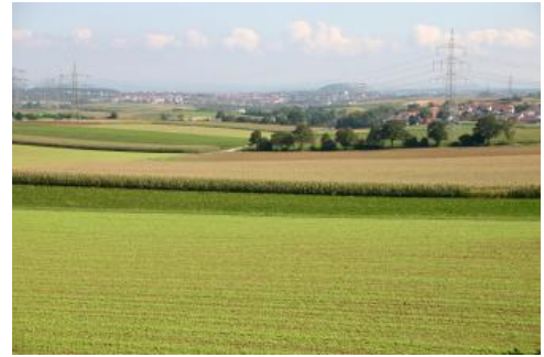
Blick über die Gäufläche von Eberdingen-Hochdorf über Markgröningen zum Asperg

Die Schichtlagerung hat ebenfalls erheblichen Einfluss auf die Landschaftsformen und die Verbreitung der Gesteine an der Oberfläche. Der Südteil des Neckarbeckens liegt im tektonischen Hochgebiet des Schwäbisch-Fränkischen Sattels. Hier erreicht die Muschelkalk/Unterkeuper-Schichtgrenze Höhenlagen um 300 m ü. NHN. Die das Neckarbecken umgebende Keuper-Schichtstufe sowie die Umgebung von Heilbronn und Pleidelsheim liegen in tektonischen Mulden. In der Heilbronner Mulde sinkt die Schichtgrenze zwischen Keuper und Muschelkalk bis etwa 120 m ü. NHN ab. Diese größeren Einheiten sind in sich weiter durch Schichtverbiegungen und Verwerfungen gegliedert. Dadurch wird der einfache Bauplan der Gäulandschaft abgewandelt und die Vielfalt durch den Wechsel von ebenen Gäuplatten, Hanglagen oder inselhaften Vorkommen von Festgesteinen gesteigert. Um die aufgewölbten Sattellagen zu überwinden, mussten sich die Flüsse tief einschneiden. Die Unterschiede zwischen Prall- und Gleithängen sind in diesen engen Talabschnitten besonders stark ausgeprägt. In den tektonischen Mulden kam es zu einer Aufschotterung. In den Bereichen mit flacher Schichtlagerung liegen die kaum zertalten, großflächig mit Löss bedeckten und weitestgehend ackerbaulich genutzten Naturräume des Neckarbeckens. Dazu gehören z. B. das Lange Feld südlich von Ludwigsburg, das Schmidener Feld oder der östliche Teil des Zabergäus.