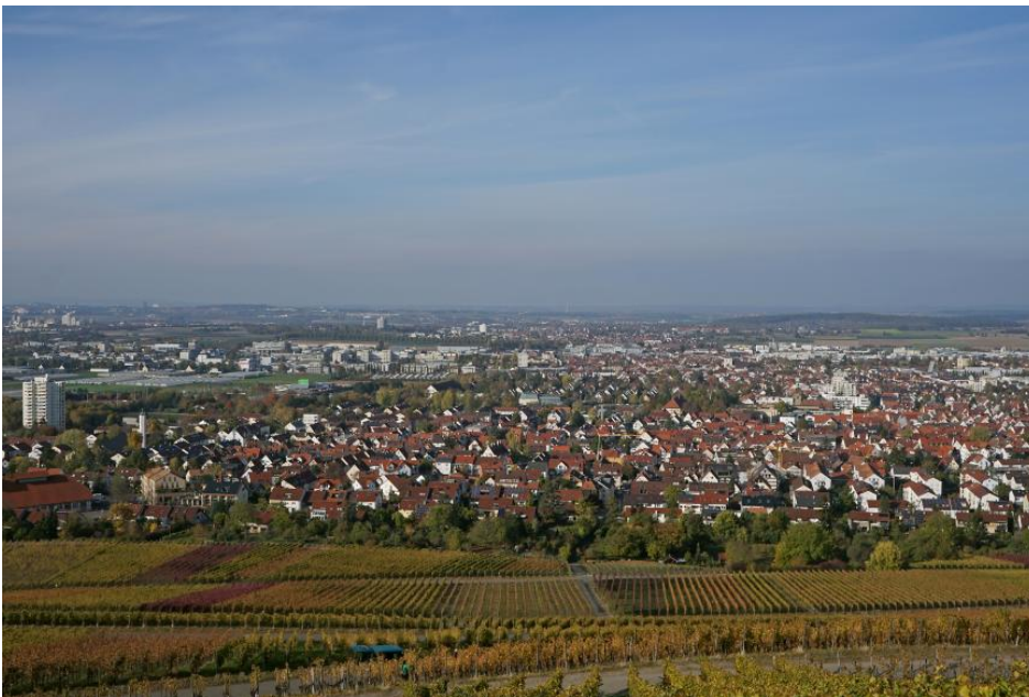
Blick vom Kappelberg auf Fellbach und das Schmidener Feld

in der Römerzeit und dem Mittelalter war das Neckarbecken ein Schwerpunkt der Besiedlung und landwirtschaftlichen Nutzung in Südwestdeutschland. Neben zahlreichen Haufendörfern entwickelte sich während des mittelalterlichen Landesausbaus eine Reihe befestigter Kleinstädte, wie z. B. Lauffen am Neckar, Markgröningen, Besigheim und Waiblingen. Die beherrschenden Siedlungszentren bilden jedoch die heutige Landeshauptstadt Stuttgart und die ehemalige freie Reichsstadt Heilbronn. Dazwischen liegt das zu Beginn des 18. Jh. durch Herzog Eberhard Ludwig von Württemberg gegründete Ludwigsburg als Mittelzentrum. Seit dem Beginn der Industrialisierung und besonders nach dem Zweiten Weltkrieg haben sich die Siedlungsflächen enorm ausgeweitet. So liegt der Anteil der Siedlungs- und Verkehrsfläche im Landkreis Ludwigsburg (2017) mit knapp 25 % weit über dem Durchschnitt in Baden-Württemberg (14,6 %).