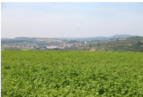
Blick nach Nordwesten über das Enztal auf Vaihingen an der Enz

Die Gesteinsabfolge bestimmt das Grundmuster der Landschaftsformen im Neckarbecken. Der harte Muschelkalk hat zur Ausbildung der Gäuplatten mit steilen Talhängen und schmalen, meist grundwasserfernen Talböden geführt. Durch die unterirdische Auflösung des Karbonatgesteins (Verkarstung) bildeten sich Dolinen. In den Gesteinen des Lettenkeupers und Gipskeupers entwickelte sich eine wellige bis flachhügelige Landschaft. Die Täler der Seitenbäche sind meist wenig eingetieft, breiter und feuchter als diejenigen im Oberen Muschelkalk. Die Lössanwehung führte auf den breiten Plateaus zu einem ausgeglicheneren Relief. Der Transport des Lösses mit Westwinden brachte die bevorzugte Ablagerung in den Leelagen der nord- und ostexponierten Hänge und damit die Entwicklung der asymmetrischen Talhänge mit sich. Die Arbeit der Flüsse hinterließ