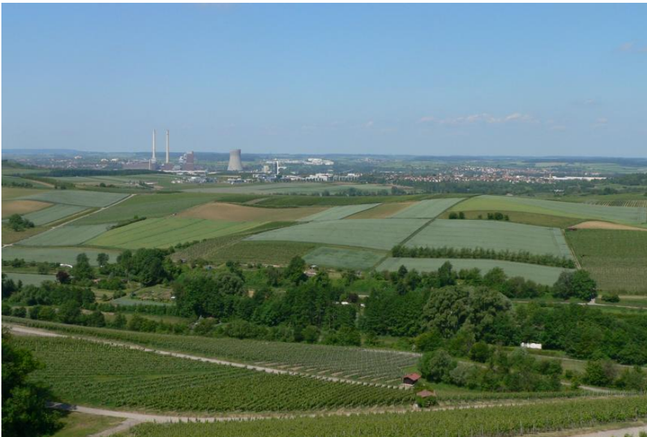
Blick von den Weinbergen an der Schilfsandstein-Schichtstufe nördlich von Erlenbach über lössbedeckte Gipskeuperhügel auf das Neckartal bei Neckarsulm

Für die Angaben zur Klimatischen Wasserbilanz wurde die digitale Version des Wasser- und Bodenatlas Baden-Württemberg herangezogen (Ministerium für Umwelt, Klima und Energiewirtschaft Baden-Württemberg, 2012).