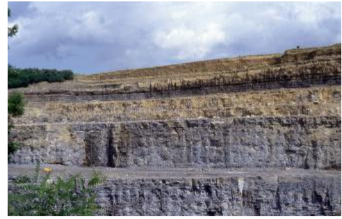
Steinbruch im Schozachtal westlich von Ilsfeld (Lkr. Heilbronn)