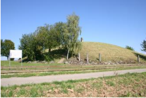
Der rekonstruierte Grabhügel des Fürstengrabes von Hochdorf

Den ältesten Hinweis auf menschliches Leben im Neckarbecken bildet ein weiblicher Schädel, der 1933 in der ehem. Kiesgrube Bauer in Steinheim an der Murr gefunden wurde ( Homo steinheimensis ). Er lag in sandigen Ablagerungen unterhalb der (rißzeitlichen) Hochterrassenschotter und wurde der Holstein-Warmzeit zugeordnet (Brunner, 1994, S. 64 ff.). Seit dem Beginn des Ackerbaus vor etwa 7500 Jahren gehört das Neckarbecken mit seinen fruchtbaren Lössböden zu den bevorzugten Siedlungsräumen. Zeugen davon sind z. B. Reste einer stadtartigen Siedlung aus der Zeit der Linearbandkeramik bei Ilsfeld. In der Bronzezeit diente der Asperg bei Ludwigsburg als Sitz keltischer Fürsten. Vom damaligen Wohlstand der Herrscher haben sich die Beigaben aus dem Hügelgrab des Keltenfürsten von Hochdorf bis heute erhalten (Biel, 1991, 1985). Auch