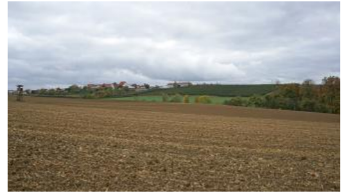
Ackerland und Obstanbau bei Burgstetten-Kirschenhardthof

Der Weinbau prägt die Täler von Neckar, Enz und Rems seit Jahrhunderten. Die ursprünglich noch weiter verbreiteten Kleinterrassen wurden im Rahmen der Flurbereinigung im 20. Jh. teilweise zu größeren, mit Maschinen befahrbaren Parzellen zusammengefasst. Aus den klimatisch weniger günstigen, ortsfernen und aufgrund der Hangneigung schwierig zu bewirtschaftenden Lagen, z. B. im unteren Rems- und mittleren Murrtaal, hat sich der Weinbau wieder zurückgezogen. Auf günstigen Standorten wurde die Rebkultur auf die Gäufläche mit Lössböden ausgedehnt. Außer dem Weinbau ist im Neckarbecken auch der Erwerbsobstbau von Bedeutung. Dabei überwiegt der Apfelanbau mit etwa drei Vierteln der Anbaufläche sehr deutlich vor Birnen und Kirschen. Weite Bereiche der Gäuflächen bilden dafür gute bis sehr gute Standorte, die zudem für anspruchsvolle, wärmeliebende Sorten geeignet sind (Min. für Ernährung, Landwirtschaft und Umwelt Baden-Württemberg, 1978). Den Anbau begrenzende Faktoren, wie z. B. Spätfrostgefahr oder schlechte Bodendurchlüftung, treten nur auf einem untergeordneten Flächenanteil auf.