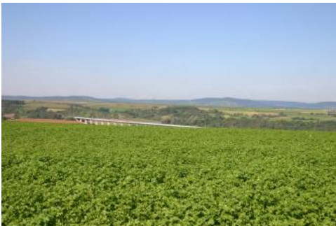
Gäuplatten zwischen Vaihingen an der Enz und Markgröningen

Die Gäuplatten weisen ein nur wenig gegliedertes Höhenprofil auf. Meereshöhen von 280–320 m ü. NHN im Zentralbereich der Plateaus sind weit verbreitet. Nur im Heilbronner Becken, im anschließenden Zabergäu und zwischen Murr und Pleidelsheim fällt die Gäufläche deutlich bis auf etwa 200 m ü. NHN ab. Einzelne Zeugenberge mit Plateaus aus Schilfsandstein erreichen gut 350 m ü. NHN. Der Neckar tritt bei 214 m ü. NHN bei Bad Cannstatt in das Neckarbecken und liegt bei Heilbronn auf etwa 150 m ü. NHN. Aufgrund der tektonischen Gliederung des Gebiets wechseln wenig eingetiefte, breite Talabschnitte mit bis über 100 m tief eingeschnittenen Engtalbereichen ab.