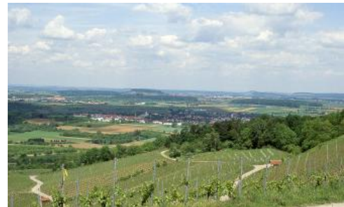
Blick von den Rebhängen am Korber Kopf über Schwaikheim und die Innere Backnanger Bucht zum Lemberg bei Affalterbach

In den tektonischen Muldenlagen sind örtlich, z. B. im Asperger Hügelland, die Ton- und Mergelsteine des Gipskeupers (Grabfeld-Formation) auf größeren Flächen verbreitet. Im Bereich von Verwerfungen, z. B. entlang der Neckar-Jagst-Furche, ist vereinzelt auch der Schilfsandstein (Stuttgart-Formation) erhalten. Der harte Sandsteindeckel hat den Gipskeuper im Liegenden vor Abtragung geschützt und es kam zu einer Reliefumkehr. So ragen heute Zeugenberge wie der Hohenasperg und der Lemberg bis zu 100 m über die lössbedeckte Gäufläche empor.