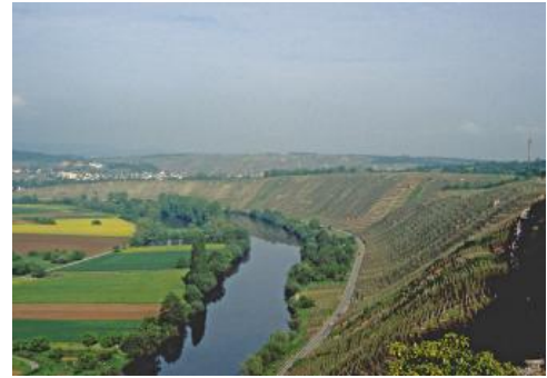
Das Neckartal nordwestlich von Hessigheim

Besonders eindringlich hat sich der Wechsel von Mulden- und Sattellagen innerhalb der Bodengroßlandschaft auf das Neckartal ausgewirkt (Fezer, 2007). Der Neckar tritt unterhalb von Stuttgart-Bad Cannstatt in das Neckarbecken ein. Er verläuft im Gebiet der Marbach-Waiblinger Täler in einem asymmetrischen Tal mit steilen West- und Prallhangbereichen und einer meist sanften lössbedeckten (Süd-)Ostflanke. An Gleithängen finden sich Terrassenreste. Mit Beginn der Pleidelsheimer Mulde weitet sich das Tal, der Muschelkalk taucht unter die Talsohle ab und die Hänge fallen nur noch 20–30 m tief bis zur Talaue ab. Unterhalb von Kleiningersheim verengt sich das Tal wieder und der Neckar durchbricht in den Besigheim-Lauffener Talschlingen den Hessigheimer Sattel. Drei verlassene Flussschlingen prägen hier die Landschaftsformen. Die Neckarwestheimer Schlinge ist die älteste