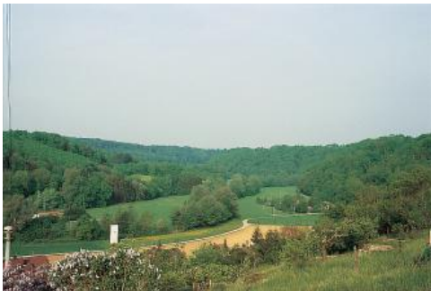
Das Murrthal im Oberen Muschelkalk zwischen Burgstall und Kirchberg an der Murr

Die Talsysteme der Gäulandschaften unterscheiden sich erheblich voneinander. Im Neckarbecken streben viele Seitenflüsse von Westen oder Osten dem Neckar im Zentrum zu. Das Flussgebiet der Enz wird innerhalb der Bodengroßlandschaft v. a. durch die von Süden zuströmende, tief in den Oberen Muschelkalk eingeschnittene Glems verstärkt. Die auf weiter Strecke im Neckarbecken verlaufende Murr kann eine größere Anzahl von Seitentälern sammeln. Die Bäche der Backnanger Bucht laufen von Norden und Süden teilweise parallel auf die Murr zu. Im Nordteil kann sich die im unteren Talabschnitt parallel zum Neckar laufende Schozach mit einem verzweigten Einzugsgebiet behaupten. Auf größeren Gäuplatten beginnt das Talsystem bevorzugt in west-östlicher Richtung. Auffallend sind dabei einige breit ausgeräumte Wannen im von Löss bedeckten Unterkeuper. Im