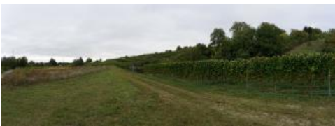
Hangfuß an der Bergstrasse nördlich von Leimen

Die Lössvorkommen im Main-Tauber-Gebiet unterscheiden sich von denen im Oberrheingraben und Kraichgau. Aufgrund der größeren Entfernung vom Ausblasungsgebiet und einer beigemengten Lokalkomponente besitzen sie einen höheren Tongehalt. Die dort kartierten Pararendzinen wurden in einer eigenen Kartiereinheit zusammengefasst ( D92 ). Oft sind sie auch in lössreichen Fließerden entwickelt, die noch wenig Buntsandsteingrus enthalten können. Die Einheit D92 findet sich hauptsächlich an flachen Unterhängen und auf Terrassen im Taubertal sowie in kleineren Nebentälern des Mains. Als Begleitböden treten erodierte Parabraunerden auf.