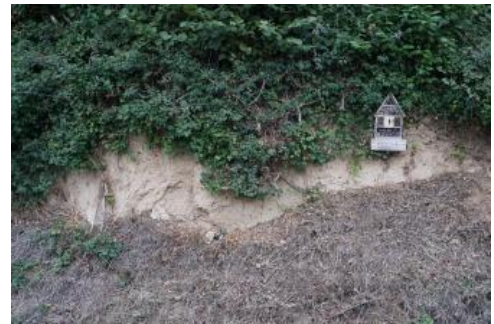
Lössaufschluss in den Weinbergen an der Bergstraße südlich von Heidelberg

Im Übergang zum Kraichgau finden sich bei Bammental, Wiesenbach und Lobbach an oft konvex gewölbten, schwach geneigten Hängen Pararendzinen aus Löss ( D4 ). Die ursprünglich vorhandenen Parabraunerden wurden dort im Laufe der langen Nutzungsgeschichte vollständig erodiert, so dass jetzt der kalkhaltige Löss an die Oberfläche tritt. Kartiereinheit D4 kommt auch an der südlichen Bergstraße zwischen Heidelberg und Nußloch vor. Häufig sind die Böden dort jedoch zusätzlich durch die weinbauliche Nutzung überprägt und weisen regelmäßig einen schwachen Humusgehalt im Unterboden auf (Pararendzina-Rigosol, D48 ).