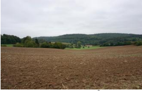
Lösslandschaft bei Wiesenbach im Übergang vom Kleinen Odenwald zum Kraichgau

Bei den über 1 m tief entkalkten Parabraunerden ( D27 ), deren Tonverarmungshorizont durch Bodenerosion bereits deutlich verkürzt ist, dürfte es sich im Randbereich der Lössverbreitung um geringmächtigen, völlig durchverwitterten würmzeitlichen Löss handeln, der von älterem Lösslehm unterlagert wird. Gelegentlich findet man bei tieferen Bohrungen unterhalb von ca. 1,5–2 dm u. Fl. einen älteren, vermutlich rißzeitlichen Rohlöss. Andererseits beschreibt Zöller (1996) eine 2 m tief entwickelte Parabraunerde auf Würmlöss an der Bergstraße südlich von Heidelberg und führt die ungewöhnlich tief reichende spätglaziale bis holozäne Entkalkung bzw. Bodenbildung auf die hohen Jahresniederschläge am Westrand des Odenwalds zurück.