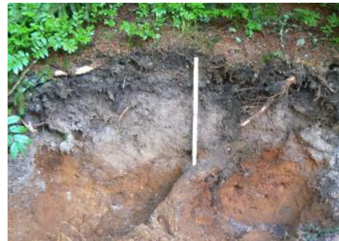
Podsol aus Glazialsediment ( a22 )

Der Bereich der Glazialablagerungen im Südschwarzwald ist durch einen kleinräumigen Wechsel der Böden und ihrer Eigenschaften gekennzeichnet. In Abhängigkeit von der Nutzung und dem Ausgangsmaterial, das sehr grob und sandig sein kann, finden sich alle Übergänge von der z. T. humosen Braunerde bis zum Podsol. Sie sind mit Grund- und Stauwasserböden sowie kleinen Mooren in den Hohlformen vergesellschaftet ( a22 ). Wo die Moränen lückenhaft und geringmächtig sind und/oder an Hängen in Hangschuttdecken aufgearbeitet wurden, dominieren wiederum Braunerden, podsolige Braunerden und humose Braunerden ( a23 , a52 , a53 ). Am ungünstigsten für die waldbauliche Nutzung sind dabei die stärker podsolierten Böden im Verbreitungsgebiet mittel- bis grobkörniger Granite in der weiteren Umgebung des Schluchsees. Es handelt sich dabei um Podsol-Braunerden, Braunerde-Podsole und untergeordnet auch um Podsole aus verlagertem Verwitterungsmaterial des Bärhalde- und Schluchsee-Granits ( a27 ).