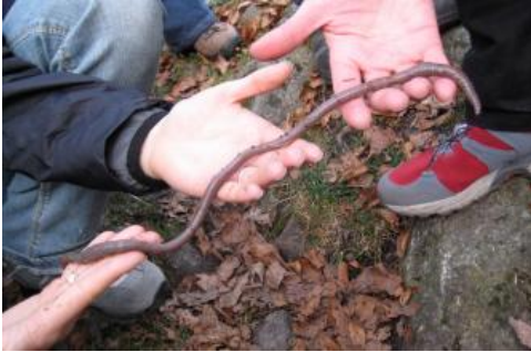
Der im Südschwarzwald beheimatete badische Riesenregenwurm Lumbricus badensis

Neben dem Mineralbestand der Festgesteine spielen beim Podsolierungsgrad und der Humusform noch weitere Faktoren eine Rolle. So ist in Laub- und Mischwäldern, wie sie im Südschwarzwald häufig vorkommen, die Humusform i. d. R. günstiger und die Podsolierung schwächer ausgeprägt als in langjährig mit Nadelholz genutzten Waldgebieten. Auch historische Waldnutzungsformen wie Streurechen oder Waldweide und der dadurch bedingte Nährstoffzug spielen eine Rolle. Einen wichtigen Einfluss besitzt auch die Bodenart bzw. das Ausmaß der äolischen Beimengung in der obersten Deckschicht. So neigen Braunerden aus schluffreicheren, bindigeren Substraten tendenziell weniger zur Podsolierung als die eher sandigen Böden. Im Südschwarzwald, wo podsolige Braunerden neben humosen Braunerden und Braunerden nur untergeordnet vorkommen ( a25 , a26 ), spielt der Regenwurm Lumbricus badensis eine