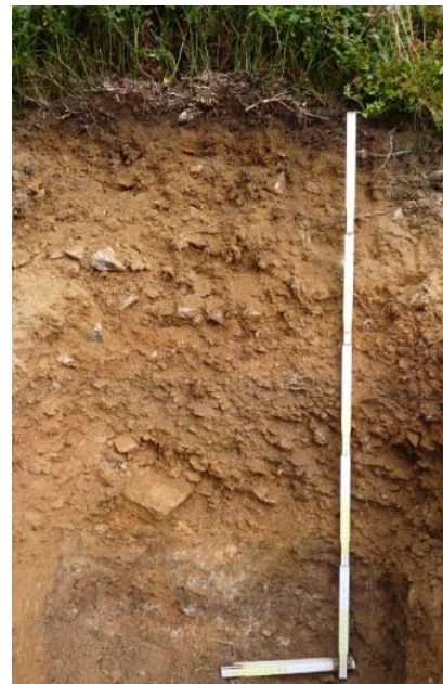
Podsolige Braunerde aus Gneisschutt führenden Fließerden über Gneisszersatz (a50)

Durch Verwitterung, Verbraunung und Verlehmung wurden die Minerale der Kristallingesteine aus ihrem Verband gelöst. Neben Quarzsand entstanden aus den Feldspäten und Glimmern Tonminerale und braun färbende Eisenoxide. In den Deckschichten aus silikatischem Gesteinsmaterial entwickelten sich so im Laufe des Holozäns überwiegend mittel tief bis tief entwickelte Braunerden. Da die Kartiereinheiten mit Braunerden als Leitböden im Grundgebirgs-Schwarzwald über 84 % der Fläche einnehmen, ist die Bodenvielfalt in der Bodengroßlandschaft nicht besonders groß. Nur in den lössbeeinflussten, tiefgelegenen Randzonen gehen die Braunerden kleinräumig in Parabraunerden über und in Talsohlen ergänzen Auenböden das Bodenmuster. Eine wesentliche weitere Differenzierung ergibt sich aufgrund des stark vom Relief abhängigen Bodenwasserhaushalts. Ein großer Teil der hohen Niederschlagsmengen sickert in die durchlässigen Deckschichten ein und bewegt sich oberflächenparallel über dichter gelagerten Schuttdecken und dem anstehenden Grundgebirge abwärts. In Hangnischen, Mulden und Tälern tritt das Grundwasser wieder nahe an die Oberfläche, sodass dort verbreitet Gleye und Anmoorgleye bis hin zu Mooren auftreten.