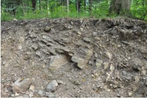
Ranker aus Gneiszersatz am Urenkopf bei Haslach (a122)

Problematischer ist die Wasser- und Nährstoffversorgung an flachgründigen Standorten auf schmalen Berg- und Hangrücken oder in Kammlagen, wo die Braunerden z. T. nur flach entwickelt und mit Rankern vergesellschaftet sind ( a212 , a120 , a122 ). Die nFK ist dort nur sehr gering bis gering (20–90 mm) und die Bäume sind in Trockenperioden darauf angewiesen, sich zusätzlich mit dem Wasser aus Felsspalten und Klüften zu versorgen. Noch extremere Standorte, was Durchwurzelbarkeit, Wasser- und Nährstoffversorgung angeht, finden sich im Verbreitungsgebiet der Kartiereinheiten a207 und a1 . Dort tritt der anstehende Fels oft an die Oberfläche und es treten Block- oder Steinschutthalde auf, die fast keinen Feinboden enthalten. In den Kartiereinheiten a212 und a1 wurden neben den flachgründigen Böden aus Granit auch die Standorte auf hartem, schwer verwitterbarem und