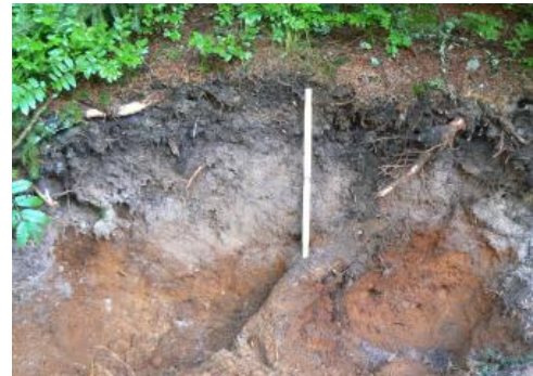
Podsol aus Glazialsediment

Der Bereich der Glazialablagerungen im Südschwarzwald ist durch einen kleinräumigen Wechsel der Böden und ihrer Eigenschaften gekennzeichnet. In Abhängigkeit von der Nutzung und dem Ausgangsmaterial, das sehr grob und sandig sein kann, finden sich alle Übergänge von der z. T. humosen Braunerde bis zum Podsol. Sie sind mit Grund- und Stauwasserböden sowie kleinen Mooren in den Hohlformen vergesellschaftet ( a22 ). Wo die Moränen lückenhaft und geringmächtig sind und/oder an Hängen in Hangschuttdecken aufgearbeitet wurden, dominieren wiederum Braunerden, podsolige Braunerden und humose Braunerden ( a23 , a52 , a53 ). Am ungünstigsten für die waldbauliche Nutzung sind dabei die stärker podsolierten Böden im Verbreitungsgebiet mittel- bis grobkörniger Granite in der weiteren Umgebung des Schluchsees. Es handelt sich dabei um Podsol-Braunerden, Braunerde-Podsole und untergeordnet auch um Podsole aus verlagertem Verwitterungsmaterial des Bärhalde- und Schluchsee-Granits ( a27 ).