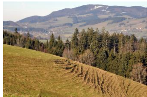
Blick nach Nordwesten über die Hochmulde von St. Peter zum Kandel (1241 m ü. NHN)

Die Erosionsanfälligkeit der Braunerden ist wegen ihres guten Infiltrationsvermögens und dem damit verbundenen geringen Oberflächenabfluss als gering anzusehen. Die in Hohlformen und Hangfußlagen vorkommenden Kolluvien zeigen aber, dass es in der Vergangenheit nach Kahlschlägen und infolge von Ackerbau in Hanglage zu Bodenerosion gekommen ist. Auf beweideten Flächen können Trittschäden an viel begangenen Stellen in Hofnähe oder um Viehtränken die Grasnarbe verletzen und so Ansatzstellen für die linienhafte Erosion schaffen. Ein ähnliches Problem gibt es heute in den beliebten Gipfelregionen des Feldbergs und Belchens, wo Touristen die ausgeschilderten Wege verlassen.