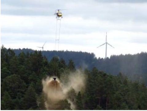
Waldkalkung auf versauerten Granit-Böden bei Triberg

Die Bodeneigenschaften wurden im Laufe der Zeit durch den Einfluss des Menschen verändert (vgl. Kap. Landnutzung und Siedlungsgeschichte). Während Rodungen, Holzraubbau, Streuentnahme und Beweidung oft eine zusätzliche Nährstoffverarmung, Versauerung und Podsolierung der heutigen Waldböden zur Folge hatten, sind Waldböden, die früher stets als Acker oder Wiese genutzt wurden, heute weniger stark versauert und enthalten höhere Nährstoffvorräte (Bürger, 2004). An Unterhängen und in Talböden führte die Wiesenwässerung zu Veränderungen im Nährstoffhaushalt und Körnungsspektrum der Böden. Der Austrag von Schwermetallen aus Halden und Verhüttungsanlagen des historischen Bergbaus hatte im Schwarzwald stellenweise erhöhte Schwermetallgehalte in der Umgebung und in talabwärts gelegenen Auenböden zur Folge (Bergfeld et al., 1995; Manz et al., 1995; LUBW,