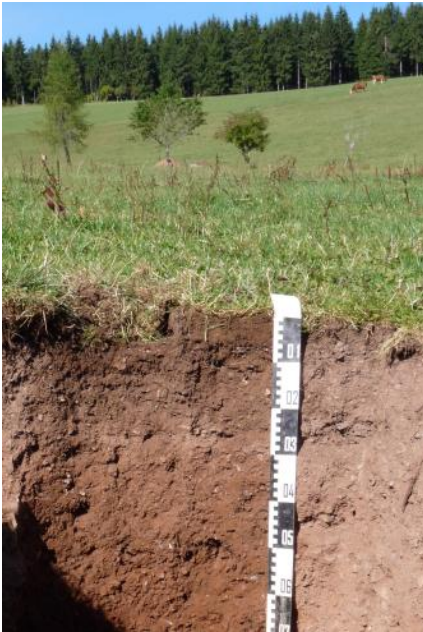
Kolluvium über Braunerde in der Talanfangsmulde oberhalb der Brigachquelle (a81)

Die mittel tief- bis tiefgründigen Auenböden der Täler mit mäßigem Grundwassereinfluss ( a6 , a82 , a83 ) sind gut zu bewirtschaftende, produktive Grünlandstandorte. Wo Dämme vor Überschwemmungen schützen, wie im Kinzigtal zwischen Hausach und Offenburg, oder wo ältere Auensedimente auf hochwasserfreien Auenterrassen liegen ( a63 , a129 , a130 ), werden die Böden auch ackerbaulich genutzt. Die stärker vernässten Talsohlen mit Auengleyen ( a7 , a8 , a224 ) sind dagegen meist Wiesen vorbehalten. Durch Drainagemaßnahmen oder Bodenauftrag wurden diese Bereiche z. T. auch stark verändert (z. B. a128 ).