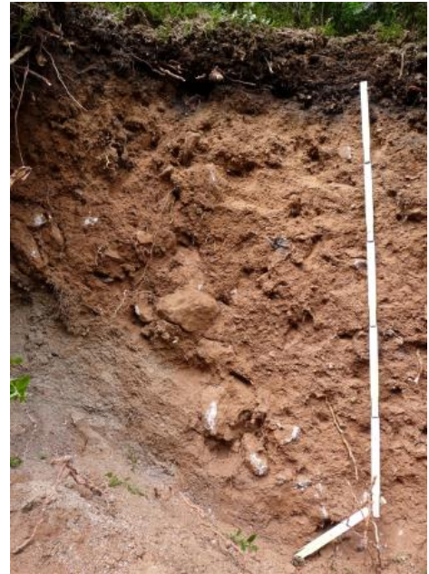
Tief entwickelte podsolige Braunerde aus Fließerden über Granitzersatz ( a209 )

In vielen Granitgebieten dominieren dagegen podsolige Braunerden, die örtlich mit stärker podsolierten Böden vergesellschaftet sind (Podsol-Braunerde, Braunerde-Podsol; a209 , a5 , a12 , a212 , a213 ). Besonders grobkörnige und quarzreiche Granite wie der Eisenbach-Granit zwischen Titisee-Neustadt und Villingen neigen zu sandig-grusiger Verwitterung und starker Versauerung. In diesem Raum können auch im mittleren Grundgebirgs-Schwarzwald voll entwickelte Podsole vorkommen ( a14 ), wie sie sonst nur für den Buntsandstein-Schwarzwald typisch sind. Sie besitzen einen hellen gebleichten Oberboden, Anreicherung von Humus und Eisenoxiden im Unterboden und eine meist mit Heidelbeeren bewachsene Auflage aus schwarzem Rohhumus. Es handelt sich um sehr stark versauerte Böden mit wenig Bodenleben und schlechten Nährstoffverhältnissen. Stärker podsolierte Böden mit den Waldhumusformen Moder oder Rohhumus kommen auch dort vor, wo den Deckschichten Gesteinsschutt aus dem hangaufwärts anstehenden Buntsandstein beigemischt ist ( a203 , a204 ).