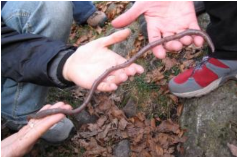
Der im Südschwarzwald beheimatete badische Riesenregenwurm Lumbricus badensis

Neben dem Mineralbestand der Festgesteine spielen beim Podsolierungsgrad und der Humusform noch weitere Faktoren eine Rolle. So ist in Laub- und Mischwäldern, wie sie im Südschwarzwald häufig vorkommen, die Humusform i. d. R. günstiger und die Podsolierung schwächer ausgeprägt als in langjährig mit Nadelholz genutzten Waldgebieten. Auch historische Waldnutzungsformen wie Streurechen oder Waldweide und der dadurch bedingte Nährstoffzug spielen eine Rolle. Einen wichtigen Einfluss besitzt auch die Bodenart bzw. das Ausmaß der äolischen Beimengung in der obersten Deckschicht. So neigen Braunerden aus schluffreicheren, bindigeren Substraten tendenziell weniger zur Podsolierung als die eher sandigen Böden. Im Südschwarzwald, wo podsolige Braunerden neben humosen Braunerden und Braunerden nur untergeordnet vorkommen ( a25 , a26 ), spielt der Regenwurm Lumbricus badensis eine