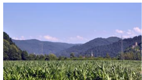
Kinzigtal bei Hausach

Die mittel tief- bis tiefgründigen Auenböden der Täler mit mäßigem Grundwassereinfluss ( a6 , a82 , a83 ) sind gut zu bewirtschaftende, produktive Grünlandstandorte. Wo Dämme vor Überschwemmungen schützen, wie im Kinzigtal zwischen Hausach und Offenburg, oder wo ältere Auensedimente auf hochwasserfreien Auenterrassen liegen ( a63 , a129 , a130 ), werden die Böden auch ackerbaulich genutzt. Die stärker vernässten Talsohlen mit Auengleyen ( a7 , a8 , a224 ) sind dagegen meist Wiesen vorbehalten. Durch Drainagemaßnahmen oder Bodenauftrag wurden diese Bereiche z. T. auch stark verändert (z. B. a128 ).