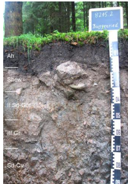
Stagnogley-Gley aus Fließerden (Decklage über periglaziär umgelagertem permzeitlichem Verwitterungsmaterial), Begleitboden in a41; Musterprofil 8215.2

Wo in den feuchten bis nassen und z. T. vermoorten Gebieten keine Entwässerungsmaßnahmen durchgeführt wurden, sind sie für die land- und forstwirtschaftliche Nutzung problematische Standorte. Der ganzjährige Sauerstoffmangel im Boden macht die Bewirtschaftung schwierig. Für naturnahe, an Feuchtigkeit angepasste Vegetation sind sie dagegen von besonderer Bedeutung.