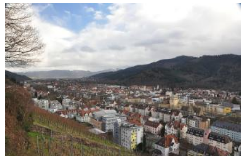
Dreisamtal bei Freiburg

Die Bodengroßlandschaft Grundgebirgs-Schwarzwald umfasst eine Fläche von 3531 km 2 . Davon entfallen etwa 4,2 % auf Siedlungen und Flächen der technischen und sozialen Infrastruktur (Verkehrsflächen, Sportgelände usw.). Diese in Kartiereinheit 3 zusammengefassten Bereiche werden in der Bodenkarte nicht näher beschrieben. Die Böden sind dort überwiegend entfernt, versiegelt, mit Fremdmaterial überdeckt oder stark verändert. Bei 0,3 % der Fläche handelt es sich um Aufschüttungen (Deponien, Dämme usw.) sowie Steinbrüche, Gruben und sonstige Abgrabungen (Kartiereinheiten 1, 2 und 4).