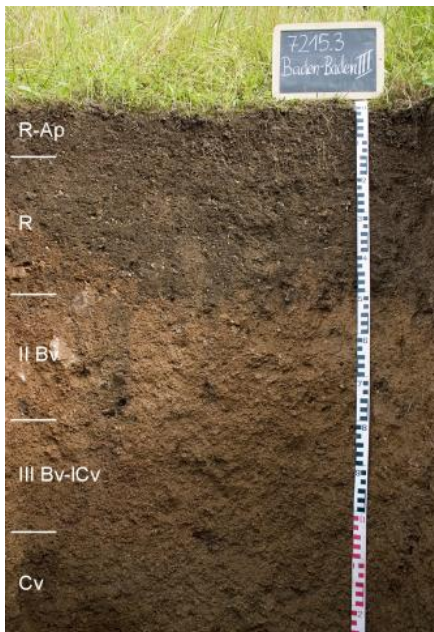
Mäßig tiefer Braunerde-Rigosol aus oberflächennah umgelagerter Granit-Fließerde auf Granitzersatz (a201)

Der heute an den Grundgebirgshängen am Fuß des Schwarzwalds v. a. zwischen Offenburg und Bühl betriebene Weinanbau hatte in früheren Zeiten noch eine größere Ausbreitung. So wurde im 19. Jh. noch im Kinzigtal hinauf bis Wolfach an den Südhängen Wein angebaut. Die Weinbergsböden der aktuellen und früheren Weinberge wurden in Kartiereinheit a201 zusammengefasst. Durch den Tiefumbruch (Rigolen) besitzen die ehemaligen Braunerden bis in den Unterboden einen geringen bis mittleren Humusgehalt. Mit abnehmender Höhenlage erfolgt eine zunehmende Beimengung von Lössmaterial in den Fließerden. Die Bodenarten der Rigosole schwanken daher stark zwischen lehmig-sandigen und schluffreichen Körnungen. Vielfach sind die Rigosole auch aus ehemaligen Parabraunerden in lösslehmreichen Fließerden hervorgegangen. In rebflurbereinigten und durch Terrassenbau geprägten Rebanlagen sind die ursprünglichen Böden sehr stark verändert und mit Auftragsböden vergesellschaftet.