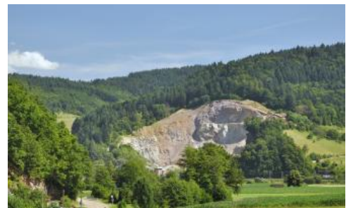
Flasergneis-Steinbruch bei Hausach-Hechtsberg im Kinzigtal

Die Braunerden aus Schuttdecken der im Mittleren Schwarzwald weit verbreiteten basenärmeren Flasergneise sind unter Wald oft podsolig ( a206 ). Die Schuttdecken aus dem harten, oft felsbildenden Gestein sind im Vergleich zu KE a3 skelettreicher und sandiger ausgebildet und die Böden weisen tendenziell eine geringere Entwicklungstiefe auf.