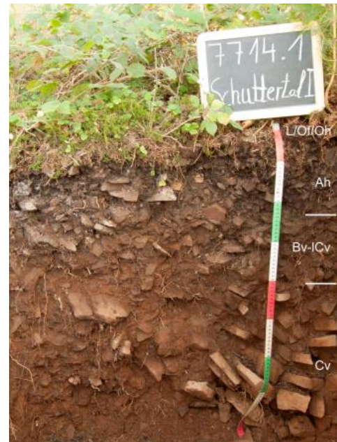
Braunerde-Regosol aus einer Schuttdecke aus Brandeck-Quarzporphyr (Begleitboden in a212)

In den ebenen bis schwach geneigten Scheitelbereichen auf den zwischen den Tälern gelegenen Bergrücken sind mittel und mäßig tiefe, unter Wald podsolige Braunerden verbreitet ( a213 ). In 3–7 dm Tiefe folgt oft schon der angewitterte Granit, örtlich auch Quarzporphyr (Rotliegend-Magmatite) oder Ganggesteine. Begleitend können auch stärker podsolierte Böden vorkommen und in Mulden und Sattellagen treten örtlich geringmächtige Kolluvien sowie Gley-Braunerden auf. Während Kartiereinheit a213 ihr Hauptverbreitungsgebiet im Nordschwarzwald und Mittleren Schwarzwald hat, ist die auf den schmalen Bergkämmen und Hangrücken ausgewiesene Kartiereinheit a212 in den Granitgebieten des gesamten zertalten westlichen Grundgebirgs-Schwarzwalds verbreitet. Neben flach und mittel tief entwickelten, stein- und blockführenden podsoligen Braunerden sind dort z. T. auch nur flachgründige Braunerde-Ranker und Ranker entwickelt.