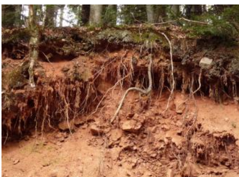
Rötlich gefärbte Braunerde aus Gneis-Schutt südlich von St. Peter (a3)

Gelegentlich treten an den Hängen, v. a. im Verbreitungsgebiet der Kartiereinheiten a3 und a30 , Braunerden auf, deren Solummaterial eine leuchtend rotbraune Farbe besitzt. Als Ursache wird eine geringe Beimengung des rotfärbenden Eisenoxids Hämatit angenommen, das aus sogenannten Ruschelzonen stammt und mit verlagert wurde (Garcia-Gonzalez & Wimmenauer, 1975; Stahr, 1979, S. 38). Ruschelzonen sind die Bereiche an tektonischen Störungen, in denen das Gestein stark zerrüttet ist. Über geologische Zeiträume hinweg konnte dort das Wasser tief ins Gebirge eindringen und rötliche Verwitterungsprodukte erzeugen. Örtlich, z. B. in der Gegend um St. Peter bei Freiburg, kann auch eine Beimengung umgelagerter Reste von Rotliegendesedimenten die Ursache für die Rotfärbung sein.