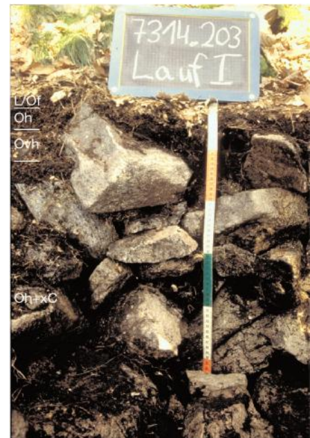
Skeletthumusboden auf Gneis-Blockschutt (a207)

Bereichsweise finden sich unterhalb von Felsen auch Skeletthumusböden, die aus jungem Gesteinsschutt bestehen, der in den Zwischenräumen lediglich schwarzen Feinhumus enthält. Teilweise werden diese Bildungen von den älteren Braunerden unterlagert. Im Bereich der Felsen und auf grobem Blockschutt treten zusätzlich Ranker, Syroseme und Felshumusböden auf. In eingeschnittenen Rinnen können Hanggleye, Quellengleye und Nassgleye auftreten. Die Böden der an den Fels- und Schutthängen der Granitgebiete ausgewiesenen Kartiereinheit a1 sind z. T. deutlich podsoliert und oft durch Ansammlungen großer Blöcke („Wollsäcke“) gekennzeichnet. Der Feinboden ist sandiger als an den Schutthängen im Gneis- und Migmatitgebiet ( a207 ). Beide Kartiereinheiten treten überwiegend als eher kleinflächige Vorkommen auf. Gewisse Verbreitungsschwerpunkte gibt es jedoch in den schluchtartigen Tälern des Südschwarzwalds (Höllental, Zastler Tal, St. Wilhelmer Tal, Albtal, Schwarzatal usw.).