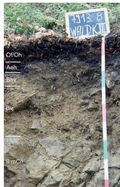
Mittel tief entwickelte podsolige Braunerde aus Hangschutt über anstehendem Paragneis (a120)