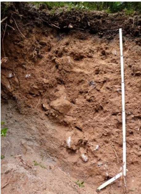
Tief entwickelte podsolige Braunerde aus Fließerden über Granitzersatz (a209)

An mehreren Stellen wurden an Unterhängen, in flachen Hangfußlagen und Mulden am westlichen Schwarzwaldrand Böden mit deutlichen Staunässemerkmalen kartiert ( a89 , Pseudogley-Braunerde bis Pseudogley). Beim Ausgangsmaterial handelt es sich um Abfolgen verschiedener Fließerden, örtlich auch um Verschwemmungssedimente. Als dichtgelagerte Stauhorizonte wirken hier meist lösslehmhaltige Fließerden (Mittellage) oder tonig-lehmige Basislagen.