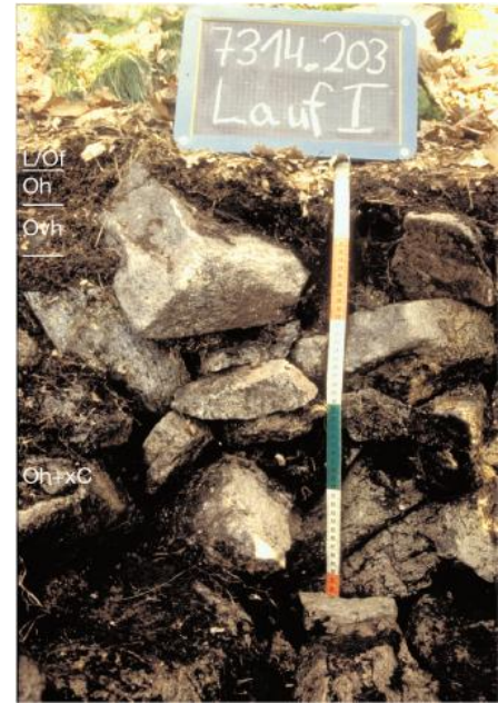
Skeletthumusboden auf Gneis-Blockschutt ( a207 )

Eine eigene Kartiereinheit ( a20 ) wurde für die steilen bis sehr steilen, z. T. felsigen Grundgebirgshänge im Bereich der Wutachschlucht vergeben. Es wechseln dort sehr flachgründige mit tiefer entwickelten Braunerden, die mit Rankern und Braunerde-Regosolen aus Hangschutt vergesellschaftet sind. Im Bereich von Felsen und Schutthalden sind zudem Syrosemi und Skeletthumusböden verbreitet. Den Schuttdecken in KE a20 ist stellenweise Buntsandstein- oder Muschelkalk-Material aus höheren Hangabschnitten beigemischt. Örtlich führen sie auch umgelagerte pleistozäne Schotter.