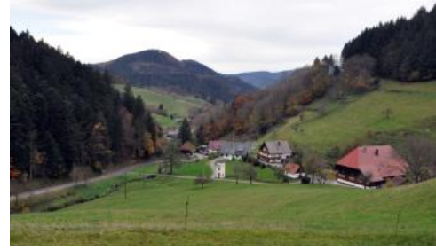
Kirnbachtal südlich von Wolfach im Mittleren Schwarzwald

Für die unteren Hangbereiche im Mittleren Schwarzwald, die durch die landwirtschaftliche Nutzung in historischer Zeit eine starke anthropogene Überprägung erfahren haben, wurde insbesondere im Kinzigtal und seinen Nebentälern eine eigene Kartiereinheit a132 vergeben. Die Hänge in Höhenlagen zwischen 250 und 800 m NN werden heute überwiegend als Grünland oder Wald und nur in den tieferen Lagen örtlich durch Obst- und Ackerbau genutzt. Über Jahrhunderte, z. T. bis in die Mitte des 20. Jh. hinein, fand dort jedoch eine Feld-Gras- oder Feld-Wald-Wirtschaft statt, die sog. Reutbergwirtschaft (vgl. Übersichtskapitel). Folgen dieser Wirtschaftsweise sind Wald- und Grünlandböden, die durch die frühere Bodenbearbeitung bis in den Unterboden humos sind (Braunerde, rigolte Braunerde). Daneben finden sich durch die Bodenerosion verkürzte Bodenprofile wie flach entwickelte Braunerden und Braunerde-Ranker sowie die zugehörigen Kolluvien am Unterhang und in Hangmulden. Mancherorts sind Ackerterrassen und Lesesteinhaufen als Zeugen der vergangenen Nutzungsformen erhalten.